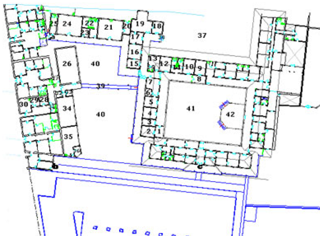
Fig. 9. Plano dependencias de la Escuela de Terapia Ocupacional

Toda esta información fue complementada con datos obtenidos a partir de entrevistas con la Directora de la Escuela, y con el Arquitecto de la Planta Física de la Facultad de Medicina, lo que en su conjunto permitió evaluar la mejor forma de modificar este entorno.