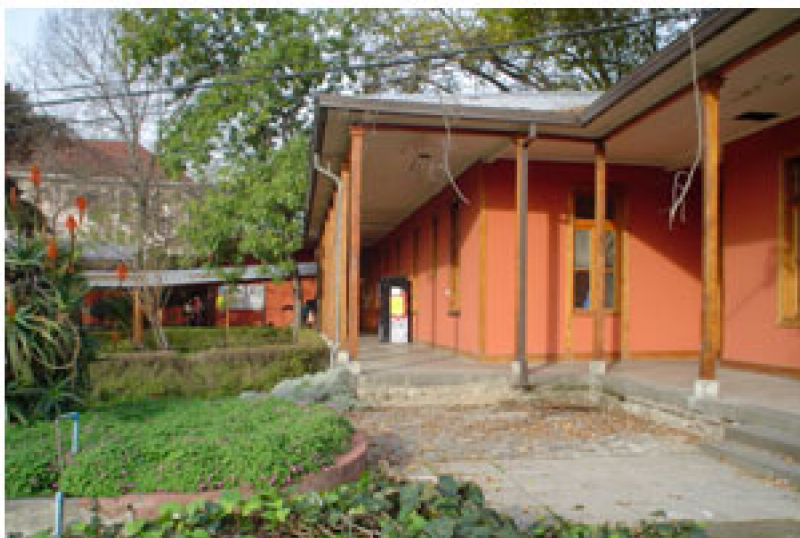
Fig. 4. Vista de la actual Escuela de Terapia Ocupacional

En 1872 el presidente de la época, don Federico Errázuriz Zañartu, afectado por una epidemia de viruela que azotaba al país, decidió la construcción de un Lazareto para valoriosos. Se encarga esta labor al Arquitecto Eusebio Chelli, obra que se inaugura tres años mas tarde, en 1875. Durante su funcionamiento el hospital estuvo al cuidado de la Congregación de las Hermanas de la Caridad, quienes instalan una capilla en el patio central.