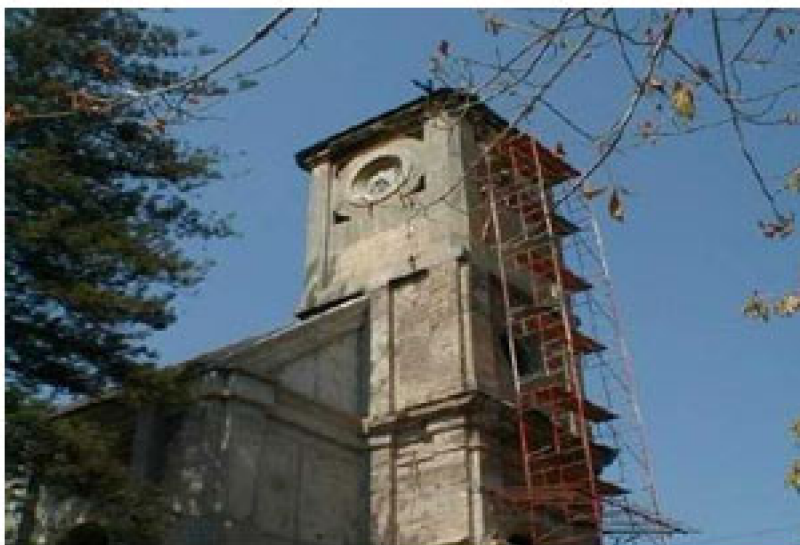
Fig. 1. Torre de la Capilla de San Vicente de Paul

El edificio que alberga la Escuela de Terapia Ocupacional de la Facultad de Medicina de la Universidad de Chile fue, en sus inicios, parte del antiguo Hospital San Vicente de Paul, centro asistencial anterior al Hospital Clínico de la Universidad, del que hoy solo quedan los vestigios de los pabellones y la Capilla, declarada Monumento Histórico en el año 1981.(fig. 1 y 2)