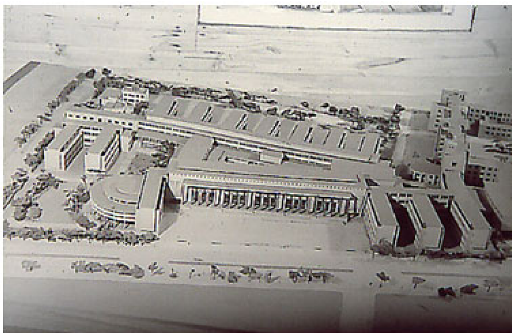
Fig. 5. Maqueta del Edificio de la Facultad de Medicina de la Universidad de Chile, Sede Norte

Escuelas de Pregrado: Enfermería , Fonoaudiología , Kinesiología , Medicina , Nutrición y Dietética , Obstetricia y Puericultura , Tecnología Médica y Terapia Ocupacional .