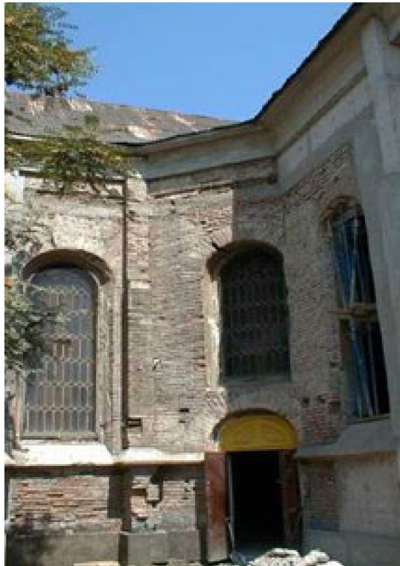
Fig. 2. Capilla de San Vicente de Paul