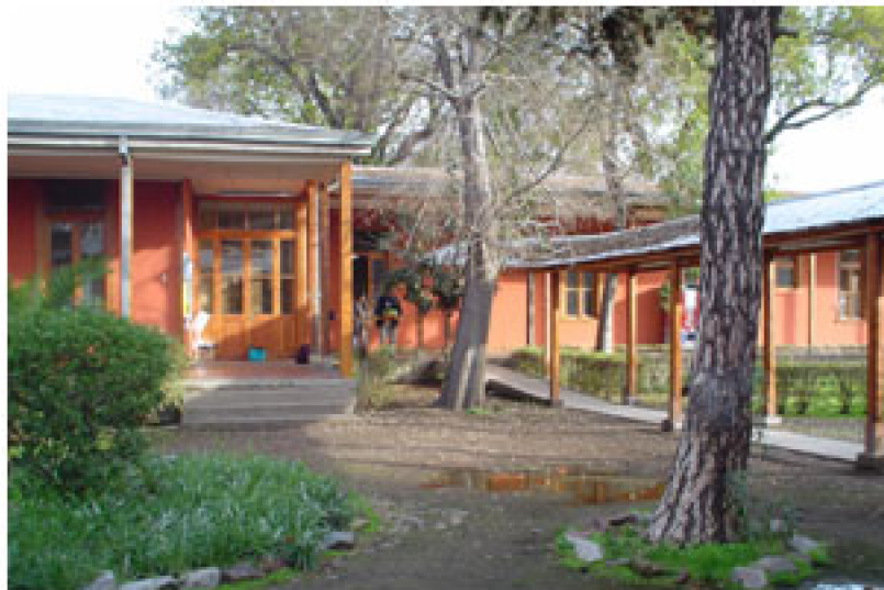
Fig. 3. Vista de la actual Escuela de Terapia Ocupacional