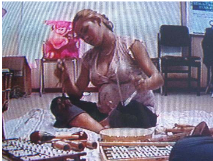
Sesión N° 14 Eje de Exploración del Mundo Sonoro-simbólico “Improvisación musical: Sensaciones que me produjo la recreación sonora de un parto”