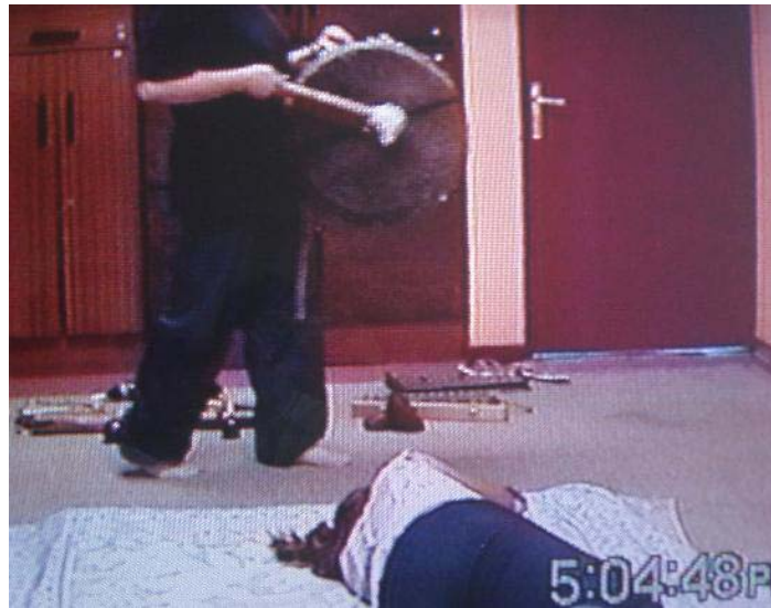
Sesión N° 14 Eje de Exploración del Mundo Sonoro-simbólico “Recreación sonora del momento del parto”