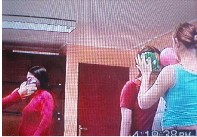
Sesión N° 5. Eje de Exploración Corporal “Este es el tercer acercamiento físico, apoyándose del masaje con globos chicos”