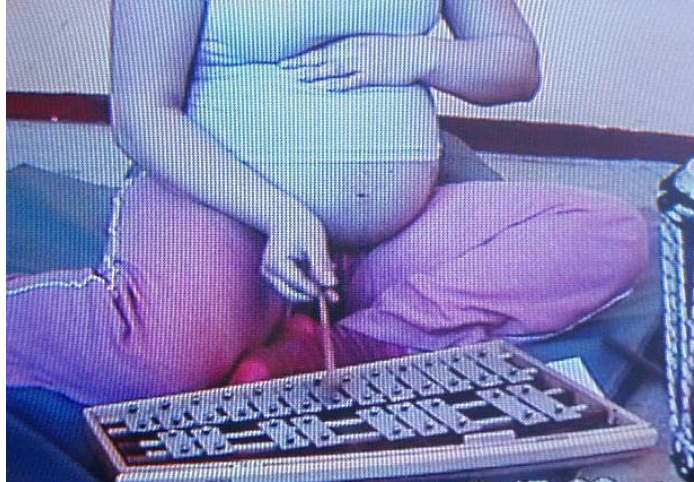
Sesión N° 7 Eje de Exploración del Mundo Sonoro-simbólico ¿Cómo se llamará tu bebé?