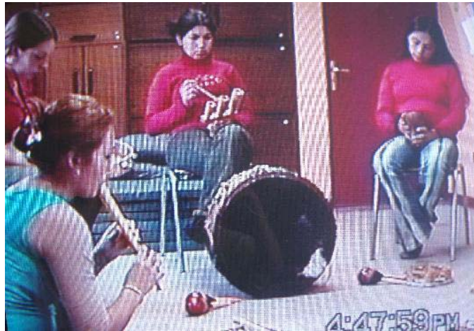
Sesión N° 5. Eje de Exploración del Mundo Sonoro-simbólico “Exploración de instrumentos para interpretar los sentimientos y emociones vividas durante esa semana”