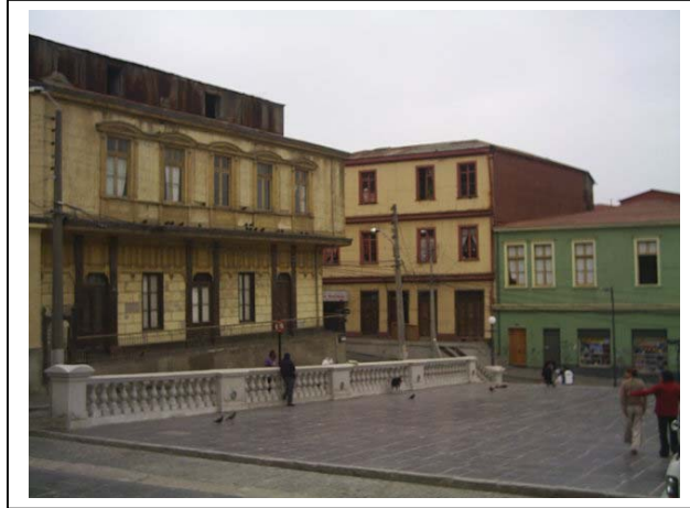
Edificios que encierran la Iglesia La Matriz.