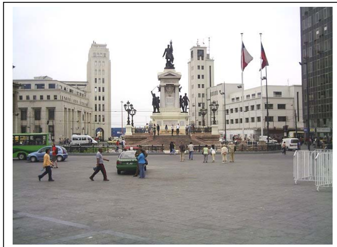
Zona Típica o Pintoresca “Plaza Sotomayor y Edificios que la encierran”.

Declarada Zona Típica en 1979. Los edificios que la rodean son: Estación Puerto, Comandancia General de Bomberos, Primera Zona Naval de la Armada de Chile, Edificio Grace y la Superintendencia de Aduanas.