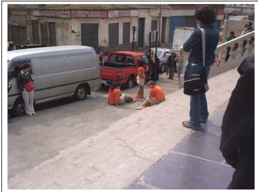
Escena del “Descenso”.

Para realizar este cuadro se eligen momentos que se consideran más representativos dentro del proceso de alcoholización: tranquilidad dentro del grupo al comenzar a beber, la dinámica de las conversaciones donde se distingue la elocuencia de los personajes y el protagonismo que adquieren a medida que aumenta su estado etílico, el creciente letargo corporal, la incongruencia de sus actos producto de su estado y el colapso físico de la intoxicación.