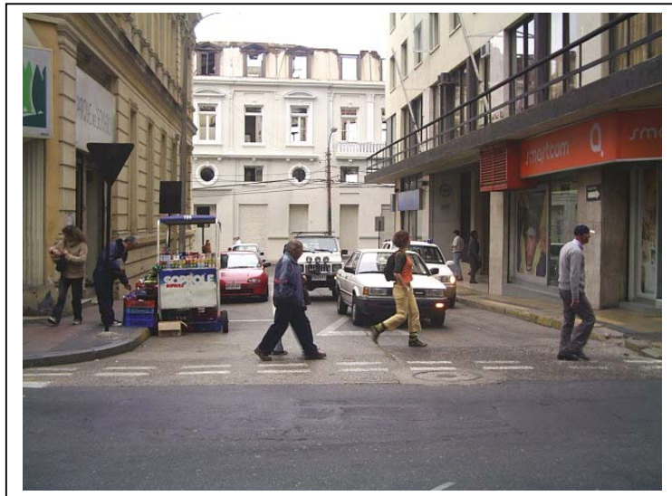
Zona Típica o Pintoresca “Sector Pasaje Ross”.

Es importante destacar que se mantienen casi en su totalidad las construcciones originales, las que tienen alrededor de un siglo de historia.