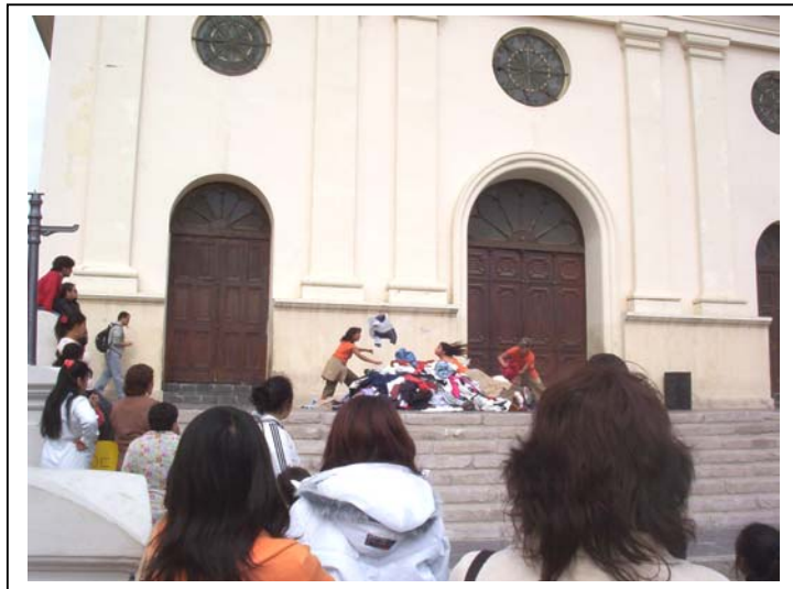
Obra de Danza “Vuelta en 5 tiempos”.

de ser parte sólo del espacio físico, manteniendo la distancia de lo real y lo ficticio o de involucrarse en su totalidad, en el que él es partícipe del significado de la situación que se presenta en la obra. Entonces, el grado de participación será siempre variable.