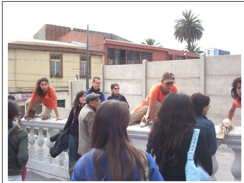
Escena de “Intimidad”.

Se desea llevar a escena con literalidad estos tres modos de actuar dividiéndose en dos partes: la primera frente al público y la segunda interactuando con éste, donde cada personaje se identifica por la tensión, introversión o inestabilidad de la mirada, lenguaje, gestos y dinámica del movimiento.