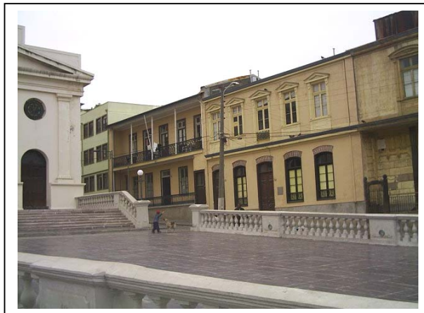
Pendiente del Atrio de la Iglesia La Matriz.

“...La plaza La Matriz se emplaza como una extensión del atrio de la iglesia; es una plaza dura cubierta con piedra pizarra, de forma rectangular levemente irregular, suave pendiente y proporciones acogedoras, a la que accede por una gradería. El lugar es, por expresarlo de alguna forma, introvertido...” 8