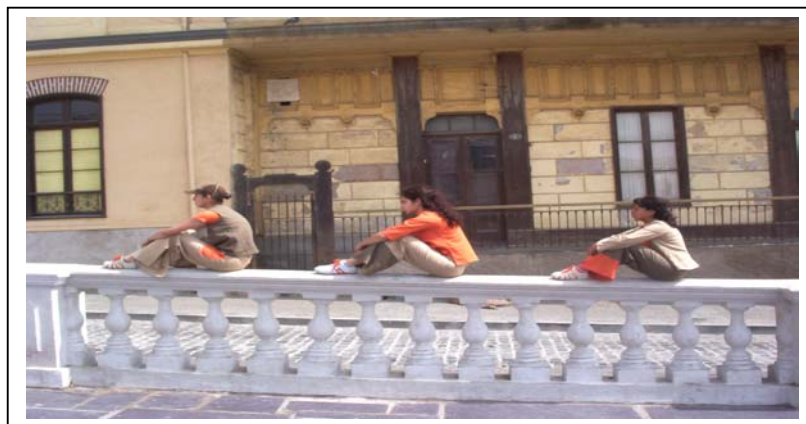
Escena de “La Constante de un Hombre”