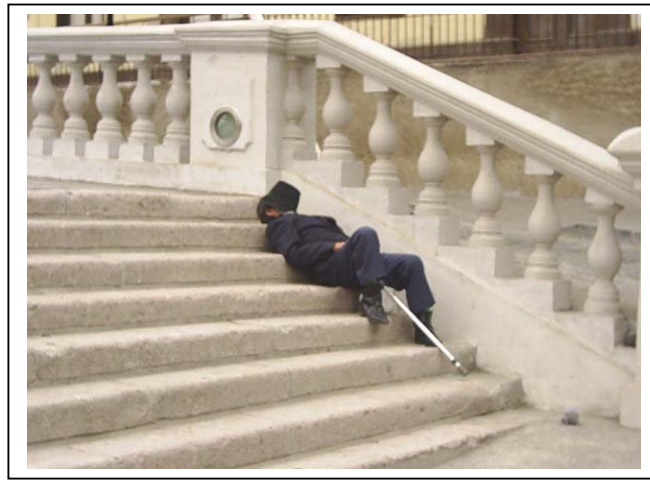
Mendigo del Sector.