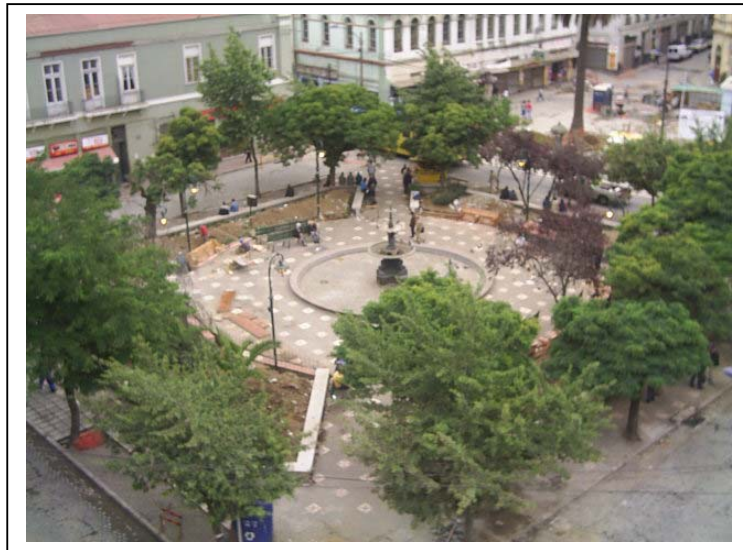
Zona Típica o Pintoresca “Plaza Echaurren”.

La calle más antigua de Valparaíso, denominada en sus orígenes la calle de “La Planchada”, recibe el nombre de calle Serrano en honor a uno de los Héroes del Combate Naval de Iquique. Esta, conecta dos puntos de atracción de la ciudad; Plaza Sotomayor y Echaurren. En ella se alzan edificios de principios del siglo XX, además del ascensor Cordillera y una de las escaleras más largas del Puerto: Escala Cienfuegos.