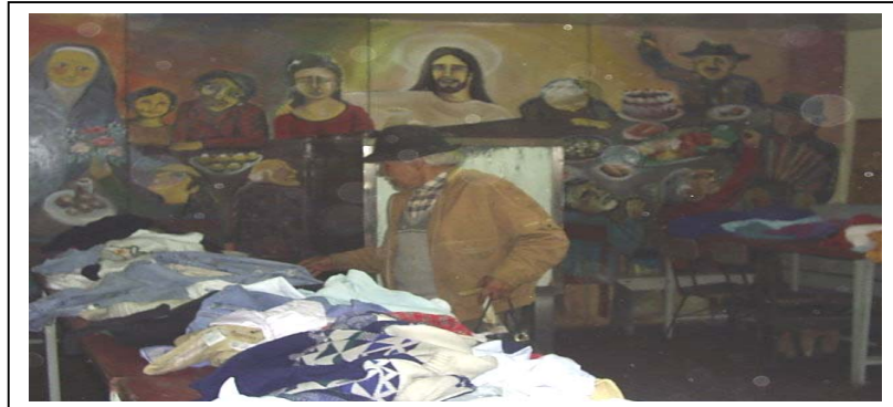
Selección de ropa en el Comedor 421.