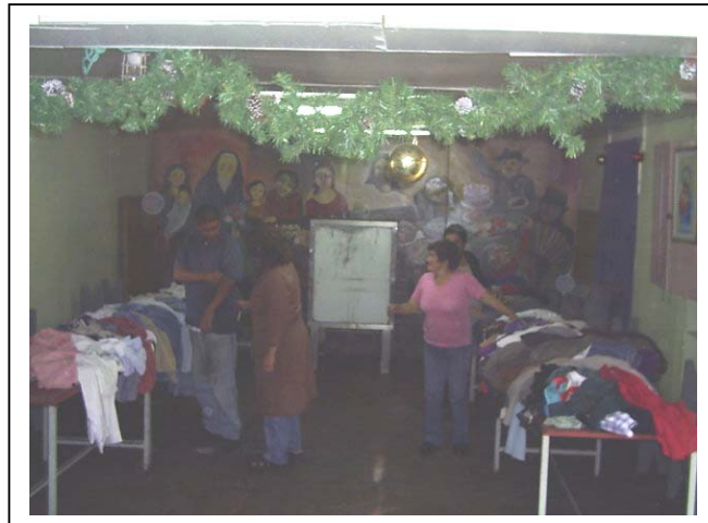
Ayudantes del Comedor