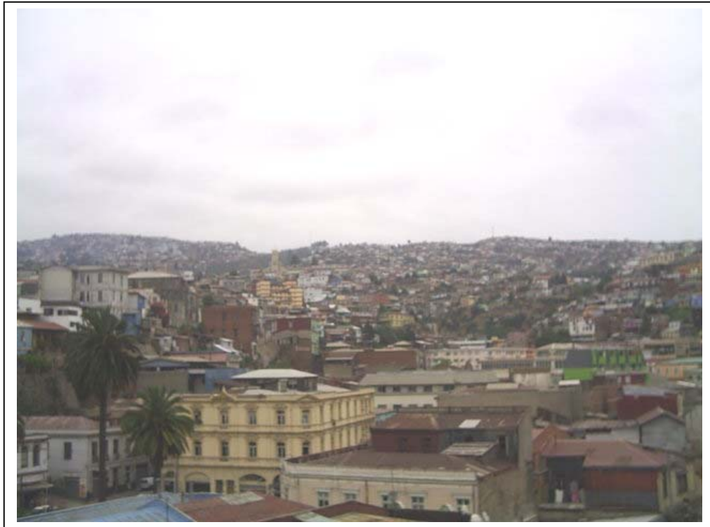
Panorámica de Valparaíso desde el Mercado Central.

Valparaíso se encuentra en su máximo apogeo, producto del movimiento portuario, militar y comercial, lo que permite una importante llegada de extranjeros. Por otro lado, la construcción del Ferrocarril a Santiago crea una activa relación con el resto del país.