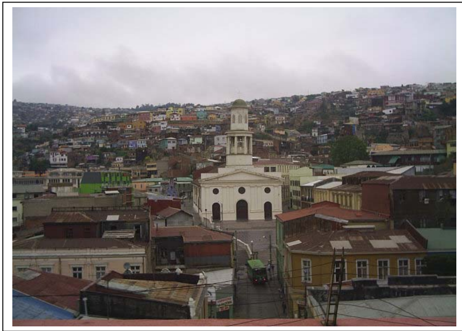
Zona Típica o Pintoresca “Entorno Iglesia La Matriz”.

Valparaíso como Patrimonio de la Humanidad trae consigo una activación cultural que revitaliza a la región. Con el propósito de realizar una obra de danza en la ciudad es que se decide reducir la multiplicidad de sectores que entrega ésta, seleccionando las 10 Zonas Típicas y Pintorescas existentes. Estas, cumplen la función de resumir la historia de Valparaíso y de mostrar su diversidad, reflejada en su gente, lugares y actividades que se realizan.