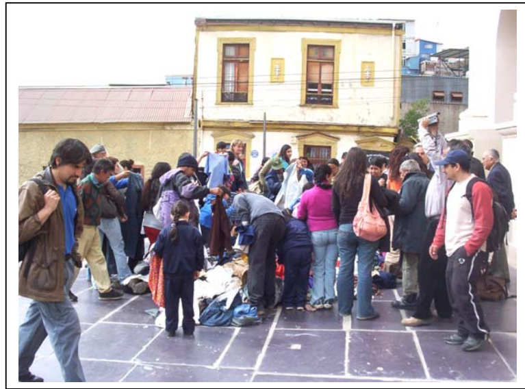
Escena de “La Ropa”.

Lo que se abstrae para este cuadro es el modo de esperar el ingreso al comedor que varía dependiendo de la personalidad o del estado ético en que se encuentren, la forma detallada, pausada y exigente de seleccionar la ropa y los conflictos que se crean producto de quebrantar las reglas en el comedor.