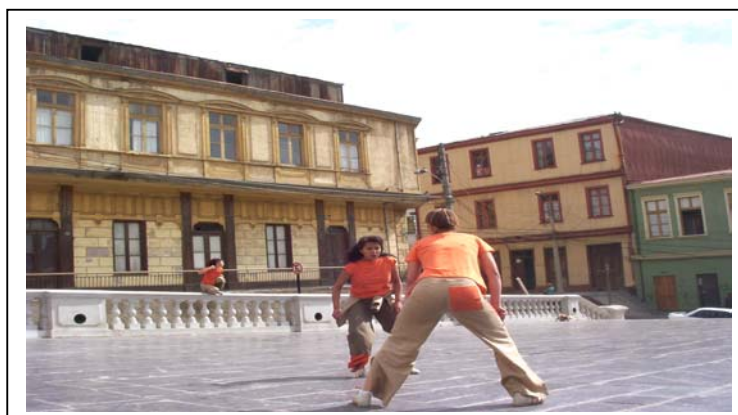
Escena de “La Pichanga”.

“La Pichanga” se basa en las relaciones espaciales entre los jugadores, donde se presentan grandes desplazamientos, encuentros de dos o más jóvenes, la pausa total o parcial del grupo y el desorden que se produce al estar todos detrás de la pelota, todo esto, caracterizado por la actitud agresiva de los integrantes del juego.