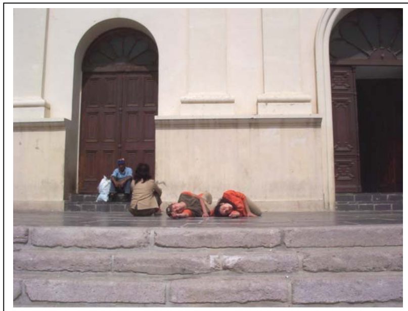
Obra de Danza “Vuelta en 5 tiempos”.

Para abarcar el espacio que ofrece el Entorno Iglesia La Matriz, la obra no se presenta de una forma clásica, frontal al espectador y estática (en un solo lugar), sino más bien, ésta se desplaza dinámicamente utilizando los espacios escogidos. El orden que se da a este desplazamiento es un recorrido de 360°, visto desde el atrio, lo que otorga un movimiento envolvente en torno al espectador. Esta trayectoria, se presenta de forma orgánica y empatiza con la temática de la obra.