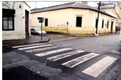
Fig.11.- Lira esquina de Blas cañas, paso peatonal sobre "lomo de toro" resuelto con asfalto sobre los adoquines.