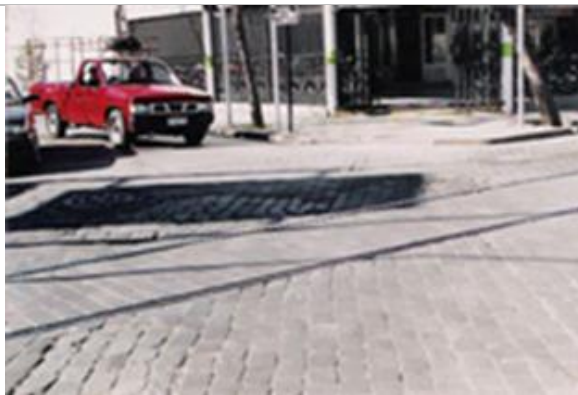
Fig.4.- Detalle de cruce de calzadas.