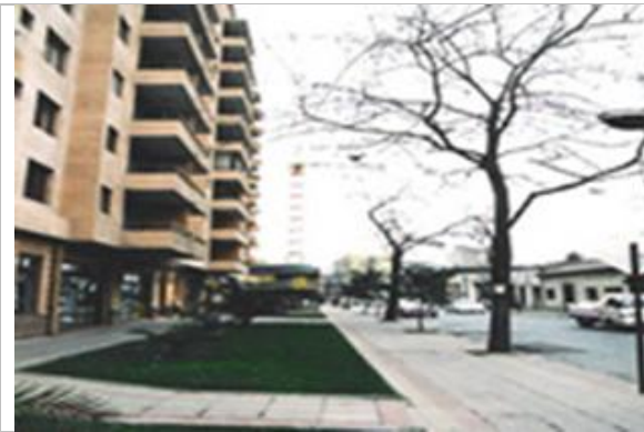
Fig.12.- Acera oriente de calle Lira entre Curicó y Gral. Jofré. Se mantiene la calzada y el ensanche se produce en la acera.