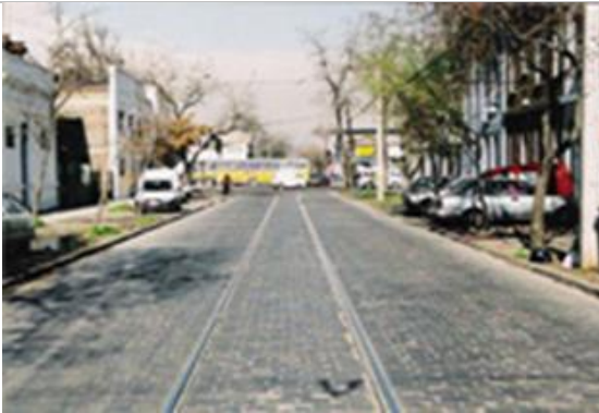
Fig.2.- Calle Lira, vista desde Porvenir hacia Avda. Matta.