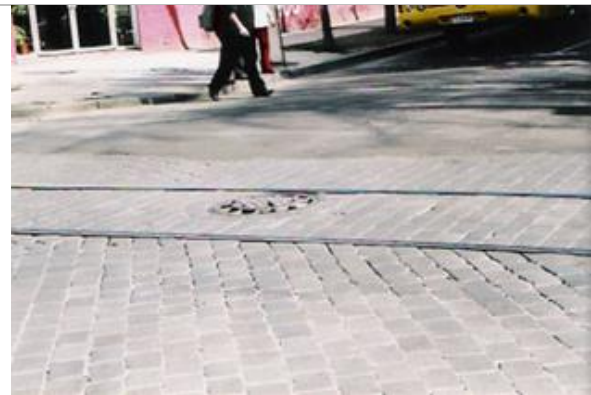
Fig.5.- Cruce de calle Lira con Copiapó.