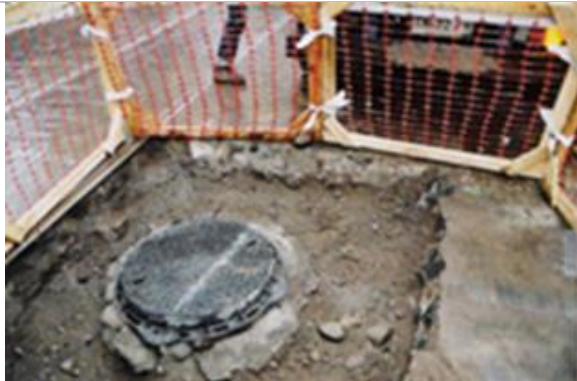
Fig.6.- Trabajos recientes de conexión de alcantarillado donde se puede observar el espesor del adoquín y de la subbase sobre la tierra apisonada.