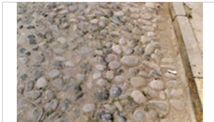
Fig.14. Detalle de calle Ricaurte, con pavimento de canto rodado, y cuneta junto a solera.