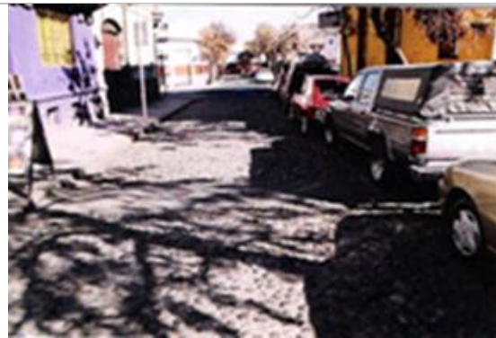
Fig.13.- Calle Ricaurte, con pavimento de canto rodado.