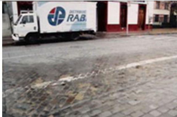
Fig.3.- Adoquinado en cruce de Lira con Blas Cañas.