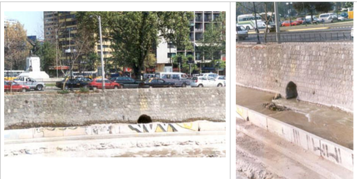
Figs. 15.- y 16.- Imágenes de la bocatoma desde el río Mapocho para la red de alcantarillado de Santiago en el Centenario de la Independencia de Chile, desde el sector de plaza Baquedano, aún hoy en operaciones.