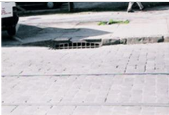
Fig.8.- Sumidero de aguas lluvias en calle Lira esquina de Copiapó.