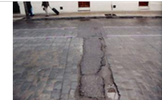
Fig.10.- Calzada a la altura de Lira 44, con intervención contemporánea.