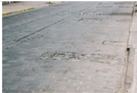
Fig.9.- Calzada de calle Lira entre Marín y Sta. Victoria, donde se observa parches de mala calidad de realización.