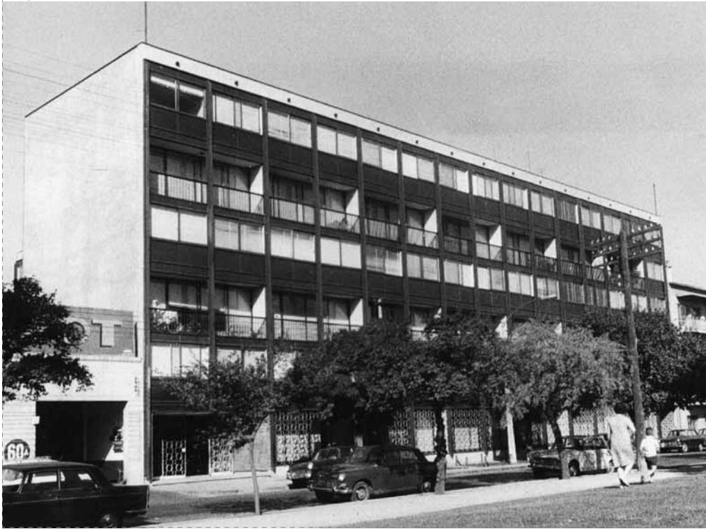
Edificio Habitacional frente al Parque Bustamante (Centro de Documentación de la Arquitectura Chilena, FAU, Universidad de Chile).

suponer que la barrera de contención estaba tan próxima. El fin lo presentían, sin embargo, a fuerza de reconocer que las modas tienen su fecha de vencimiento conforme dejan de ser propuestas innovadoras. Ya a partir de 1960 era dable intuir la decadencia en el inquieto hemisferio norte, a partir de la revalorización de la historia. Publicaciones como Complejidad y Contradicción en Arquitectura , de Robert Venturi (1966) y La Arquitectura de la Ciudad , de Aldo Rossi (1966) 18 dieron el paso definitivo. En otro frente, los movimientos cismáticos propinaron su mirada crítica al pensamiento moderno: Archigram, el Metabolismo Japonés, Team X 19 .