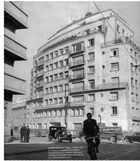
Edificio de viviendas frente al Cerro Santa Lucía

Pero el manifiesto debía traducirse en obras tangibles. Las búsquedas y exploraciones proyectuales continuaban siendo incesantes. Del llamado estilo internacional se reconocen los edificios «blanco estuco»; del período desarrollista, la arquitectura «gris hormigón». Hay quienes preconizaron, por su parte, «la otra modernidad», que recogía las tradiciones preindustriales del país 16 .