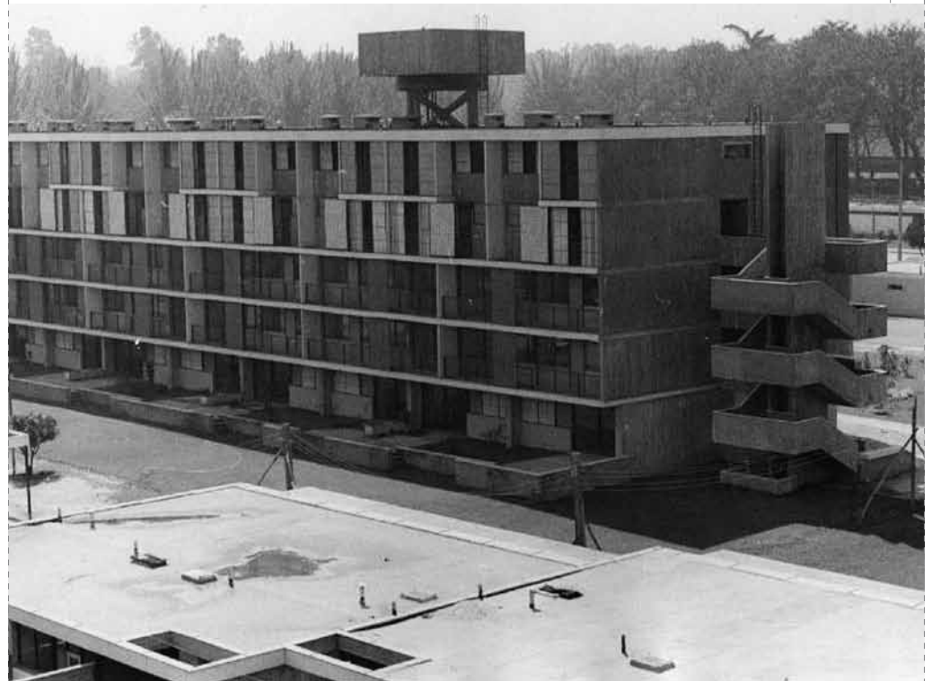
Villa Portales (Centro de Documentación de la Arquitectura Chilena, FAU, Universidad de Chile).

Los efectos de este tifón no han sido del todo explicados. Su historia está aún por escribirse y las obras en proceso de evaluación.