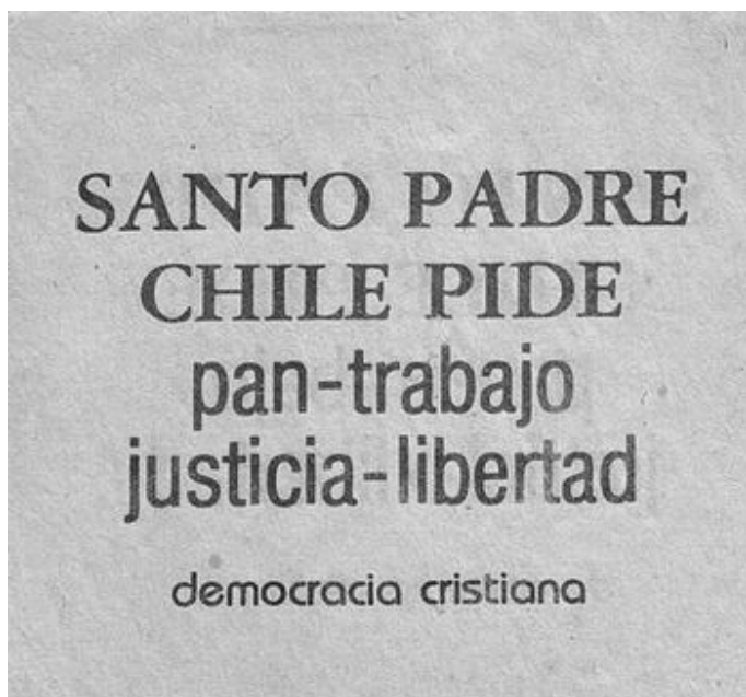
Fig. 5. Panfleto de la Democracia Cristiana con ocasión de la venida del Papa Juan Pablo II 81

Es fácil comprender el disgusto de los entonces huérfanos demócrata cristianos 80 , que le pedían a su líder espiritual algo por lo pronto, mucho menos enigmático: