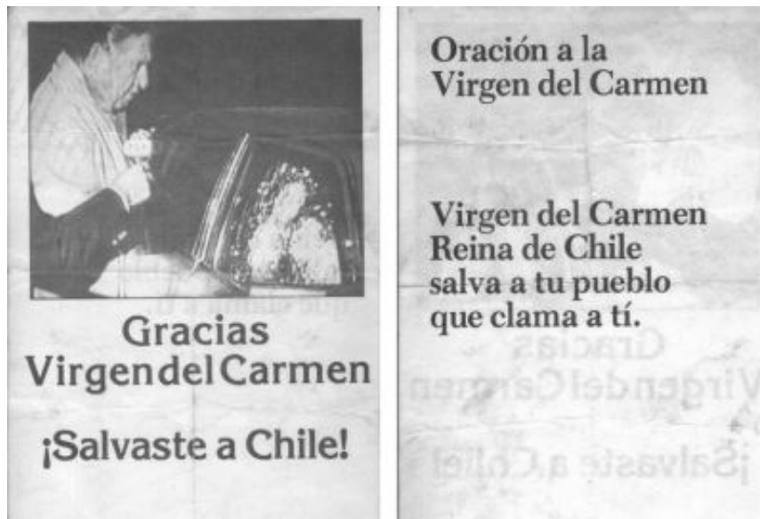
Fig. 4. Oración a la virgen del Carmen con ocasión del atentado a Pinochet 67

Pinochet, herido pero fuerte, aparece junto a periodistas de 60 minutos y radio Cooperativa dando cuenta, horas más tarde, de los daños sufridos por su comitiva. Los muertos y heridos se convirtieron en héroes para los seguidores del dictador, y además, se manifestó la Virgen María en una ventana acribillada. A las pocas horas, comienza la reacción de los órganos del régimen. Se producen una serie de detenciones a lo largo del país; entre los detenidos, Lagos Escobar; entre los muertos, José Carrasco tapia. Entre los sospechosos, José Toribio Merino 66 .