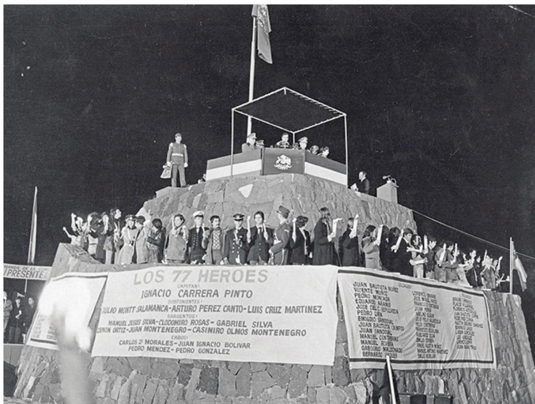
Fig 1. Acto del día de la juventud, 9 de julio de 1977 20