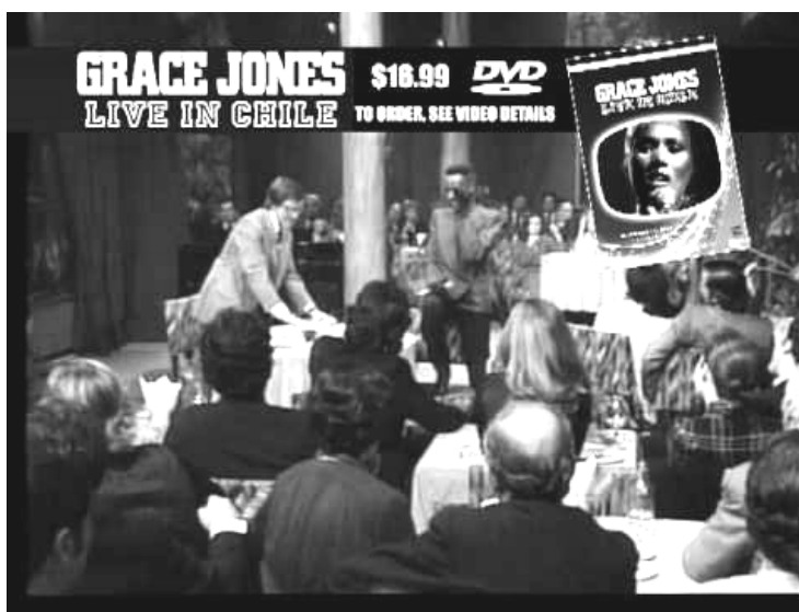
Fig. 2. Grace Jones “Live in Chile” 28

régimen, eran quienes realmente protagonizaban la acción en pantalla, en el público los amos y señores eran los íconos del jet set criollo, entre los que destacaban algunos miembros de los organismos de inteligencia del régimen y sus despistadas señoras.