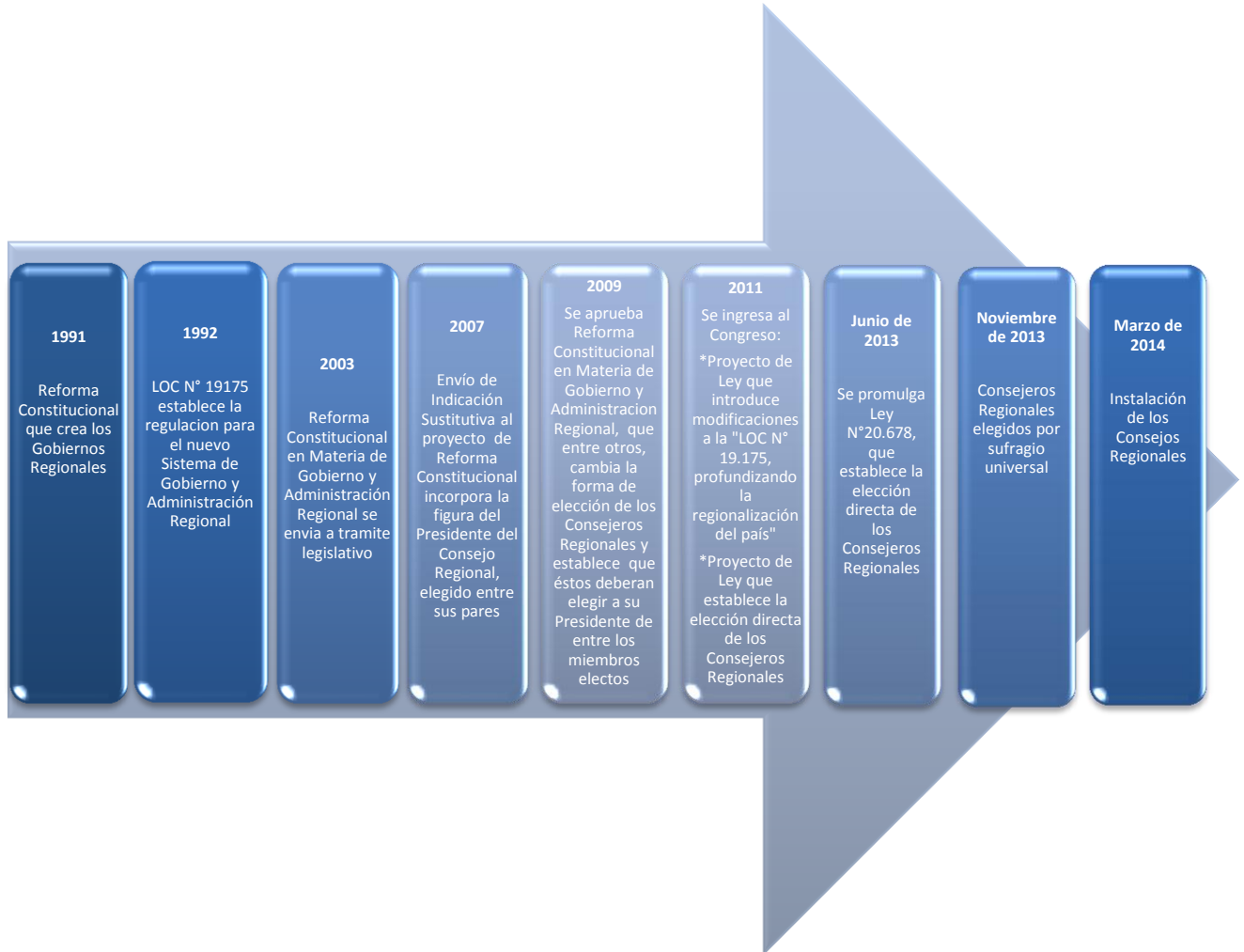
DIAGRAMA 1. Hitos relevantes asociados al contexto