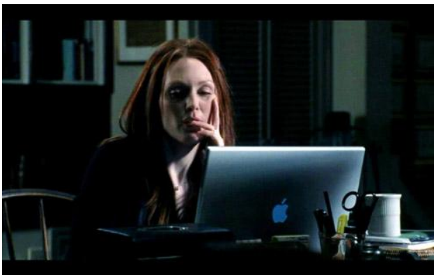
Julianne Moore en "The Forgotten" (Apple, 2004)