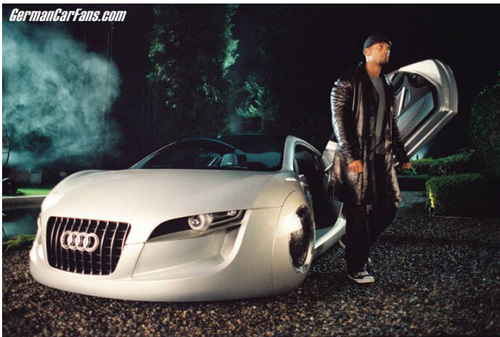
Will Smith en la película "I, Robot" (Audi, 2004)

El product placement tiene sus orígenes radiales en los años treinta y cuarenta y en televisión a comienzos de los cincuenta. Luego de perder notoriedad por algunos años, tuvo un importante resurgimiento durante los sesenta y setenta a causa de diferentes factores, tales como la necesidad de financiamiento por parte de los productores independientes que aparecieron en escena, la realización de películas en locaciones, etc. Pero fue en los ochenta y noventa cuando el placement creció ampliamente y se convirtió en una práctica utilizada por miles de especialistas en marketing. De esta manera, la industria del placement se profesionalizó otorgando importantes dividendos a los productores de piezas televisivas y cinematográficas. Un factor que insidió en su crecimiento corresponde a la caída de las barreras regulatorias internacionales, las cuales han tendido a seguir en descenso con el paso de los años. Además, la masificación del uso del reproductor de video y del control remoto en esta época, fue la alarma que desencadenó la búsqueda de alguna herramienta que contrarrestara, por una parte, la ausencia de exposición de la audiencia a la publicidad (películas en video) y por otra, los efectos del zapping o acción realizada por los telespectadores consistente en saltar de canal o programación debido a la llegada de una tanda comercial.