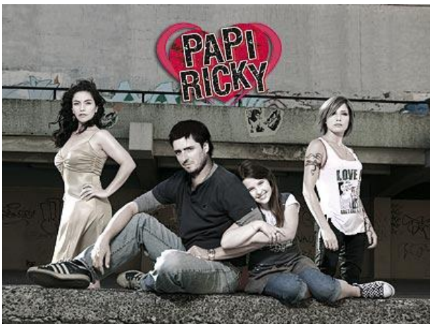
Gráfica de la teleserie "Papi Ricky" emitida por Canal 13 durante el Primer Semestre de 2007.

El género "Sitcom" ha tomado importancia en el último tiempo, llevando a la pantalla el placement de productos que muchas veces son cuestionados por su excesiva notoriedad. Tal es el caso de "Casado con Hijos" (2007) del canal privado Mega. En los reality shows también se hizo popular, especialmente para marcas de gaseosas como las de The Coca-cola Company y de Supermercados, como Líder, Jumbo y Santa Isabel. Entre ellos se pueden mencionar "Protagonistas de la Fama" (2003), "Protagonistas de la Música" (2003), "La Casa" (2006), "Fama" (2007), "Mekano, La Academia" (2002-2007) y "Pelotón" (2007).