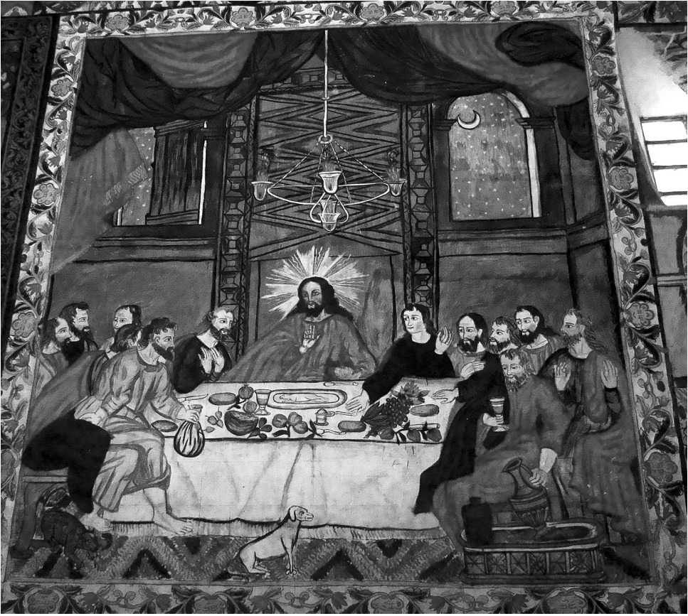
Fig. 6. Última Cena. Pintura en Santiago de Curahuara de Carangas.