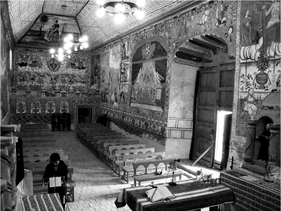
Fig. 1. Interior de la iglesia de Santiago de Curahuara de Carangas.

y espacio exterior, entre espacio sagrado y espacio profano” (Flores/Kuon/Samanez 1993: 38). Observamos que los propósitos didácticos de la imagen evangelizadora dieron cabida a una retórica de la experiencia religiosa, que se fue consolidando con el correr de los siglos y que se materializó en formas locales del cristianismo andino. La flexibilización de los modelos iconográficos durante el siglo XVIII, gracias a la disminución de “los severos controles sobre la producción artística” por las reformas administrativas de Felipe V (1700-1746) (Flores/Kuon/Samanez 1993: 198), junto con la apropiación indígena de los lenguajes pictóricos occidentales, contribuyeron a forjar estas nuevas estéticas. Esta investigación propone que tras los pigmentos murales se puede observar una articulación múltiple de estas imágenes, coexistiendo lecturas disímiles de iconografías, símbolos y composiciones. Se cruzan aquí la catequesis católica con la confección anónima y colectiva de los conjuntos y con su recepción indígena pasada y actual. 2