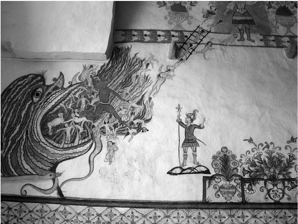
Fig. 2. Leviatán. Pintura en el santuario de Copacabana de Andamarca.

Por otra parte, si bien la salvación está presente en el discurso evangelizador, mucho más profuso es el recordatorio del pecado, la condenación y el infierno en una metodología sustentada por la extirpación de idolatrías. Así es en gran cantidad de pinturas catequéticas como también en los sermones del Tercero catecismo por sermones (1584), documento oficial del III Concilio Limense cuyo uso continuo perduró más allá del período colonial. En varios de sus sermones se hacen breves menciones a la Gloria como el premio eterno para el buen cristiano, pero casi siempre como comentario adicional a extensas reflexiones sobre el pecado y el castigo. Una única asociación, fugaz, se hace entre Paraíso y vegetación en el Tercero catecismo , en el último sermón (XXXI), que trata sobre el Juicio Final. Allí se dice de la Gloria que “Todo es ya eternidad y paz, y amor y gozo y descanso en aquellas moradas eternas, en aquellos prados floridos...”. Esta cita, al ser la única que conocemos de tal índole, es acaso un indicio de la infrecuencia con que aparece el vínculo explícito entre Gloria y paraíso vegetal en la sermonaria virreinal, aunque la misma haya sido utilizada para mostrar su presencia por investigadores como Gisbert (1999) y Bailey (2010).