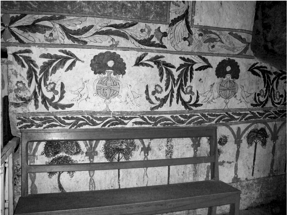
Fig. 4. Pinturas del presbiterio. Belén de Huachacalla.

Sin embargo, en las pinturas murales del altiplano también se observa que la ornamentación fitomórfica contribuye con la organización direccionada de las imágenes en tránsito hacia el altar mayor, complementando la prédica y la arquitectura. El camino se inicia con la vida terrenal exterior; el feligrés luego realiza un viaje dantesco por las postrimerías y su ruta culmina al cruzar el arco toral y arribar a la Gloria (Rúa 2013). De manera ejemplar se aprecia esta direccionalidad en la ornamentación de los frisos del santuario de Copacabana de Andamarca, conformados por