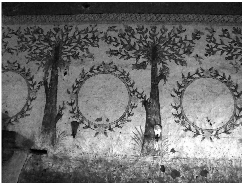
Fig. 8. Pinturas murales de Nuestra Señora de Rosapata de Andamarca.

En los muros de Copacabana de Andamarca podemos ver una relación rítmica entre árboles y floreros (o de árboles y guirnaldas en los de Rosapata de Andamarca; Fig. 8) situando flores y frutos en su espacio natural alternando con los mismos en un espacio doméstico decorativo, extraído de la naturaleza. En las iglesias de Soracachi y Curahuara de Carangas se utiliza una fórmula ornamental que intercala los floreros