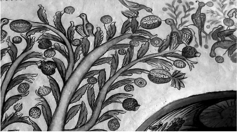
Fig. 7. Detalle de formas frutales en el santuario de Copacabana de Andamarca.

identificado en un friso del santuario de Copacabana de Andamarca por los actuales habitantes del pueblo. Lo reconocen por ser el árbol sin fruto, y aunque el conjunto tiene tres imágenes con esta característica, solo uno es reconocido como tal.