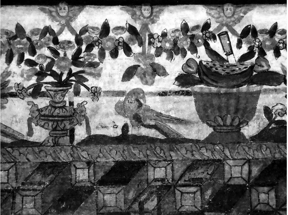
Fig. 10. Detalle de pinturas de Santiago de Curahuara de Carangas.