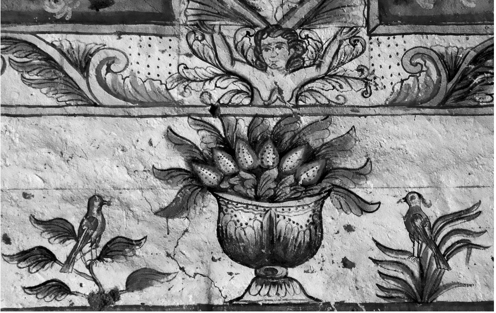
Fig. 9. Detalle de pinturas en San José de Soracachi.