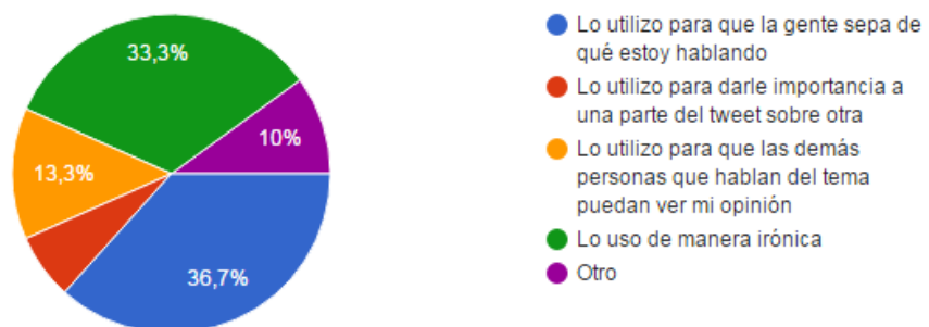
Gráfico 4.2: Usos del hashtag