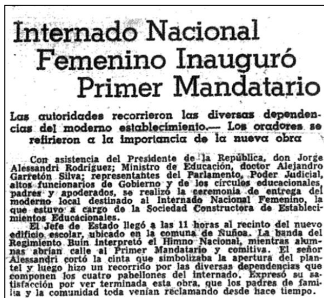
Figura 1: Fragmento El Mercurio, 13 de agosto de 1964, p. 1 y 20.