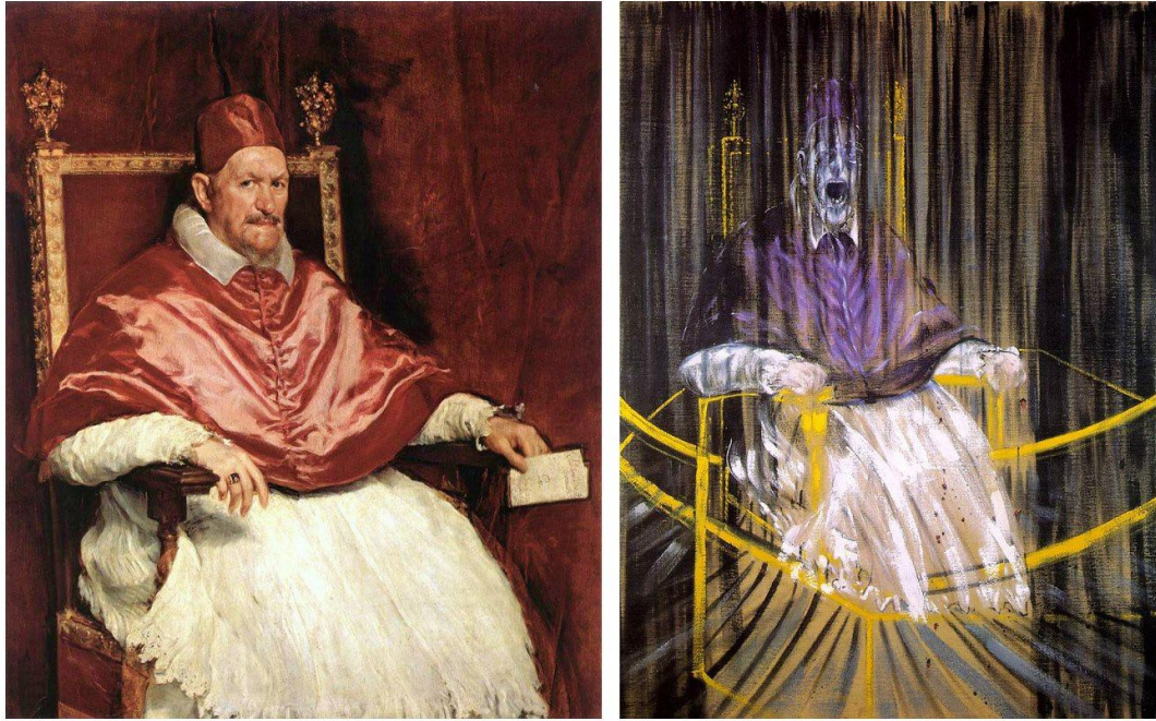
[Diego Velázquez. "Inocencio X". 1650. / Francis Bacon. "Estudio del retrato de Inocencio X de Velázquez". 1949.]

La acción de fracturar puede utilizarse en la praxis artística contemporánea, como una manera de quebrantar las estructuras de otras imágenes, ideas, instituciones, etc.; en donde a través de la articulación de los fragmentos, el artista puede dar cuenta de otro punto de vista dentro del contexto actual. En este escenario, es importante aclarar que el fragmento pasa a ser mas bien el residuo de una estructura, mas que una parte rescatada para mantener un sentido anterior. Por lo tanto, la obra no buscaría reafirmarse dentro de otros conceptos existentes en obras anteriores, sino por el contrario, su intención sería desarmar estas ideas para poder instaurar otras, tal como Francis Bacon lo hace en su pintura del Papa Inocencio X, en la cual retrata al Pontífice en la misma postura que Diego Velázquez lo plasmó. En un contexto local, la cita realizada por Pablo Ferrer del retrato "Napoleón cruzando los Alpes" del pintor francés Jacques-Louis David.