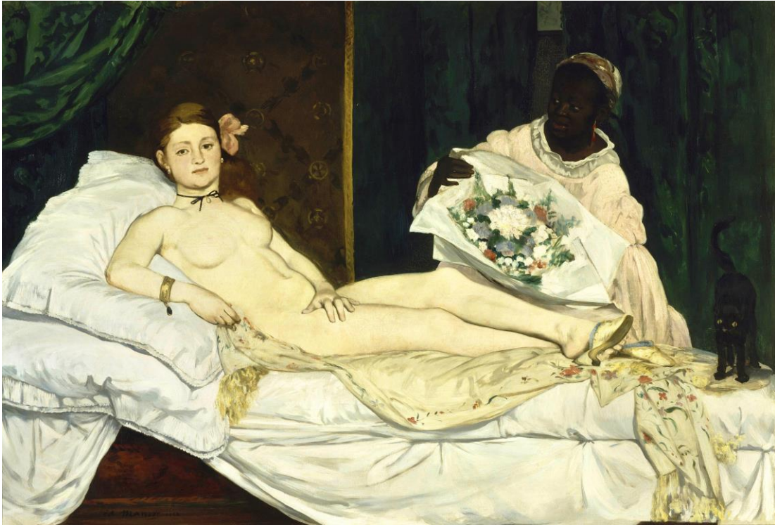
[Olimpia de Édouard Manet .1863]