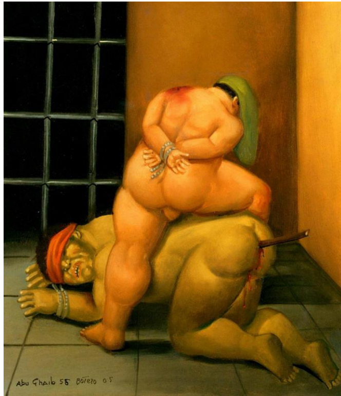
[Fernando Botero. "Abu Ghraib 55". 2005.] Recuperado de: http://www.the-athenaeum.org/art/full.php?ID=42078

Por consiguiente, en el mundo del arte parecerá conveniente aceptar el riesgo del fracaso para poder experimentar y crear, indiferente de si el resultado es negativo o positivo, ya que no lograr el propósito significa que el artista se ha aventurado realizando algo vanguardista para poder expandir el campo artístico. En base a esto, rescato esta cita de Guillermo Machuca realizada en una entrevista referente a su texto "Alas de Plomo. Ensayos sobre arte y violencia", donde se conecta el concepto de fracaso con el de realidad; "(...)el realismo no es copia de lo real, es más, es antinaturalista. Como en Goya o Bacon, el realismo no es mimético, sino aquello que queda cuando ha fracasado lo ideal" 27 En este sentido, el fracaso en el arte se presenta como un concepto que devela la realidad a partir de la ruina o la caída de un modelo ideal, en donde dicho ideal aplicado al arte contemporáneo, correspondería a