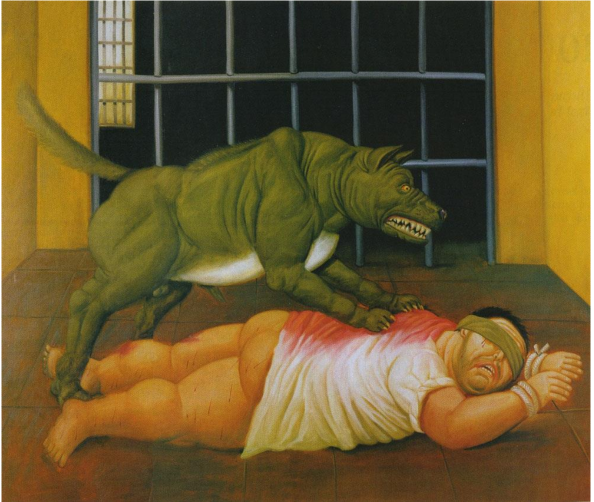
[Fernando Botero. "Abu Ghraib 45". 2005.]