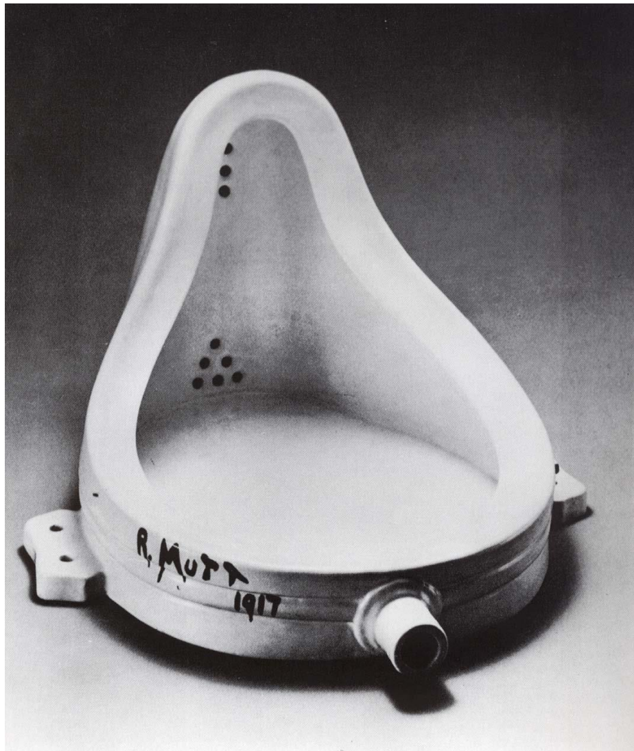
[“La Fuente” Ready Made de Marcel Duchamp].

convertía en una obra de arte de facto. Bautizó este nuevo modo de hacer arte con el nombre de readymade: una escultura que ya estaba hecha de antemano.” 4