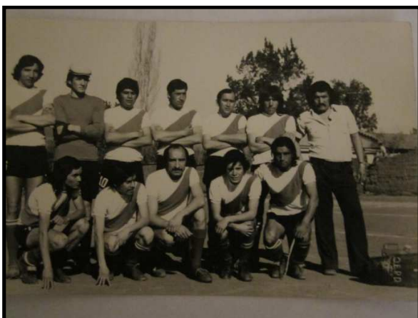
Imagen 2. Plantel 1965.