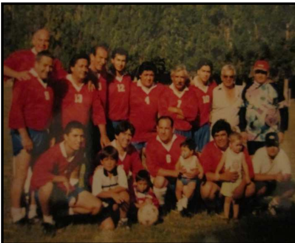
Imagen 11. Partido amistoso a fines de la década de los 90. Se jugó en cancha Curimón contra el elenco de mismo nombre.