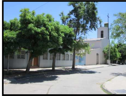
Imágenes 9 y 10. Calle Valentín Pardo de la población Centenario.