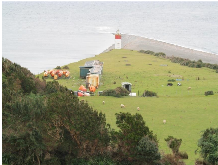
F. N°4: Estructura abandonada. Queullín.

Además, se observan instalaciones abandonadas en distintas localidades que reflejan el uso espacial de la industria en su mayor auge y el poco cuidado que tuvieron con el territorio una vez que el modelo productivo entró en recesión.