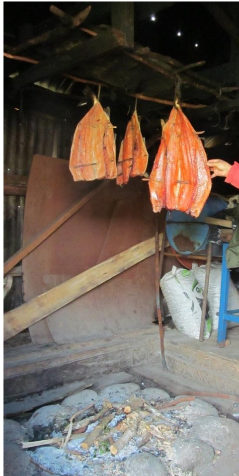
F.N°7: Preparación salmón ahumado