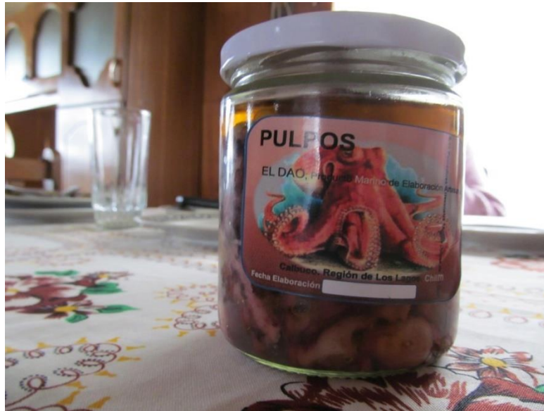
F.N.6: Pulpo en conserva

En el marco de las nuevas prácticas económicas como estrategias productivas, el Estado ha tenido un rol importante en la consolidación de dichas prácticas, sin embargo la descoordinación institucional en el uso de los recursos públicos es algo que ha ocurrido con frecuencia en distintos sindicatos, y da cuenta de la desconexión entre los intereses inmediatos del Estado y la pesca artesanal.