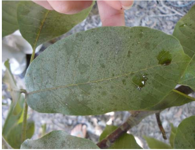
Figura 2. Mielecilla en la cara superior de la hoja, producida por C. juglandicola .