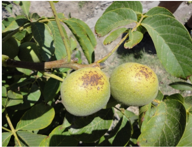
Figura 3. Daño indirecto en el pelón del fruto de nuez por quemadura de sol, a causa de C. juglandicola .

Las hembras son aladas, vivíparas y partenogenéticas (Figura 4), de color amarillo pálido y en otoño, presentan generalmente, uno o dos pares de manchas negras dorsales en el abdomen. El cuerpo mide 2 mm aproximadamente. Tanto adultos como ninfas tienen ojos rojos. Las ninfas son de similar color a las hembras y poseen generalmente hasta 4 pares de manchas abdominales. Los machos alados son igual a las hembras aladas pero con la cabeza y el tórax negros. Las hembras ápteras vivíparas, son muy parecidas a las ninfas de las hembras aladas pero poseen manchas negras en la cabeza, tórax y abdomen. Los huevos elípticos, son de color negro brillante y de 1,14 \times 0,57 mm de tamaño (SAG, 2011).