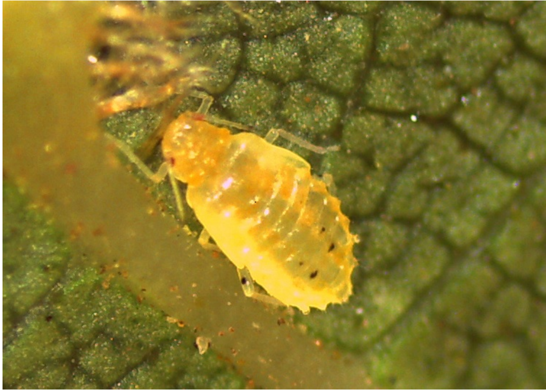
Figura 1. Ninfa de Chromaphis juglandicola .

Según González (2011), esta plaga fue detectada en Chile en la temporada 2008-9 en la región de Valparaíso, y actualmente se ha diseminado hasta la región de O'Higgins. Además, es un insecto que sólo afecta algunas especies del género Juglans , siendo J. regia , J. hindis y J. californica aquellas que han sido reportadas (SAG, 2011).