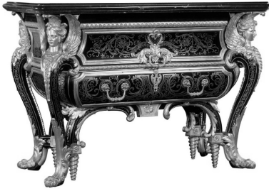
Figura 1. Commode por Boulle, año 1708. N° VMB 14279.2 (“Colecciones de Versalles”). N° 665, en el diario de Garde-Meuble de la Corona. Dispuesto en 1708 en la recámara de Louis XIV en el Gran Trianon (mencionada en 1776, 1787 y 1789). Depósito de la Biblioteca Mazarine del Palacio de Versalles, en 1932. Emplazamiento actual: Corps central, Grands Appartements salon de l'Abondance. Dimensiones: 87 x 130,5 x 65,5 cm. Reproducción sin fines de lucro, en b/n, a partir de foto color. Recuperado el 7.01.2018 de http://collections.chateauversailles.fr

1. (Acanthus). Planta ya utilizada por el griego Calímaco, al crear el capitel de estilo ‘corintio’ (c. 400 a.c.).