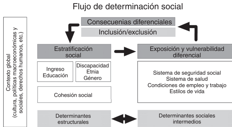
Figura 2. Propuesta de actualización de modelo de determinantes sociales de la salud. Elaboración propia, a partir del esquema de la Comisión de Determinantes Sociales de la Salud, OMS (2005).

Así, proponemos utilizar la relación entre inclusión y exclusión social como resultante de la acción de los DSS. La inclusión social se refiere a las oportunidades que tienen los individuos para participar en áreas clave de la vida económica, social y cultural 1 . A su vez, el término «exclusión social» describe la alienación o la privación de derechos que ciertos individuos o grupos pueden sufrir dentro de la sociedad. A los excluidos socialmente se les atribuye poco valor social; pueden estar marginados económica, política y socialmente, y no pueden disfrutar de las oportunidades económicas y sociales disponibles para otros, incluyendo el disfrute de una buena salud. La exclusión social niega a las personas sus derechos humanos fundamentales.