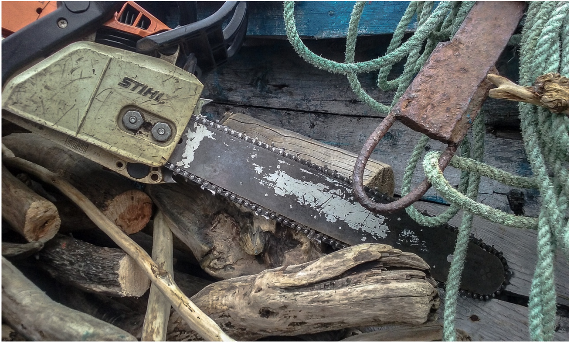
Imagen 17. La envejecida y despintada motosierra, con la cual trozamos la leña obtenida en la jornada, parte de la cual se logra apreciar en la imagen. También se logra ver parte de la oxidada y maltrecha ancla, la cual amarrada a esa desteñida sogas nos permitieron salir de donde quedamos atrapados. Caleta Tortel, enero de 2017

Al día siguiente comenzamos el trabajo de “tirar leña”, que consistía en llevar al hombro los trozos desde el muelle hasta la casa.