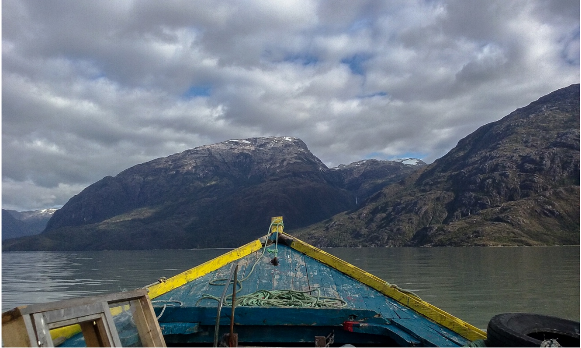
Imagen 18. Vista por detrás de la proa, observando los enormes montes que conformaban nuestro horizonte. En las faldas de uno de estos se encuentra la playa a la que nos dirigimos. Dentro de la embarcación se logra entrever el marco de ventana al costado izquierdo, un neumático que las hace de tope al momento de navegar por lugares rocosos, siendo éste quien recibe los impactos en vez del bote y los varios metros de soga verde desgastada por el uso. Tenía muchas ganas de llegar a la playa y desembarcar, pero al mismo tiempo no quería que acabara el trayecto. Fue un momento anecdótico. Caleta Tortel, enero de 2017