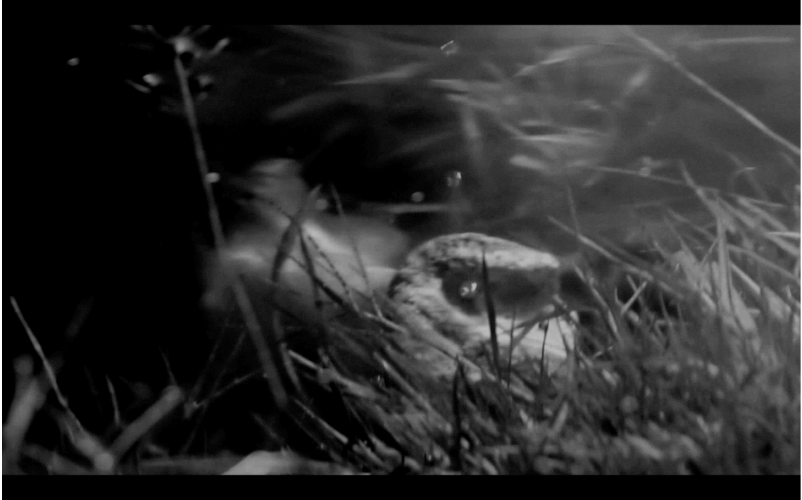
Imagen 7. Momento cúlmine del viaje del hueso, comenzando a descender lentamente, perdiéndose en la oscuridad del fondo del estanque, liberando burbujas de aire por una de sus cavidades, las que emergían hacia la superficie.

Otra escena que pude observar y registrar tuvo lugar en las cercanías del pantano. Al adentrarme en este sector me fijé que flotando en el agua había una bota de goma de color naranja. Me intrigó bastante, ya que por lo que tenía entendido nadie andaba por esos lados, y en caso de que hubiera sido así, el hecho de que hubiera sola una bota en vez del par dejaba muy amplia la interpretación acerca de lo que sucedió ahí, el origen de ese objeto. ¿La habrán dejado intencionalmente?, ¿habrá pasado por lo mismo que las vacas alguna persona en ese lugar? No tuve respuesta a esas preguntas, y mejor que se haya dado así, quedando todo como un misterio.