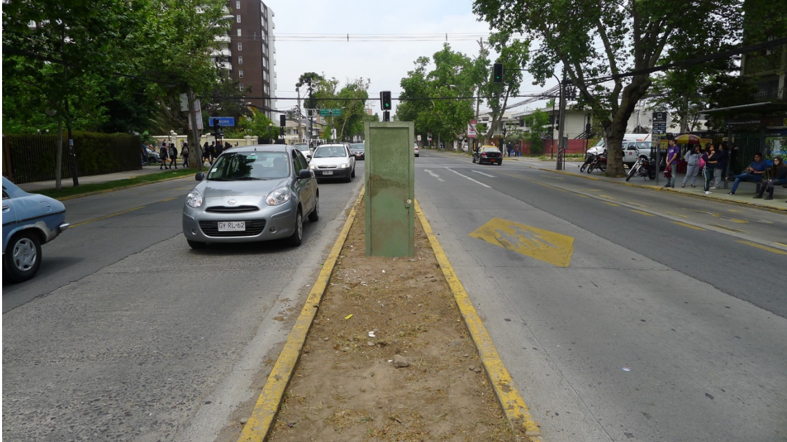
Imagen 25. Pablo Vallejos: No Lugar. Instalación, 2015. Ñuñoa.

“El ejercicio busca dar la excusa para, a partir de los conceptos tratados, generar (o no generar) una instalación, acción, o performance dentro de un radio cercano a la Universidad, posterior a un recorrido del lugar y un análisis del propio sujeto. La elección de ese lugar fuera de la Universidad nace tras la idea de auto impuesta de no generar nada dentro de los espacios comunes (Facultad), dando más relevancia al espacio público, dado que el tipo de lectura que se le daría a la instalación sería menos pretencioso (por parte de los espectadores). En esta instalación el proceso es acotado por el corto tiempo, lo que llevó a que “lo anecdótico” primara en lo procesual. Eso se concreta en la elección de los objetos, los cuales había recolectado en distintos periodos (un año y el otro un par de semanas) con la idea de que en algún momento serían claves en el desarrollo de una obra u ejercicio.