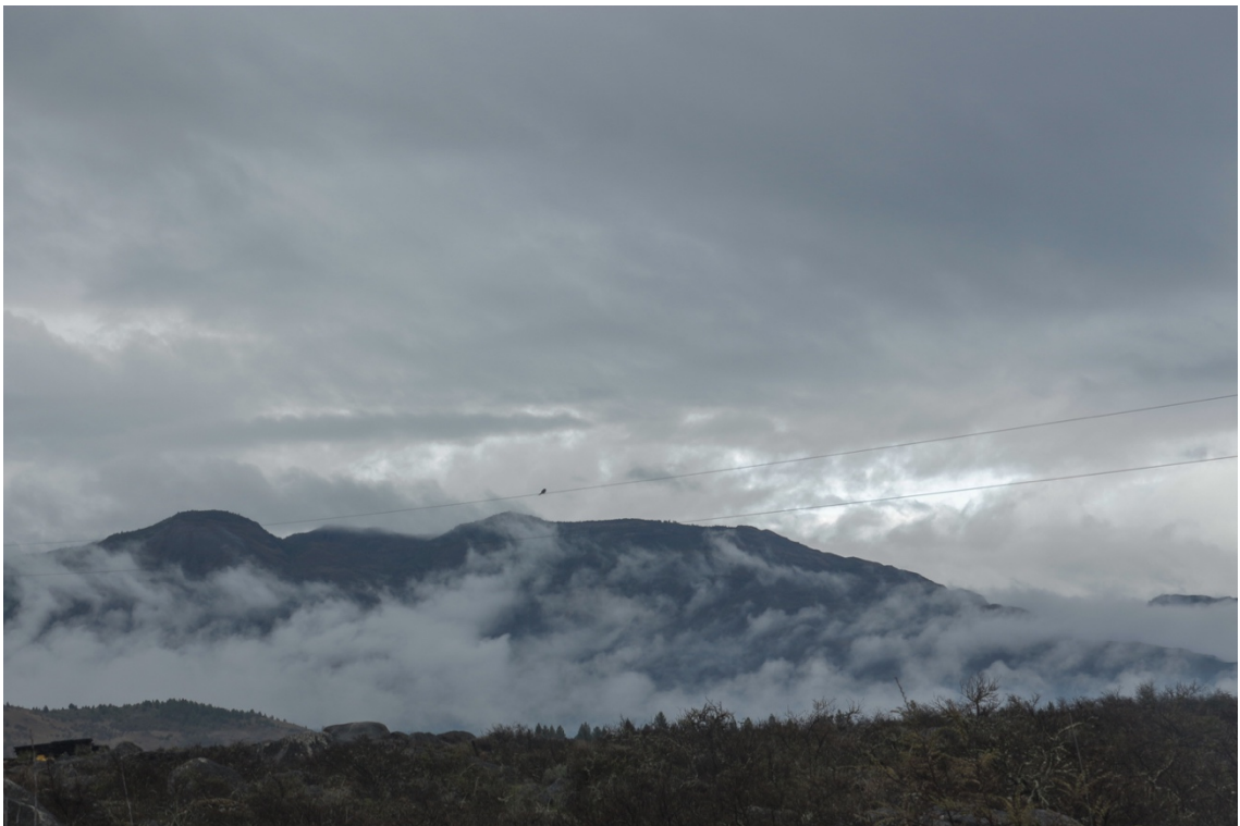
Imagen 9. Al observar por las mañanas notaba que la neblina se fundía con las nubes, dando la sensación de que estas nacían desde la tierra. Un velo incorpóreo que se apropiaba de todo a su alrededor y que a pesar de su etérea consistencia era más pregnante que el campo más extenso o el monte más alto. Cochrane, primavera de 2016.

agua cristalina que dejaba a la vista el colorido fondo habitado por sedosas plantas y escurridizos peces. Las mañanas eran muy frías, de grados bajo cero por lo que había que levantarse directo a picar leña para poder hacer un buen fuego para calentar la casa. El río amanecía con una especie de neblina que flotaba sobre este de manera estática y que muy tenuemente se iba esfumando a medida que los rayos de sol comenzaban a iluminar y calentar. Lo mismo pasaba entre los cerros, donde parecía que las nubes nacían desde el suelo y de a poco subían hasta el cielo. Todo amanecía cubierto por un velo blanco, como imágenes sacadas de un sueño.