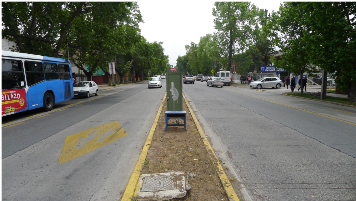
Imagen 26. Pablo Vallejos: No Lugar. Instalación, 2015. Ñuñoa.

inmerso en medio de esta. Estas características llevaron a pensar en esos objetos en particular. La materialidad de estos evidencian su uso, el paso del tiempo y cómo estos dos factores determinaron su obsolescencia. La pintura descascarada juega con el contexto; el verde de la puerta con los árboles y vegetación del lugar (lo orgánico), el celeste del pupitre con las micros que pasan por esa calle. La puerta y el banquillo se ubican de frente, dialogando el uno con el otro, y estos con el lugar. En medio de ellos se armó un monolito con piedras del lugar, generando la anécdota entre estos, haciéndolos dialogar entre sí, activando este espacio.”