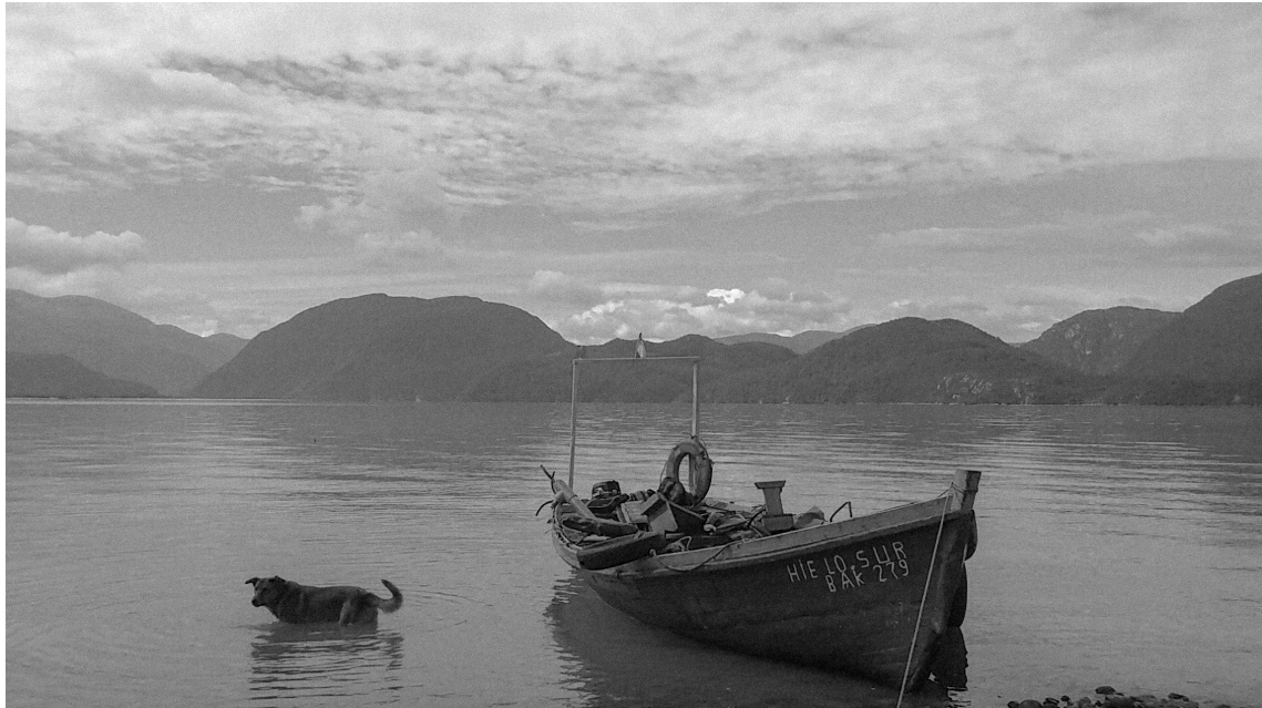
Imagen. 32. Pablo Vallejos: Fotografía de la embarcación Hielo Sur Bak 279, Playa San Martin, Tortel 2017

En ese instante se presentó frente a mí la imagen perfecta. El Rambo dentro del mar, en estado de vigilia aguardando por su amo y rodeado por el dibujo de las ondas en el agua que revelan el movimiento de esta. A su lado se encuentra el bote, cargado de elementos en su interior. Una analogía a la vida, colmada de situaciones, emociones y vivencias las cuales conviven todas juntas a pesar de sus diferencias. La embarcación aguarda serenamente, al igual que el perro. Se logra percibir en el ambiente la espera, la cual podría ser infinita. Una espera paciente y apacible. El horizonte está saturado por montes, uno tras otro y el cielo no se queda atrás, con densas nubes en el fondo, las cuales se van esfumando a medida que se acercan a la escena.