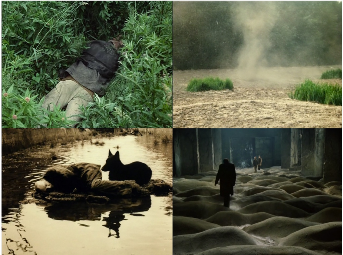
Imagen 31. Andrei Tarkovsky: Stalker, 161 min, 1979.

Esta visión del mundo y del arte perfilaron mi imaginario y lenguaje aún más, definiendo mis reales intereses y motivaciones a la hora de hacer arte, de observar y reflexionar. Los cuestionamientos y planteamientos del autor fueron claves durante mi estadía en el sur y sobre todo al momento de comenzar a materializar mis vivencias en la obra que presentaré junto a esta memoria. Porque fue mi búsqueda; lograr traducir por medio del arte todas las experiencias que viví estando fuera de casa, las texturas, los ritmos y tiempos, pero por sobre todo, el trasfondo psíquico y emocional de ese lugar, de su gente y del entorno.