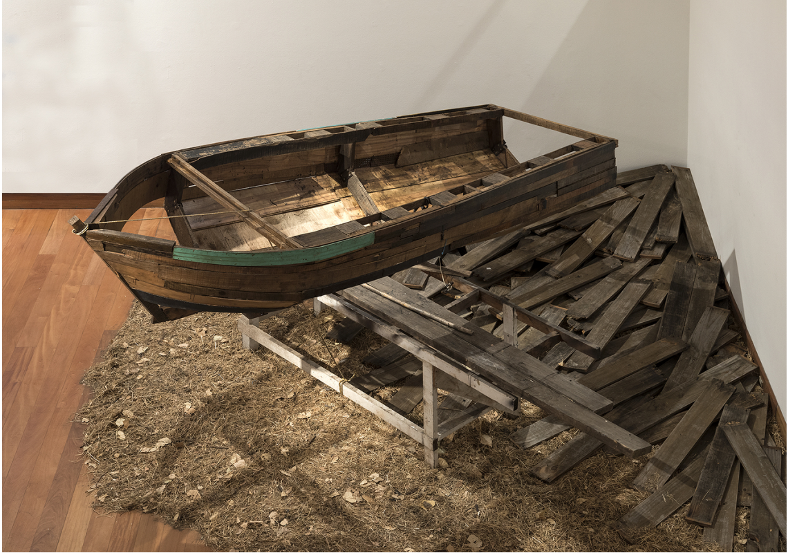
Imagen. 44. Montaje Hielo Sur Bak279, Museo de Artes Visuales, MAVI 2018.