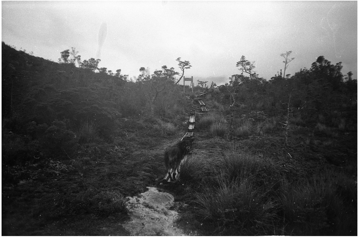
Imagen 12. En muchas ocasiones la mejor compañía que un hombre puede tener es la de un perro, y más aún cuando este adopta un carácter de guía y protector. Las tablas que se divisan al centro son las del sendero, y frente a este, mirándome fijamente se encuentra mi compañero. Su semblante y mirada reflejaban tal seguridad que sin él no hubiera sido lo mismo. Caleta Tortel, enero de 2017.

Me levanté temprano al otro día y bajé a desayunar. Ya que era el único huésped en la residencial me senté solo, mirando por la ventana en dirección al mar. Me percaté de un hombre que cargaba cosas a un bote amarrado al muelle. Entraba a buscar cosas y salía. Chalecos salvavidas, botas de agua y una motosierra. Le pregunté a la dueña del hostel sobre aquella escena, respondiéndome que era su marido quien estaba cargando cosas para irse al campo un par de días a trabajar. En ese momento sentí que su respuesta fue una oportunidad de aprendizaje y experiencia que no podía dejar escapar.