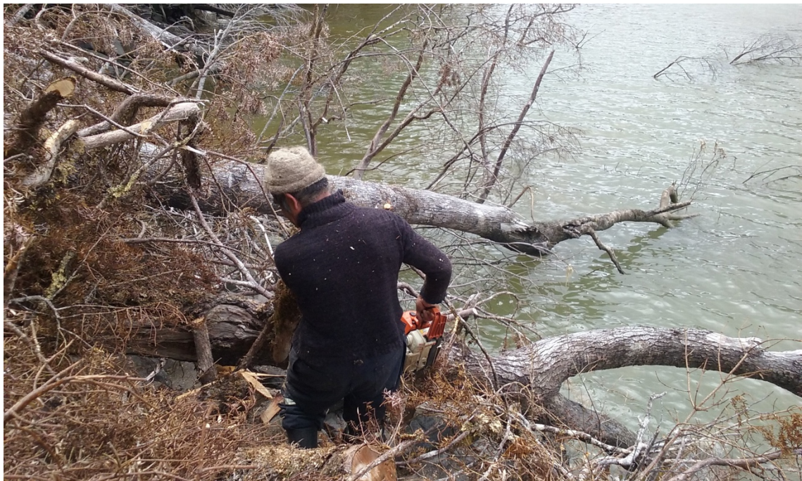
Imagen 16. Divisamos un sector con buena leña. Eran árboles que habían caído, lo que simplificaba el trabajo, teniendo que cortar en vez de derribar. Acercamos el bote, lo amarramos y saltamos hacia el monte. Había que hacerse camino entre troncos que cruzaban sobre el agua a gran altura, prestando atención a los que estaban débiles para evitar pisarlos y caer al agua. En la imagen se aprecia la cantidad de ramas que sobresalen en el agua, lo que dificultaba el paso y acercamiento con el bote. Caleta Tortel, enero de 2017