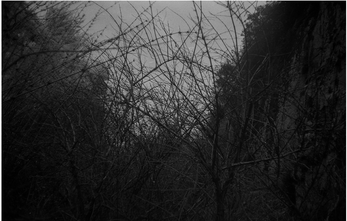
Imagen 1. Entramado de ramas y quilas por un costado del sendero que rodea la casa. Adentrarse era muy complicado, dando la sensación de que lo impenetrable de ese lugar se debía a que contenía algo importante en su interior, con ramas a modo de barrera natural, para que nadie se aventurara a entrar. Seis Lagunas, Coyhaique. Primavera de 2016.

Recorrer el campo fue un hábito diario, algunas veces solo en las mañanas y otras durante todo el día. Un factor predominante en esto era el clima. Cuando notaba que se venía una lluvia muy fuerte tenía que emprender el rumbo a casa, lo mismo que con la luz del día. Cuando ya estaba bien entrada la tarde tenía que saber regresar antes que oscureciera por completo. Durante estos caminares tuve algunos encuentros bastante peculiares y anecdóticos, con una alta cuota de enigma. Escenas y situaciones que estaban allí, esperando ser descubiertas, pero que dejarían más preguntas que respuestas.