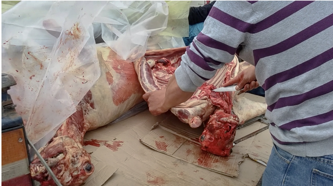
Imagen 13. Medio costillar y una paleta fue mi encargo al enterarse que los hermanos del lago Vargas habían llegado con un par de bichos a la rotonda. Subí con un saco en busca de la camioneta azul. Los encontré, les dije el corte que necesitaba y uno de ellos destapó el nylon, dejando a la vista los corderos recién carneados. El hombre sacó su cuchillo y comenzó a cortar. Al terminar le abrió un tajo entre las costillas, lo colgó en la pesa, lo metió en el saco y partí devuelta con el encargo al hombro. Caleta Tortel, enero del 2017

Pasaban los días y la situación no mejoraba. Mis compañeros estaban cada vez más sobrecargados de trabajo y enclaustrados en la residencial. Pasaban horas en las que no entraba ningún turista y no había mucho que hacer, pero de igual manera, la dueña del hostel no permitía que salieran a distraerse por el pueblo. Estar en un lugar tan hermoso, pero sin la posibilidad de dejarse cautivar por él era paradójicamente agobiante. La ventana que daba del comedor hacia el muelle se convirtió en casi la única forma de apreciar el paisaje, de observar el pueblo y eso era muy triste. Se intentó varias veces solucionar el problema con la dueña, pero solo nos encontramos con negativas. Por experiencia, había aprendido que la gente del sur, sobre todo de lugares aislados, era muy llevada a sus ideas, pero siempre con buen trato y disposición se podía llegar a acuerdos. Este, lamentablemente, no era el caso. El panorama empeoró, quedando sólo dos compañeros del grupo inicial. Sabía que la carga iba a ser mayor, pero ya había llegado hasta ese lugar, con muchas expectativas y no iba a dar marcha atrás, pasara lo que pasara.