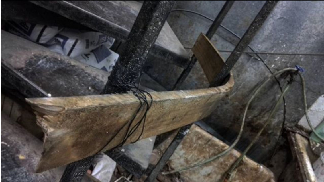
Imagen. 33. Prueba de curvado de madera. Humedecí la tabla y al adquirir flexibilidad la curvé a la fuerza entre los fierros de una escala, amarrándola con alambre para que no perdiera la forma. 2017

Empecé curvando tablas, las cuales sumergí en agua durante varios días para poder doblarlas a la fuerza, quebrándose varias de estas en el proceso.