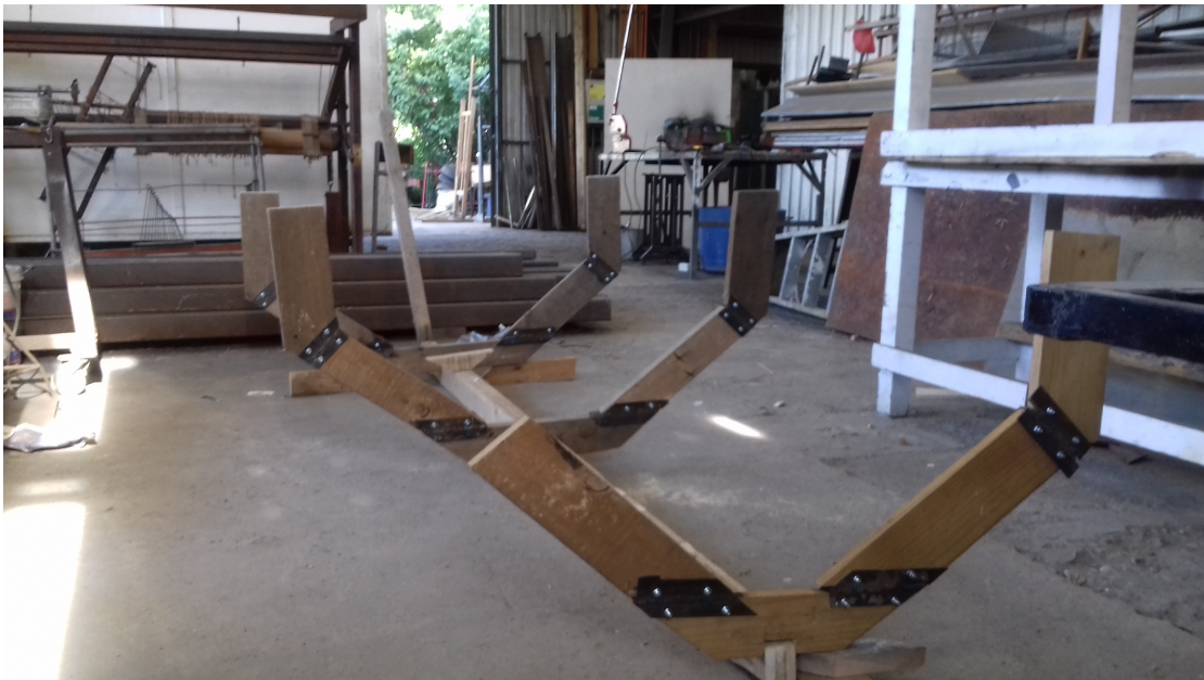
Imagen. 37. Esqueleto terminado con las tres cuadernas fijadas a la quilla.

Tras finalizar esta etapa venía el trabajo del entablado, el cual comenzaría a darle identidad al bote. El espacio en el taller me quedó chico, por lo que tuve que buscar otro sitio. El lugar donde comencé me había quedado pequeño al comienzo de la faena, ahora este espacio me presentaba el mismo problema quedándome como única alternativa trabajar en el patio. Encontré un mesón largo donde el bote calzaba a la medida y me instalé afuera.