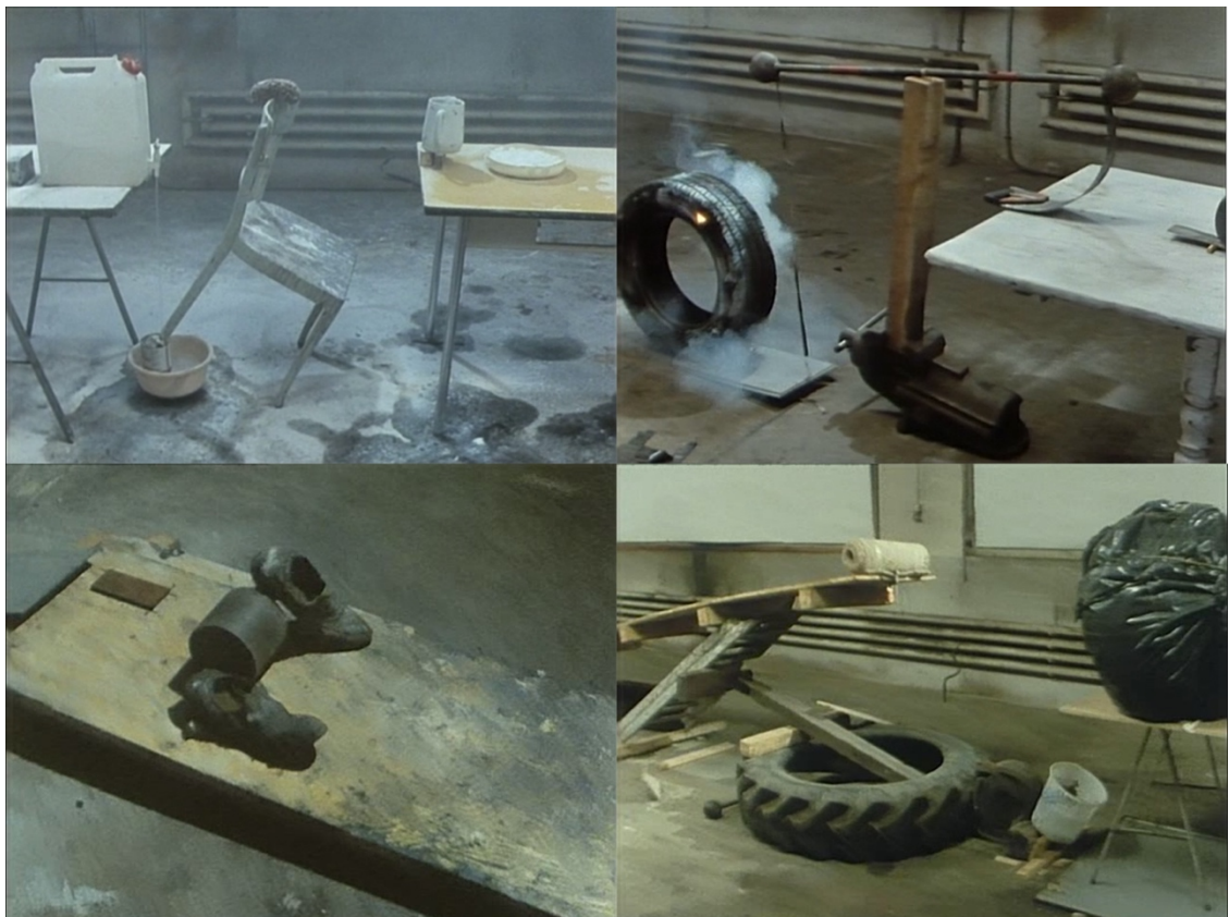
Imagen 30. Fischli & Weiss: Der Lauf Der Dinge, 29:40 min. 1987.

El trabajo más completo a mi parecer es el video “Der lauf der dinge” o “The way thing go”, donde una serie de elementos de todo tipo van interactuando entre si, jugando con la física, con la tensión, con mucha pirotecnia y distintos ritmos. Una larga secuencia de reacciones en cadena que mantienen al espectador intrigado por lo que pasará, acciones cargadas de absurdo y sin sentido.