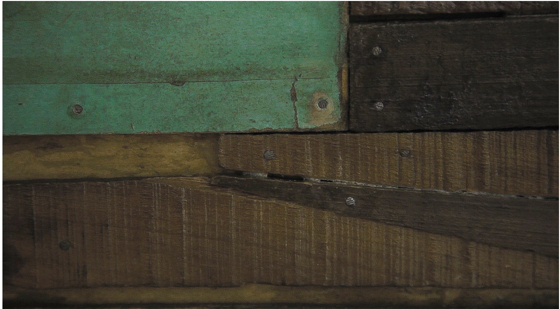
Imagen. 39. Cholguán y tablas de distintos tamaños formando la trama del entablado. Encajadas unas con otras como si de un tejido se tratase. 2018.