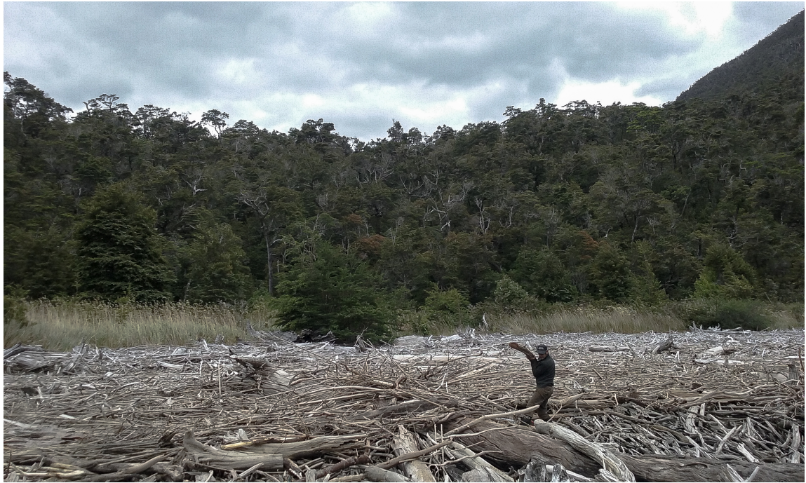
Imagen. 42. Playa de leña. Caleta Tortel, enero de 2017.

Junto con los elementos que nombré anteriormente, frente la instalación se proyecta un video a pantalla completa del bote en que salíamos a buscar leña acercándose a un monte. Fue un registro al cual le hice un tratamiento de color, tiempo y sonido. El video original está a color, pero la proyección aparece en blanco y negro, porque tenía que acentuar el hecho de que no lo presentaba en la escena como registro sino como un recuerdo (concepto clave dentro del desarrollo de la obra), un recuerdo desde donde contextualizaba la construcción del bote, una pista de donde había nacido la idea de la embarcación y el navegar. En cuanto al tiempo, este fue ralentizado, generando una imagen contemplativa del desplazamiento del bote en el mar. El movimiento del agua se percibe suavemente, como seda y el vaivén del bote genera una sensación de ingravidez, un intermedio entre el flotar en el agua y flotar en el aire. Además de esto, el video es un loop, el bote jamás llega a su lugar de destino, sino que se mantiene eternamente avanzando y meciéndose por las aguas.