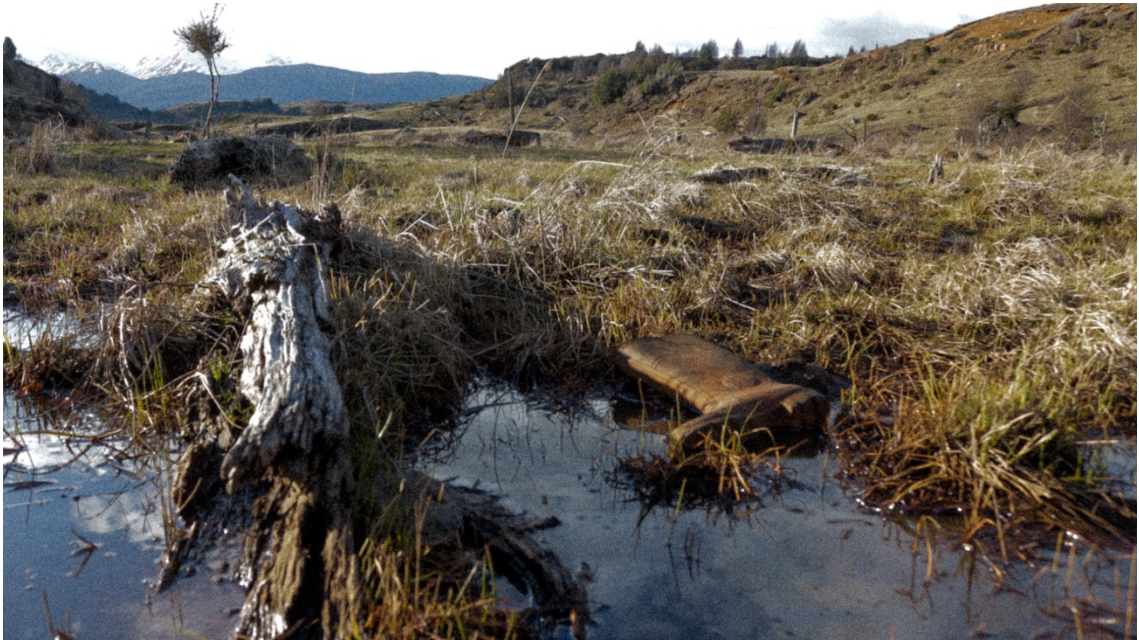
Imagen 8. Esta escena me recordó a La Zona de Stalker 1 , ya que se sentía una fuerza similar en el ambiente, donde la naturaleza predominada sobre cualquier elemento que tuviera relación con el hombre (la bota en este caso) apropiándose de ella, como si la tierra de a poco se la fuera tragando hasta lograr impregnarla de su esencia y convertirla en parte de ella. Seis Lagunas, Coyhaique. Primavera de 2016.

reflejos de las nubes en el agua. La observé, la registré y la dejé ahí, tal cual la encontré, sin quebrantar la atmósfera que se percibía en ese lugar.