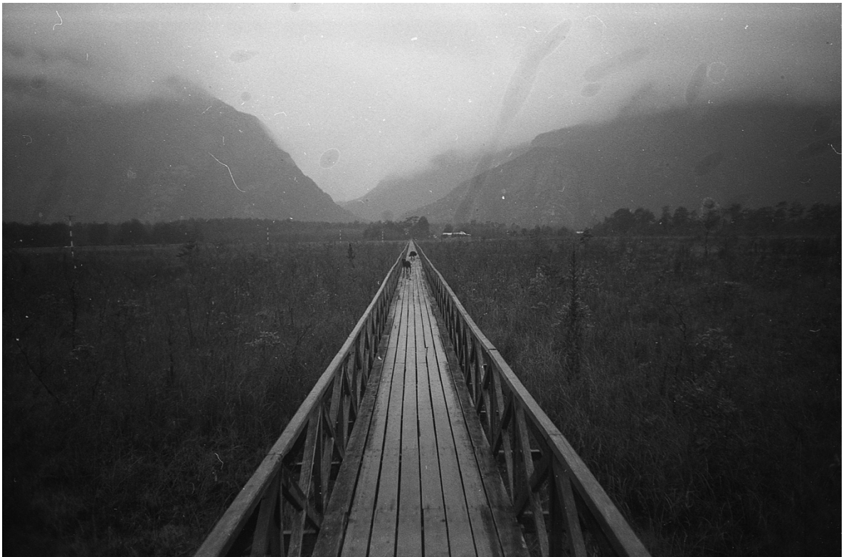
Imagen 11. La interminable pasarela que conecta el pueblo con el aeródromo. Al fondo se logran divisar dos perros que me acompañaron en el recorrido. Fue inevitable no detenerme a la mitad del camino y observar hacia ambos lados. La pasarela era una línea recta, que parecía perderse en ambos extremos, rodeada de un enorme valle pantanoso al cual no se podía bajar. La bruma dejaba entrever los cerros, pero no en su totalidad. La sensación de inmensidad del entorno era gigantesca. Caleta Tortel, enero de 2017.

semblante; esa mirada que reflejaba el peso de vivir en un lugar. Caminé hasta el final del pueblo donde se podía divisar una playa a mano izquierda y otro camino que se adentraba al monte. Regresé hasta la rotonda, rumbo al mirador que quedaba de camino al aeródromo.