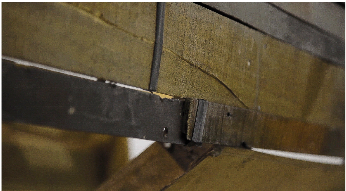
Imagen. 40. Trozo de fierro unido a una tabla por medio de una tira de goma. A veces, los clavos no eran lo más indicado, y cuando la madera escaseaba había que suplir esa falta con lo que hubiese a mano. 2018.

El bote había alcanzado un nivel de construcción que me dejó conforme, lograba dar con una impronta llena de identidad. Luego de esto comencé a trabajar el asunto del