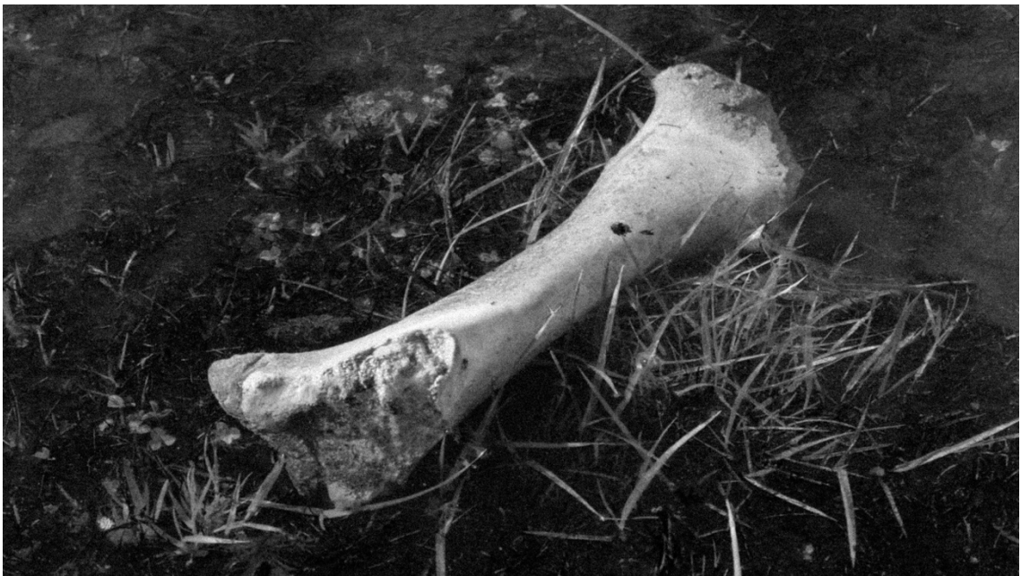
Imagen 5. Hueso de animal encontrado de manera imprevista en el prado del campo de mi tío, rodeado por flores y pasto. El tono marmoleo y su carcomida apariencia resaltaban entre el uniforme paisaje del prado. Seis Lagunas, Coyhaique. Primavera de 2016.

El recorrido del hueso fue entregando variadas texturas, figuras e interacciones con elementos que había en el agua, como ramas, palos y espuma. La escena acabó con el hueso sumergido en un sector de mayor profundidad, desprendiendo burbujas desde el interior, que emergían a la superficie. Fue un momento único e irrepetible.