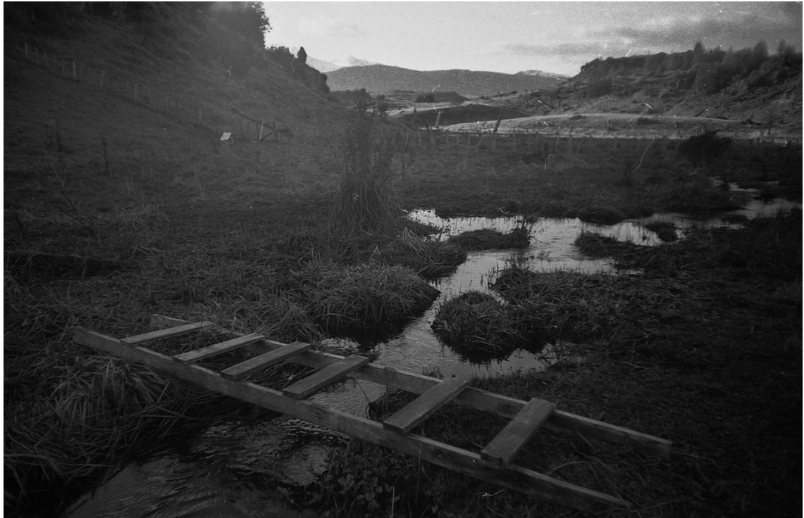
Imagen 4. Escena de un atardecer en el pantano y la escalera como puente. La luz de ese momento le daba un brillo particular al estero, que avanzaba tranquilamente, dejando un sonido de exquisita textura. Seis Lagunas, Coyhaique. Primavera de 2016.

Al ver la escalera recostada sobre la tierra me percaté de lo particular de la escena. Esta se había convertido en un puente, que además de conectar dos lados separados por un obstáculo natural acentuaba la corriente del estero, generando una especie de bajo nivel con una visión reticulada del agua, formada por los espacios entre escalones. A pesar de que la escalera llegó a ese lugar por una decisión propia, se complementaba de manera armónica con el lugar, como si fuera parte de él, como si siempre hubiera estado ahí.