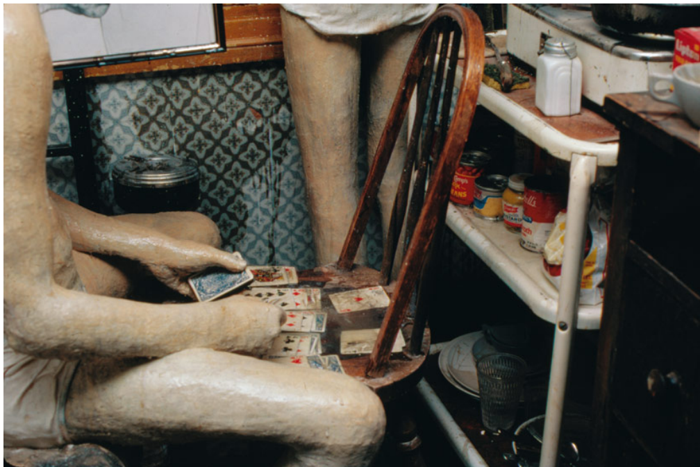
Imagen 28. Edward Kienholz: Sollie 17, 1979. Smithsonian American Art Museum.

Dentro de este periodo fue que tuve contacto con referentes artísticos que fueron definiendo y alineando mis intereses. La obra de Edward Kienholz me influenció en un aspecto más estético y compositivo. Trabajaba con escenas y personajes, aludiendo a acontecimientos o lugares anecdóticos, que abordaba desde su mirada. Las figuras de yeso y los tratamientos con pinturas y barnices de los objetos y escenarios lograban una unidad, estando todo dentro de la misma tónica. Sin duda fue un claro referente al momento de desarrollar el trabajo del “condicionamiento” anteriormente mostrado.