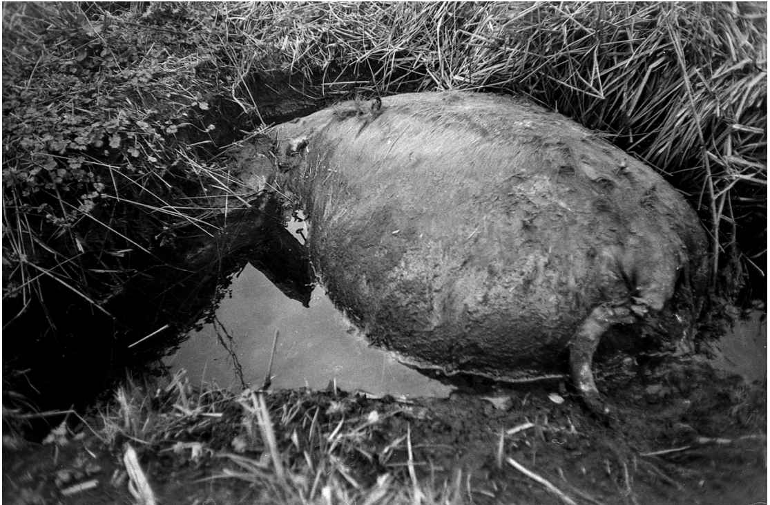
Imagen 2. Vaca empantanada. El cuerpo yacía en una posición de descanso, dejando solo a la vista el lomo y la cola. El pelaje aún se encontraba casi por completo, salvo por sectores donde el barro comenzaba a ganar terreno sobre el cuerpo sin vida. Seis Lagunas, Coyhaique. Primavera de 2016.

del cuerpo a la imaginación, ya que lo que sucedía bajo el agua era todo un misterio. Estaba en una posición de descanso, como si no hubiera luchando por intentar salir de ahí, solo dejó al tiempo trabajar con tranquilidad y llevarse su vida. La otra era lo opuesto. El concepto de muerte se percibía de manera directa y cruda, se veía su lenta descomposición. Huesos carcomidos y cuero seco e inerte, con moscas a su alrededor. La imagen descarnada de la muerte. Fue sin duda un encuentro anecdótico, una alegoría de la vida y la muerte, presentada de manera opuesta y complementaria al mismo tiempo.