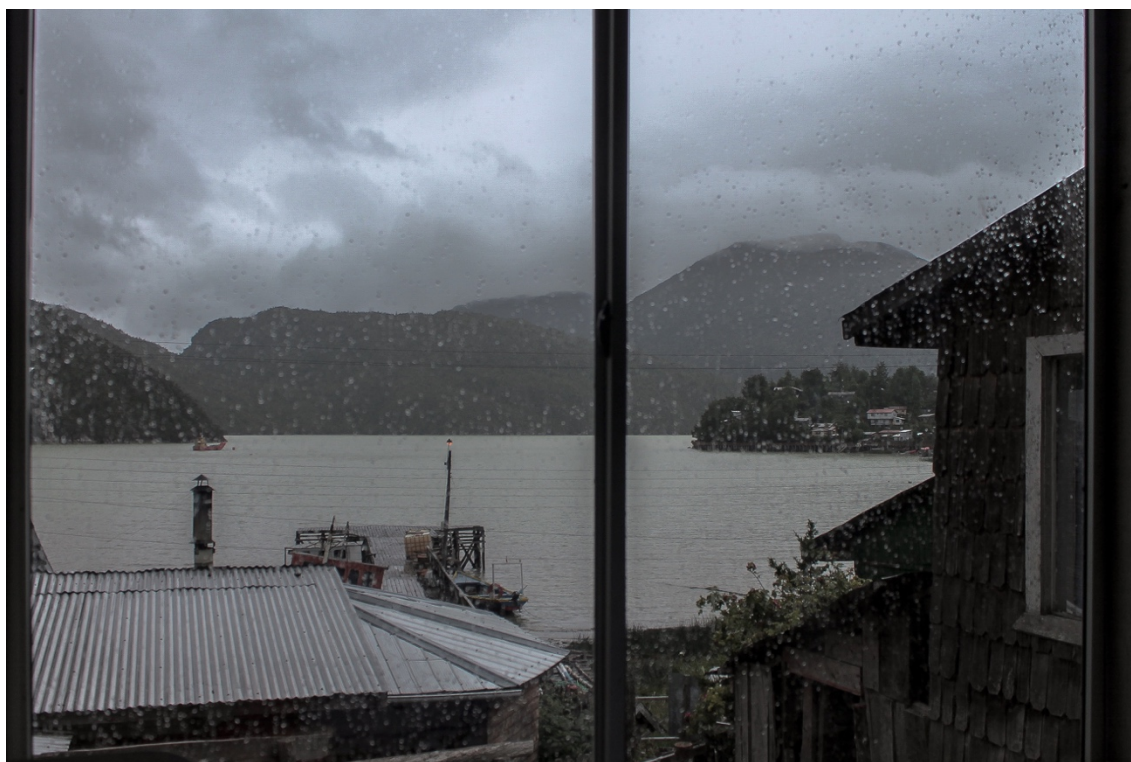
Imagen 14. La ventana, el elemento de consuelo y esperanza. Anhelábamos salir y sentir la lluvia. Verla caer sobre el ventanal no era suficiente, había que sentirla, experimentar de lleno la simple y hermosa lluvia. Caleta Tortel, enero del 2017

Sin duda toda esta situación desmoronó la idealización que me había armado antes de volver. La visión del trabajo perfecto en ese místico lugar había cambiado rotundamente. En fin, los caminos estaban zanjados y había que seguir adelante.