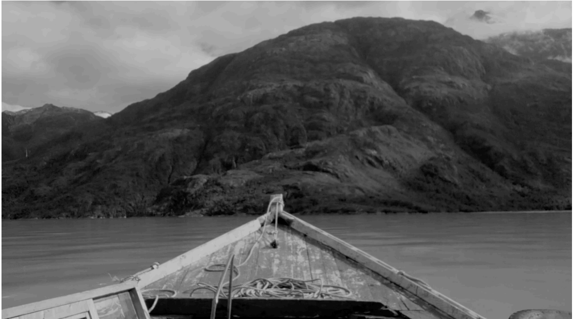
Imagen. 43. Captura del video proyectado en el montaje.

El sonido fue ajustado para potenciar los niveles del motor del bote junto con el oleaje golpeando la embarcación. Con ese ajuste la atmósfera poseía una sonoridad constante y envolvente que lograba situar al espectador dentro de la embarcación.