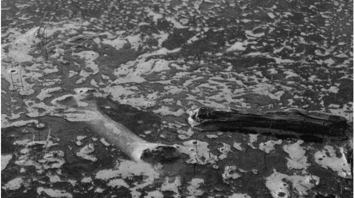
Imagen 6. El hueso flotando sobre el estanque, camuflado entre la espuma del agua y el trozo de madera.

Al llegar al estanque el plan de lanzarlo fuertemente perdió terreno ante la idea de posarlo delicadamente sobre el agua, dejando que la sutil corriente lo fuera moviendo de un lado hacia otro, recorriendo el estanque. En un momento dado, el hueso llegó a un lugar donde había mucha espuma y un trozo de madera que curiosamente se asemejaban a este. La espuma blanquecina disimulaba al hueso por debajo del agua, y la única parte que sobresalía de esta tenía un peculiar parecido a la astilla de madera que flotaba a un costado. La imagen me parecía una especie de camuflaje, por la textura uniforme y el contraste que generaba la espuma en el agua.