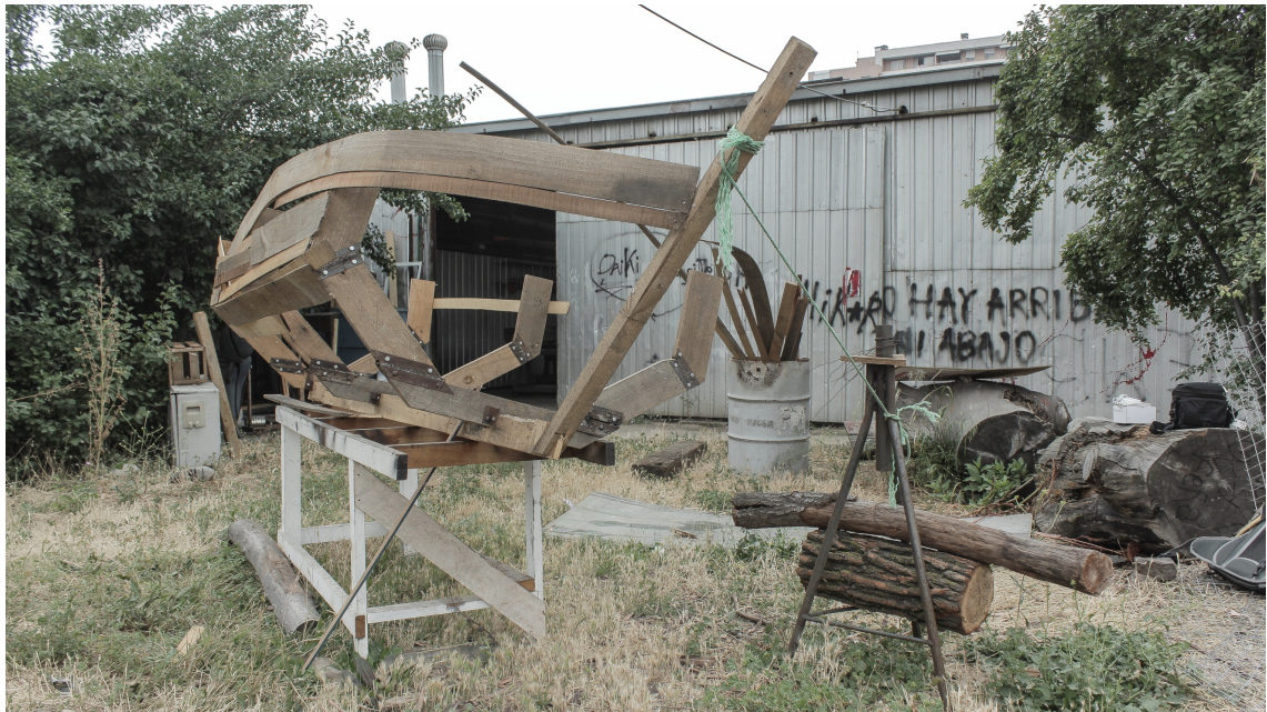
Imagen. 38. Fotografía del bote y su entorno anteriormente descrito, diciembre del 2017.

Luego de aquella reflexión decidí pausar el trabajo y concentrarme en resolver el tema del movimiento. Claro que no era tan simple como hacer que se moviera, sino que tenía que dar con el ritmo indicado, el cual remitiera al agua y al flotar. Luego de semanas de pruebas, errores y aciertos logré encontrar lo que buscaba; pero para ese entonces el bote no me convencía a nivel compositivo, le faltaba trabajo.