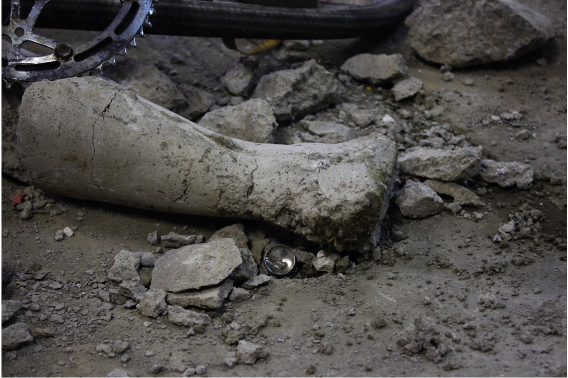
Imagen 20. Detalle de pierna de concreto con plato de bicicleta enterrado sobre esta. Se logra apreciar la superficie de cemento destruida por el impacto del accidente. Taller de Dibujo V, Facultad de Artes Universidad de Chile, 2014.