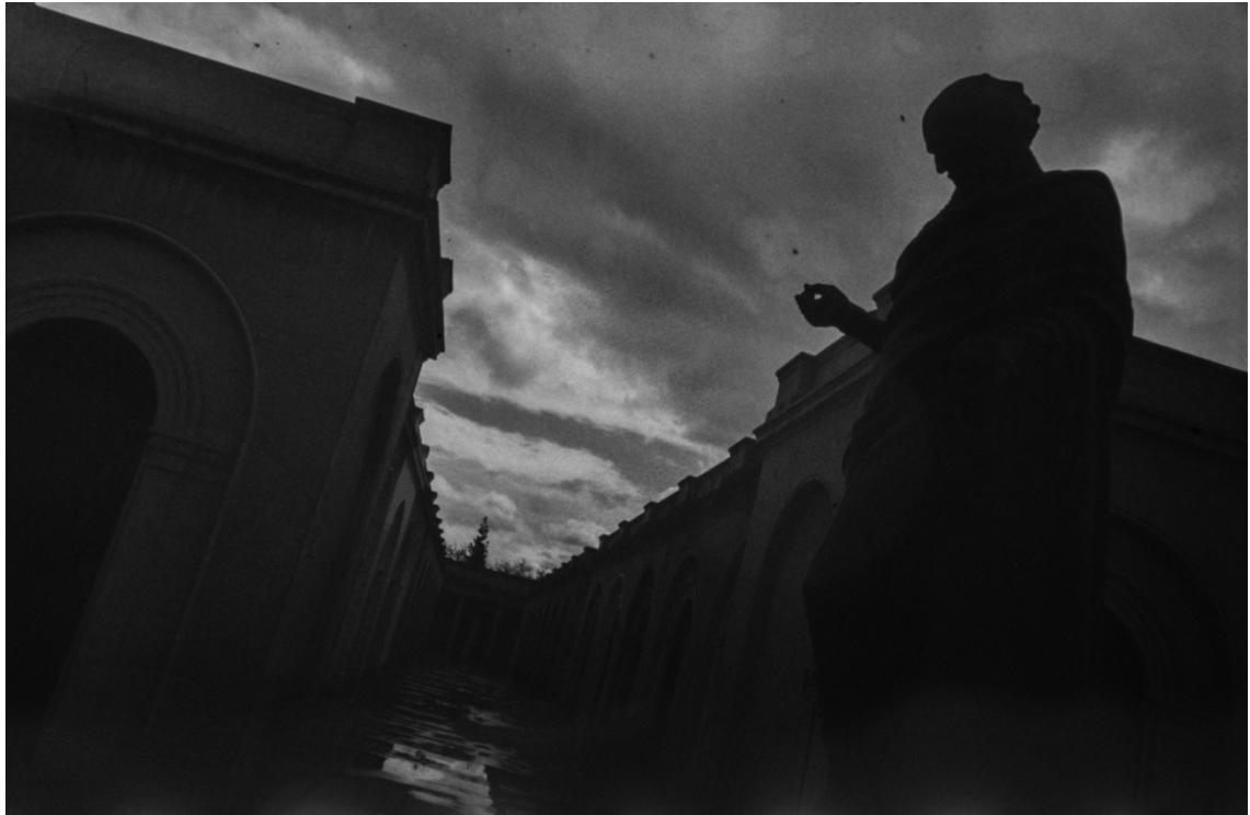
Imagen 24. Fotografía análoga, 35mm blanco y negro. Cementerio Católico, invierno de 2015.

Esta fotografía es parte de un rollo que hice en el Cementerio Católico un día de invierno. Recuerdo que me desperté y estaba lloviendo muy fuerte. Mi cama en ese entonces quedaba de frente a la ventana de mi pieza, por lo que la primera imagen que tuve al despertar fue un cielo cargado de inmensas nubes grises, muy densas, que creaban una escena hermosamente dramática. La lluvia era muy intensa y parecía no parar, cuando de un momento a otro se detuvo y el cielo se despejó un poco, dejando pasar algunos rayos de sol, pero la gran parte de las nubes seguía ahí. Me sentí conmovido por aquella escena, que no era más que un simple día de invierno, pero en esa simpleza estaba contenida esa carga, que ya describí anteriormente. La poética de las cosas simples de la vida, de los fenómenos que suceden cada minuto pero que uno ha naturalizado.