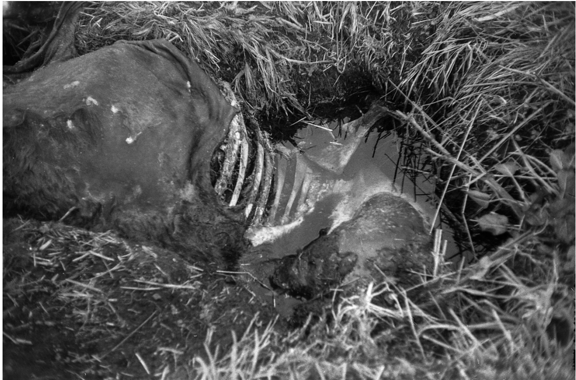
Imagen 3. La muerte descarnada. La descomposición de la carne, los huesos expuestos y el cuero seco y retraído. Un cuerpo carente de vida, a completa merced del tiempo, quien se encargará de desaparecer todo rastro de lo que fue.

El estero donde murieron ahogadas las vacas cruza todo el campo, proporcionando agua a los animales que habitan el lugar. Era una fuente de este elemento vital, pero para mí se convirtió en un obstáculo que me impedía cruzar hacia el otro lado del pantano y seguir explorando hacia las lagunas que se divisaban desde la casa. Fui de a poco tanteando el terreno y evaluando los riesgos. Descarté saltar por sobre él, ya que si algo salía mal las posibilidades de ahogarme eran muy altas. A medida que me acercaba al borde de este, la tierra se sentía mucho más débil. Me ayudaba de una caña, que enterraba sobre el suelo para saber si estaba pisando tierra firme. Al comprobar que no podía saltar ni acercarme mucho al borde, tuve que buscar una solución al problema, y fue ahí donde recordé que en la casa había una escalera de madera. Subí en busca de ella. Al lograrla bajar la puse en forma horizontal por sobre el estero, logrando conectar un lado del pantano con el otro y cruzar hacia el otro lado.