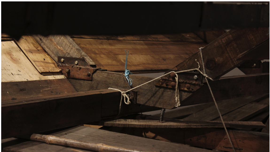
Imagen. 41. Fotografía del mecanismo del bote. Museo de Artes Visuales, MAVI 2018.

mecanismo que le daría movimiento a la escena. Investigué sobre el movimiento, dibujé prototipos, probé varias maneras, pero no lograba dar con el movimiento que estaba buscando, hasta que me dediqué a observar como el bote se comportaba en su entorno. Estaba sobre el mesón, en un espacio abierto, debajo de un árbol que le daba sombra. Estaba amarrado con una sogá a la superficie para que no se cayera con el viento, y ahí fue donde advertí un asunto importante. El estar amarrado le proporcionada estabilidad, y era justo eso lo que tenía que tensionar. Giré el bote, apoyándolo de manera perpendicular a los largueros del mesón, quedando atravesado y con una leve inclinación. Sujeté la cuerda con mi mano y el viento era el encargado de mecerlo suavemente a su ritmo. Era lo que estaba buscando, pero ahora tenía que lograr replicar la fuerza del viento que generaba el movimiento. Ya sabía que necesitaba proporcionar inestabilidad en el apoyo del bote y una fuerza constante que le diera el empuje. Probé hasta que lo conseguí. Un pequeño motor del cual salía una biela, una lienza y un par de resortes conformaron el mecanismo que tradujo el vaivén del bote meciéndose en el agua.