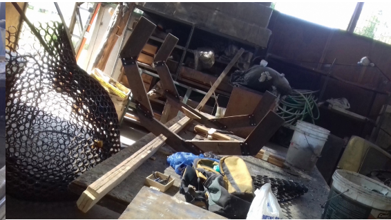
Imagen. 36. Segunda cuaderna