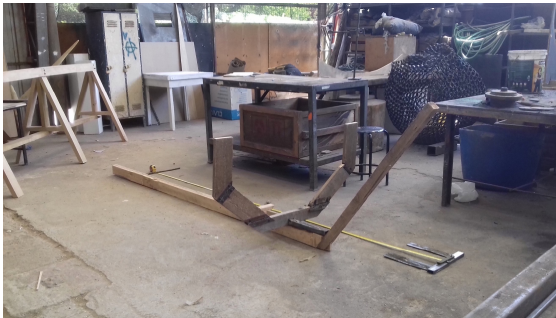
Imagen. 35. Primera cuaderna

Tras solucionar ese problema técnico el avance se me hizo más rápido, logrando terminar las tres cuadernas y juntarlas a la quilla, quedando una sola pieza, el esqueleto del bote.