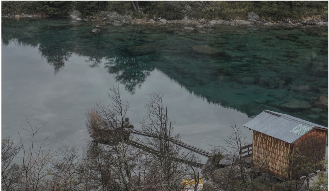
Imagen 10. Río Cochrane. La sombra proyectada por el cerro de enfrente permite apreciar el hermoso color turquesa del agua y su transparencia, que permite ver el fondo con su flora y fauna. Esta parte del río siempre se veía calma, pero al adentrarse en sus aguas se sentía la fuerte corriente y su gran profundidad. Un río seductor y engañoso. Cochrane, primavera del 2016

La experiencia visual y emocional que viví en este lugar fue muy parecida a la anterior en el campo, pero a pesar de la similitud, esta tomó un lineamiento muy distinto al del otro. En el campo había vivido un proceso interior, donde la soledad tuvo un papel protagónico. Acá, por el contrario, tuve la compañía de dos personas, lo que ya marcaba una gran diferencia y me permitió compartir con otros mis experiencias, ideas y sentimientos que nacieron en ese lugar y ese momento. Tuve conversaciones muy profundas, que aportaron de manera significativa a mis cuestionamientos y reflexiones. Estos diálogos trataron distintos temas, llegando a opiniones que a veces coincidían y otras que discrepaban. Fue parte del proceso, y agradezco profundamente el haber tenido la oportunidad de compartir con estas personas su vida, su casa y su hospitalidad. Luego de haber pasado un tiempo luchando con mi propio ser, vino el tiempo de volver a socializar, y lo interesante fue que esto no quebrantó la atmósfera de la que me había impregnado en el campo, sino que, al contrario, la potenció en gran manera.