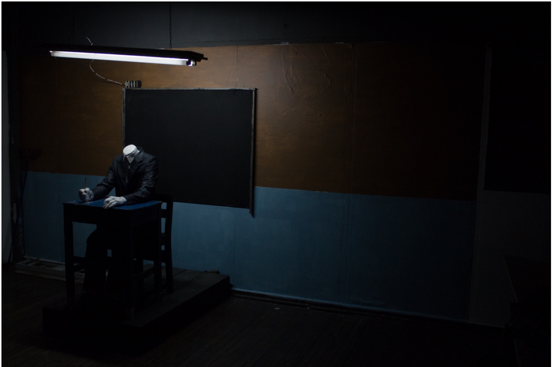
Imagen 21. Pablo Vallejos: Sin título. Instalación, 2014. Montaje para Taller central de Escultura, Facultad de Artes Universidad de Chile.

A diferencia del trabajo del cuerpo y la bicicleta, el siguiente se aleja un poco en el origen de la temática, ya que no proviene de una experiencia personal, sino que de un interés más generalizado. El condicionamiento de masas.