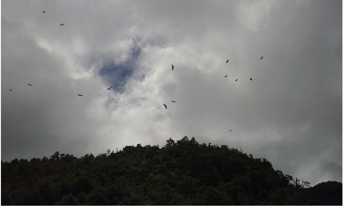
Imagen 15. Bandada de cóndores planeando sobre un monte. Ninguno agitaba sus enormes alas, solo se movían delicadamente de un lado a otro, demostrando soberanía absoluta del cielo, amos y señores de las alturas. Caleta Tortel, enero del 2017

Avanzamos un largo trecho, con el motor en baja velocidad, casi dejando que la corriente nos llevara para poder ir observando detalladamente cada lugar en busca de nuestro objetivo. Lo ideal era encontrar ciprés, árbol autóctono de la región y característico de Tortel. El Ciprés no se pudre; nace en el agua y muere en el agua dicen los viejos lugareños. Su aroma es muy particular. En la Caleta lo usan en las pasarelas, los gruesos palos que sostienen el peso de las tablas enterrados en el fondo del mar. También juntan la viruta para hacer fuego ya que es de combustión rápida.