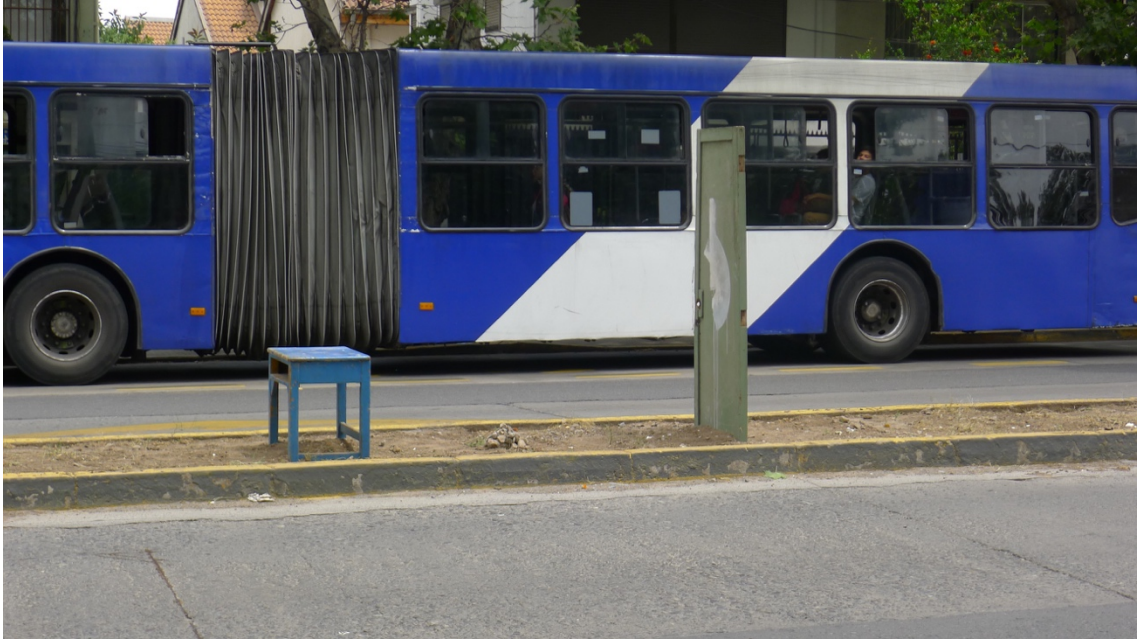
Imagen 27. Pablo Vallejos: No Lugar. Instalación, 2015. Ñuñoa.

Al terminar este ejercicio y analizar lo que había ocurrido, sentí que había dado con algo que andaba buscando. Cada paso que daba se acercaba más a los intereses que estaban surgiendo dentro de mí, trabajando la poética desde el cuestionamiento o inquietud hasta su desarrollo y materialización. Los comentarios que recibí en ese entonces en el taller reafirmaban la idea.