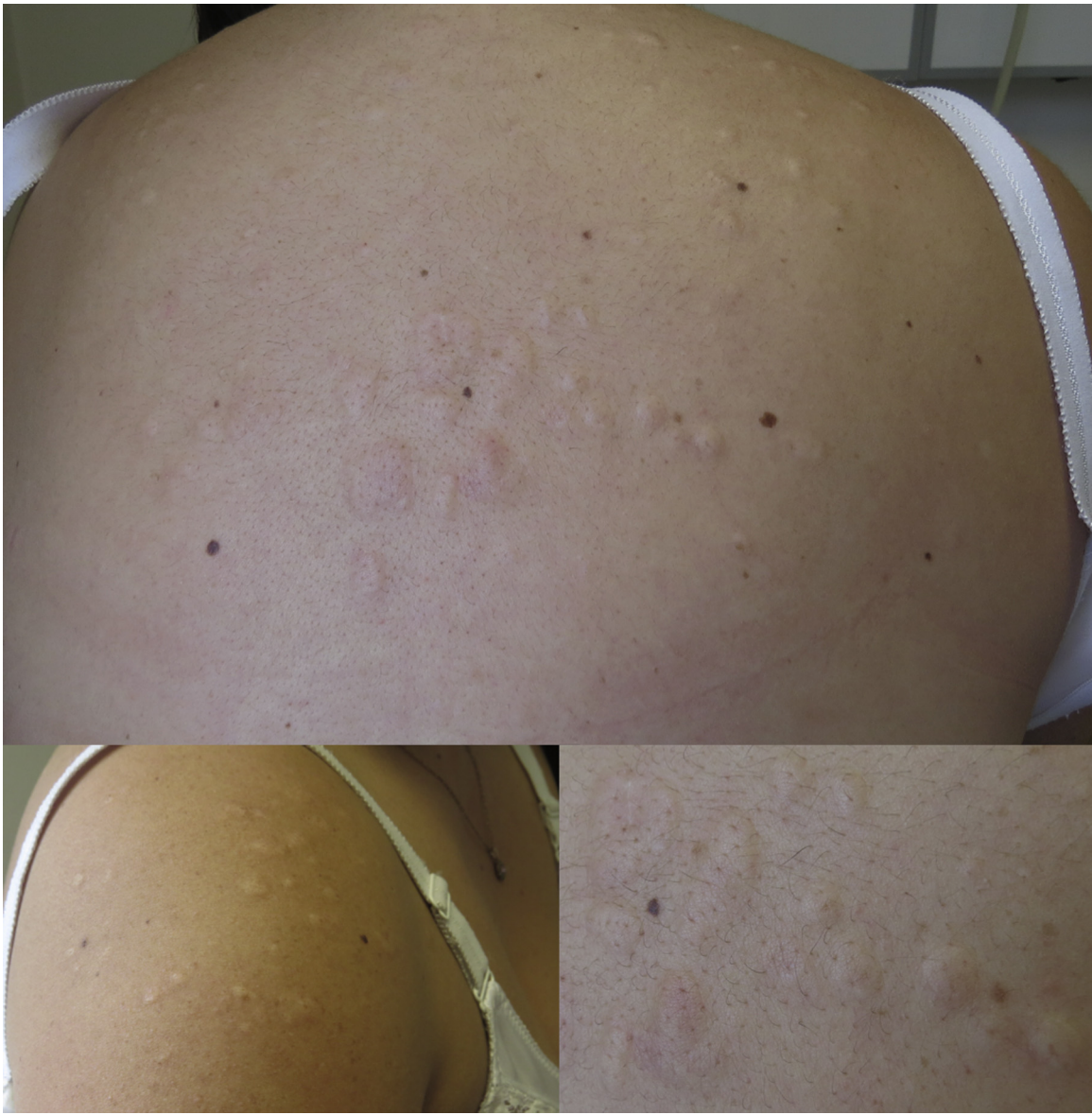
Figura 1. Pápulas y placas de color piel localizadas en la espalda y el hombro derecho, de apariencia laxa.