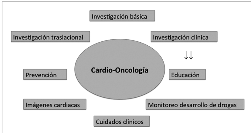
Figura 3. Rol de las unidades de Cardio-Oncología. La interacción multidisciplinaria clínica y básica es fundamental para el desarrollo de esta especialidad.

pronóstico de los pacientes oncológicos. Afortunadamente, el abordaje multidisciplinario permite implementar estrategias para prevenir, identificar y tratar precoz y eficazmente estas complicaciones. La pesquisa mediante el uso de técnicas de imagen y biomarcadores nos permiten identificar incluso aquellos pacientes con signos subclínicos de cardiotoxicidad.