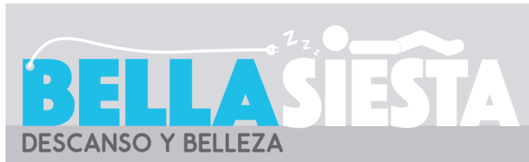
Ilustración 6: Logo corporativo.

Es así como el logo representa todas las ideas mencionadas anteriormente, transmitiendo su identidad y comunicando lo que es Bella Siesta, un lugar de descanso y belleza.