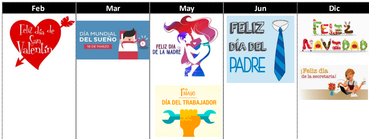
Ilustración 7: Campañas de marketing.