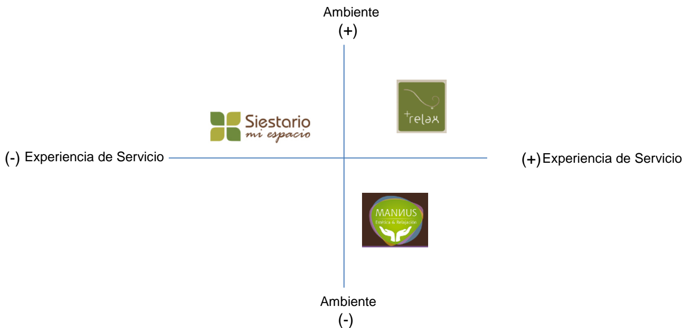
Ilustración 2: Posicionamiento Competidores.

Ambiente: privacidad, aroma agradable, limpieza, tranquilidad, silencio, temperatura adecuada, luz tenue, lugar acogedor, cómodo y seguro.