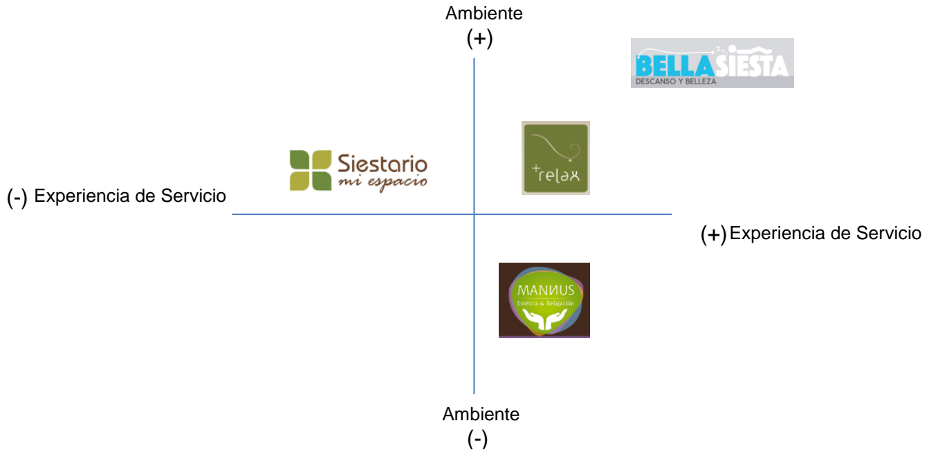
Ilustración 5: Posicionamiento de Bella Siesta.