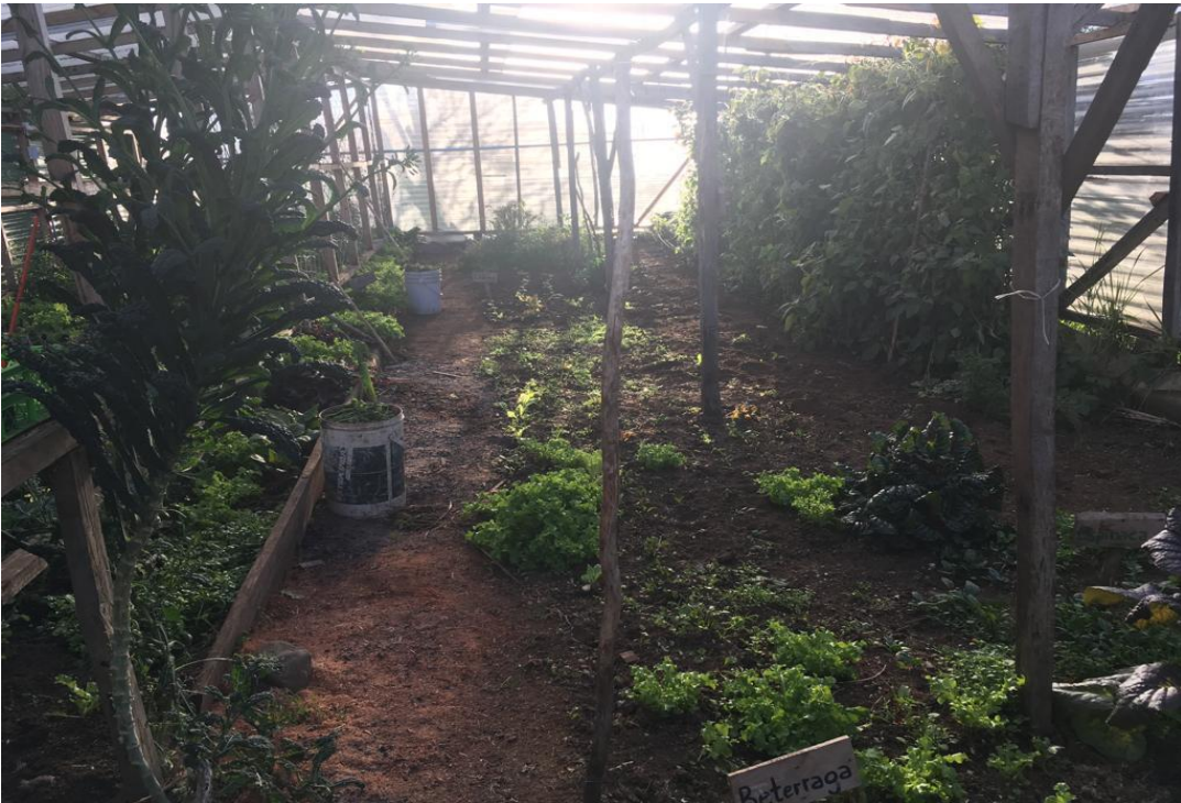
Fotografía n°8: Paisajes desde Rauco. Fuente: Elaboración propia, septiembre 2019.