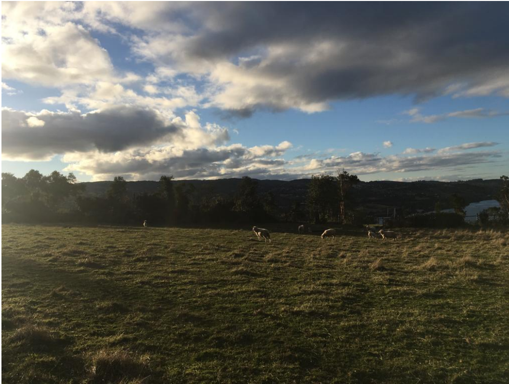
Fotografía n°9. Casa de Rauco Septiembre 2019.