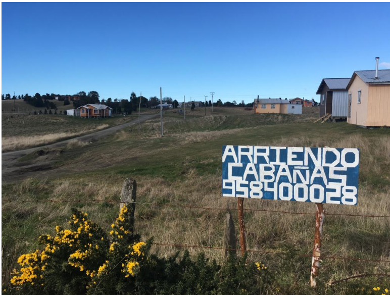
Fotografía n°4: Cartel de Arriendo. Fuente: Elaboración propia, septiembre 2019