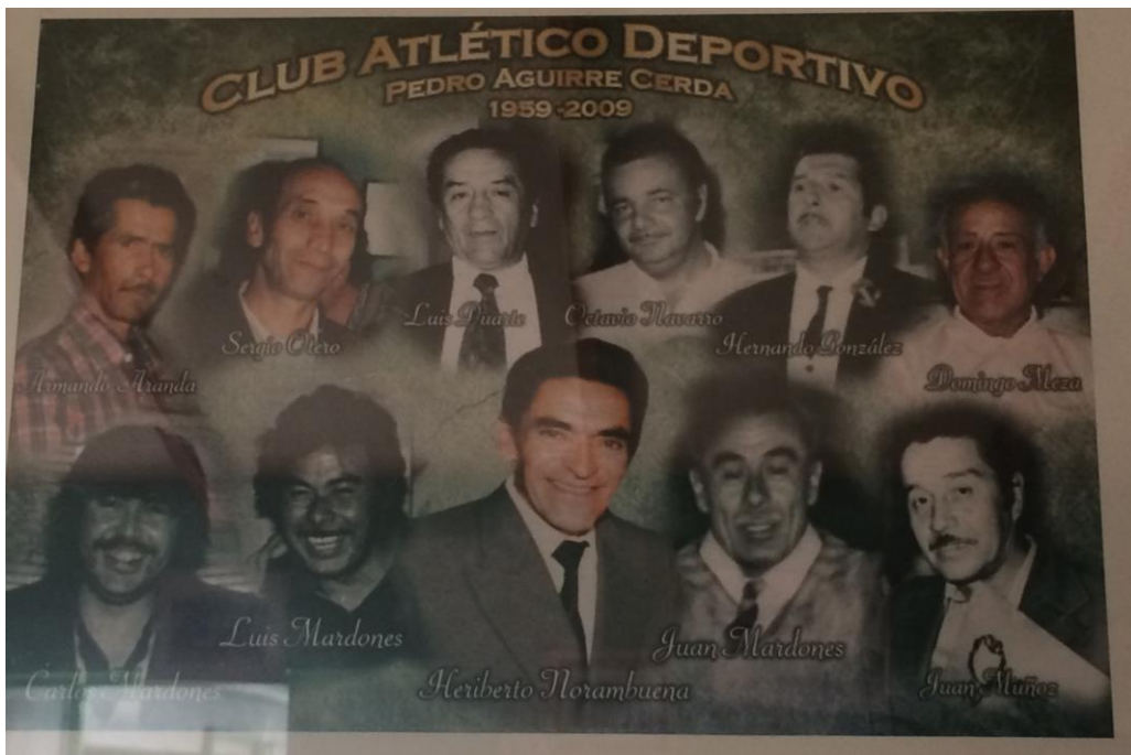
Fotografía N°1. Canales, D. 2019 Miembros Fundadores del Club. Digital. Fotografías tomadas a material fotográfico ubicado dentro de la sede del club PAC