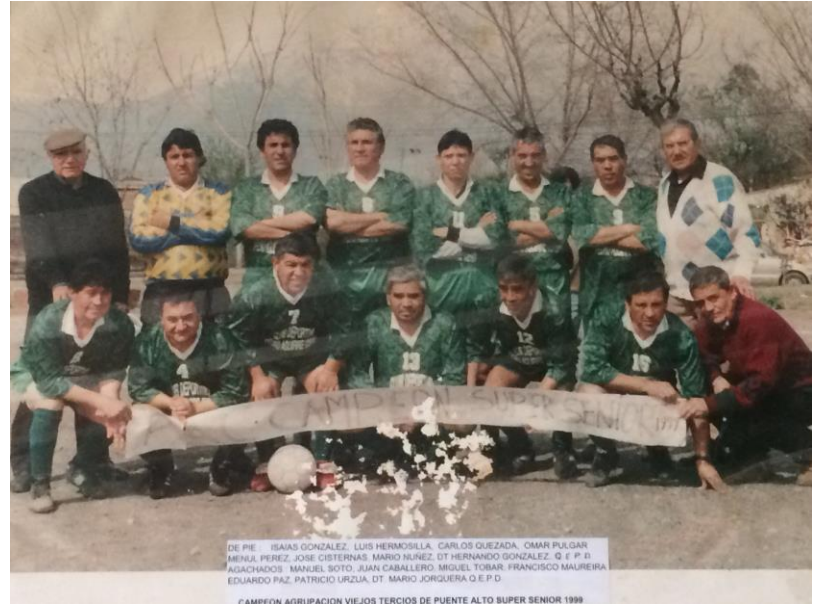
Fotografía N° 2 y 3. Canales, D. 2019. Fotografías de Campeonatos ganados por el club en 1993 y 1999. Digital. Fotografías tomadas a material fotográfico ubicado dentro de la sede del club PAC