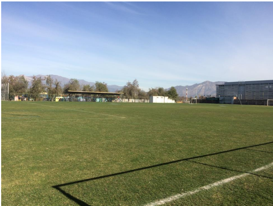
Fotografía N°4. Canales, D. 2019. Estadio del Club Pedro Aguirre Cerda. Digital. Cancha de Pasto.