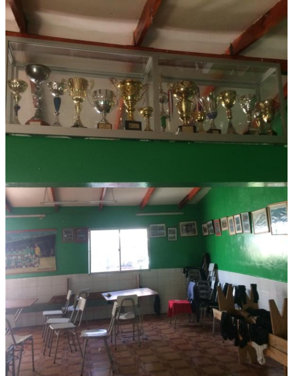
Fotografías N° 5 y 6. Canales, D. 2019. Sede del Club Pedro Aguirre Cerda. Digital. Salón de la Sede