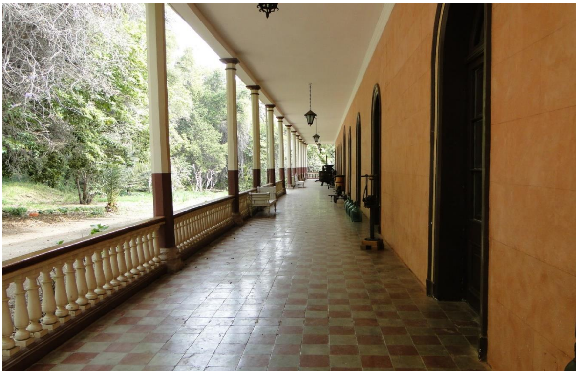
Figura 3.- Corredor de la Casa Patronal del Fundo San Juan de Pirque.

Esta condición despierta la preocupación de la Corona, en tanto existía una gran población dispersa y autónoma ajena a leyes y normas de la época, provocando que en la segunda mitad del siglo XVIII, con el fin de “ reducir a pueblo ” a sus habitantes y así garantizar en ellos el dominio colonial, tendieran a despoblarse estos conjuntos en favor de los nuevos centros fundados para tal efecto. Si bien se fundó un importante número de nuevas ciudades, muchas de ellas nacieron próximas a estos asentamientos, revirtiendo el proceso de ruralización que vivió nuestro país gran parte del período colonial 10 .