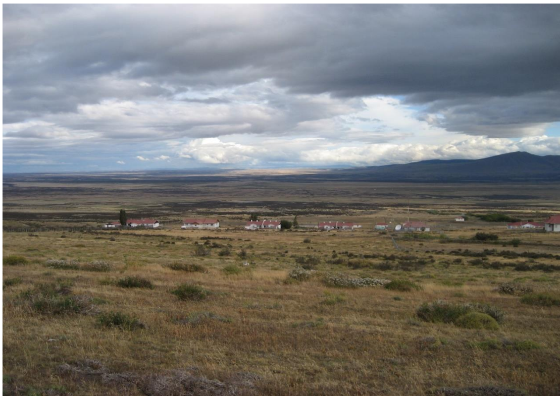
Fig. 9. Estancia Cerro Guido. Fotografía de la autora (2009)

Como éstos hay muchos otros casos en la región, pero hemos destacado los más especiales. Sin embargo, debemos reconocer que de no haber sido puesta en valor esta expresión arquitectónica a mediados de los noventa, hoy no contaríamos con estos conjuntos, que no solo hablan de una arquitectura singular, sino de una fuerte y especial tradición local