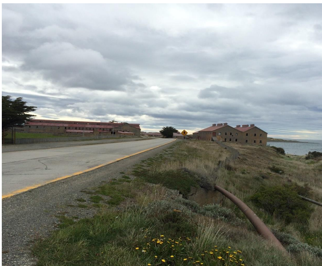
Figura 6. Estancia San Gregorio, Patagonia Central. A la derecha se aprecia el Galpón de Esquila y ala izquierda la Grasería, única de su tipo que persiste en la región.

De los casos estudiados cabe destacar el Frigorífico Puerto Bories 25 (Figura 7) y la Estancia Cerro Guido. El primero estaba en proceso de desarme y dado el valor del caso gestionamos su declaración como Monumento Histórico Nacional 26 , lo que detuvo su destrucción a la vez de poner a la vista su valor. Este frigorífico dio vida y trabajo a la ciudad de Puerto Natales 27 a escasos kilómetros de distancia, si bien desgraciadamente quedó en desuso