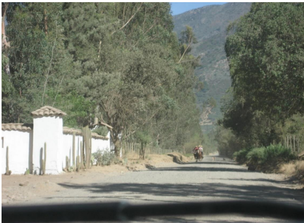
Figura 2. Altos de Cantillana, Valle central de Chile. Se aprecia la ocupación rural en base a un modelo introvertido que se impone en el territorio asignado, aislándose del entorno en busca de protección.

Los conjuntos se caracterizaban por ubicarse en un cruce de caminos o un punto estratégico que permitiera cubrir fácilmente la Merced de Tierra , se iniciaban con un primer volumen destinado a vivienda familiar que luego iba sumando otros para diversas funciones ya fueran familiares o laborales. La tradición hispana hacía construir a modo de volúmenes de un piso construidos en adobe y con pesados techos de tejas, los que iban conformando diversos patios que se relacionaban entre sí a través de corredores. (Figura 3). Estos conjuntos constituían interesantes sistemas de relaciones laborales e interpersonales, donde la característica era la imposición en el paisaje y la introversión, que se reflejaban en grandes tapias como los que se aprecian en la figura 2.