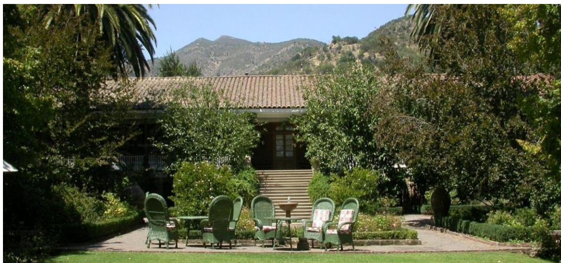
Figura 4. Hacienda Los Lingues.

De lo anterior destacamos un primer caso de reconversión a uso turístico de uno de estos conjuntos en la Hacienda Los Lingues, un conjunto rural de principios del siglo XVI que es convertida en hotel de lujo a inicios de los años ochenta 13 . De no haber existido la discusión y puesta en valor de esta arquitectura desde la Academia, muchos de estos conjuntos habrían desaparecido y no tendríamos hoy la oportunidad de disfrutar de ellos, ya sea como conjuntos privados o bien de desarrollo turístico. Sin duda la explotación vitivinícola y agrícola de exportación en esta zona ha sido también de gran ayuda para la conservación de estos conjuntos, tema cuyo análisis por sí solo daría para un nuevo artículo. (Figura 4).