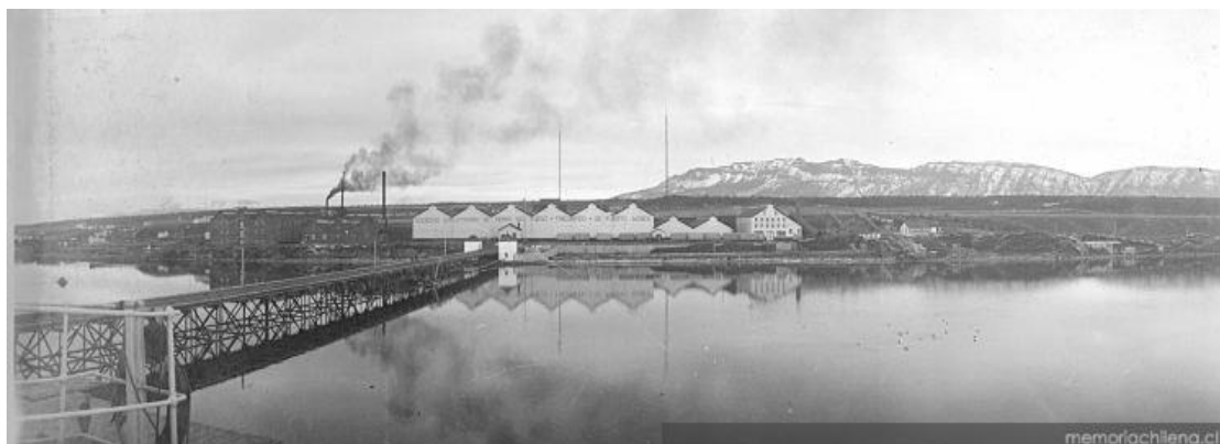
Figura 8. Hotel Singular, Puerto Bories. https://thesingular.com/hotel/patagonia . Captura: 14 enero 2019