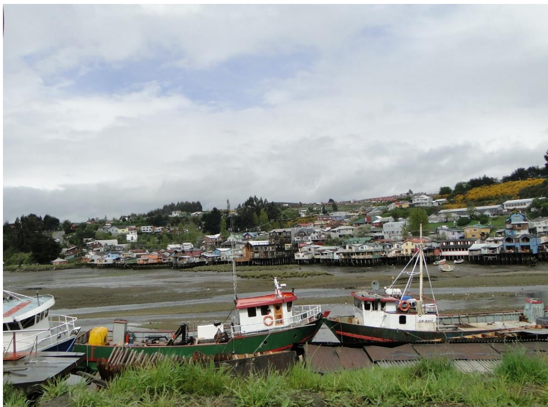
Fig. 5. Palafitos de Ancud (sector Gamboa) en la Isla de Chiloé. Fotografía de la autora (2014).

La expresión máxima de esta singular escuela la veremos en las iglesias de la Isla y su archipiélago, espacio en el que se desarrollaran las llamadas misiones circulares iniciadas por los jesuitas en el siglo XVI y continuadas por los franciscanos tras la expulsión de estos últimos en 1767. En estos viajes a través del mar se llevaba la Palabra y se iban levantando iglesias a modo de faros, las que daban cuenta de la presencia de estas pequeñas comunidades y su particular desarrollo cultural, el que apreciamos en las formas del lenguaje, la música, fiestas y costumbres.