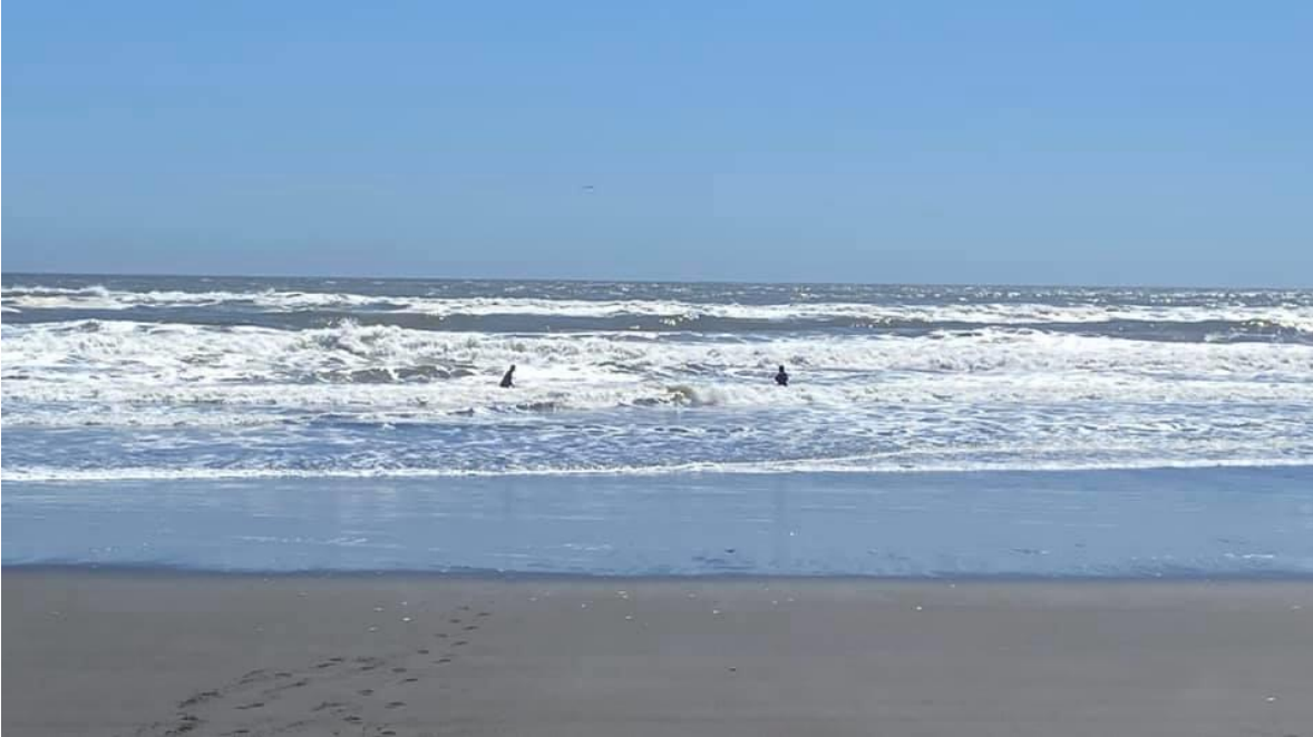
Imagen n°1: Arte de pesca: macha bailada al taloneo; Zona de extracción: orilladero, sector donde Paredes, Playa La Trinchera, zona libre