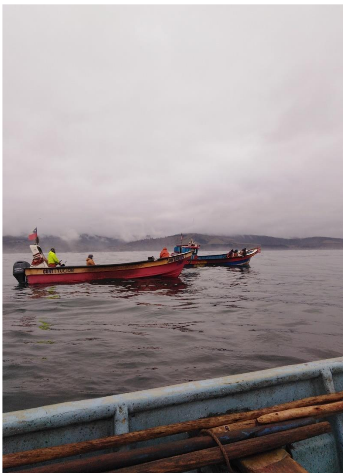
Imagen n° 3: La pesca de la merluza, frente a las costas de Duao (zona de pesca)

valorado y buscamos que ojalá sea más reconocido, ya que nosotros intentamos darles más valor agregado a los productos del mar, por ejemplo, ahora estamos haciendo algas en conserva, es nuestro nuevo producto” 32 . El oficio de la bandejera consiste en ir a la caleta y comprar un número menor de cajas a lo que podría hacer un comprador o comerciante que transporte el pescado a Santiago u otra parte del país, por eso también no todos los botes venden los recursos a las bandejeras ya que los pescadores tienen compromiso anterior con un comprador que lleve más cantidad del recurso capturado pesca. Las bandejeras realizan la tarea de filetear el pescado, envasarlo en bandejas de 3 merluzas y comercializarlo congelado entre un precio de 1000 pesos hasta 1500 pesos.