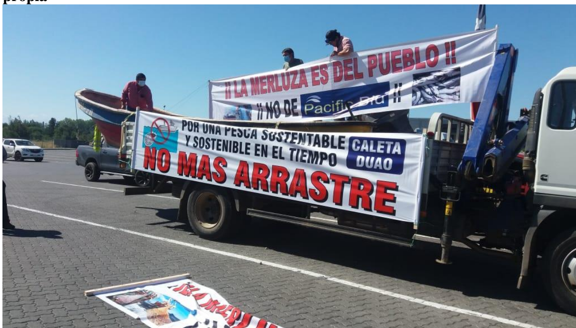
Imagen n°4: manifestación en contra de la pesca de arrastre, Talca

El conflicto histórico que hemos evidenciado a través de las legislaciones pesqueras esta latente en nuestro campo de estudio, como demanda histórica se ha buscado la eliminación de la red de arrastre en Chile, esta demanda en los primeras semanas del mes de enero 2021 se comenzó a tramitar en el congreso, los pescadores de la caleta Duao asistieron a las diversas manifestaciones que ocurrieron en todo Chile, en conjunto con aquello, la discusión en el congreso sobre la derogación de la actual ley de pesca también esta en debate, en conclusión, en materia pesquera hay muchos temas sin resolver.