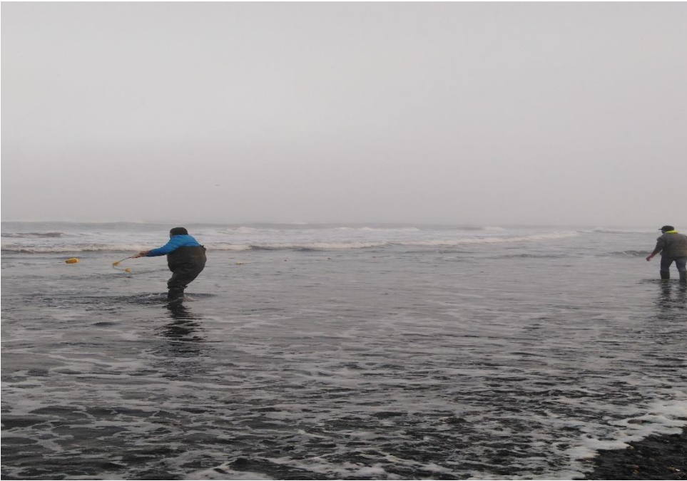
Imagen n°4: Arte de pesca, el lance, sector: La pesca