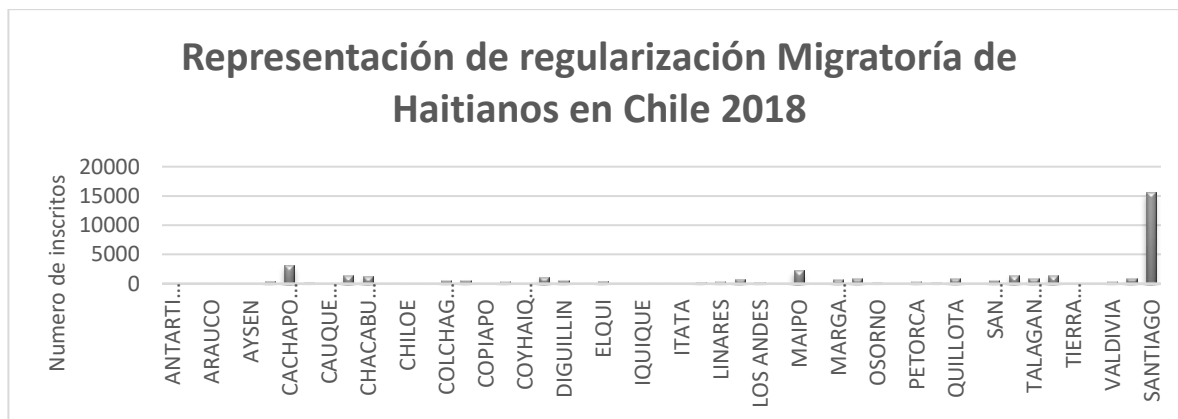
Grafico 2. representación de regularización de población haitiana por provincia- 2018 (elaboración propia, fuente de datos, sección consular, Embajada de Haití).

Para este proceso de regularización, Chile y Haití cooperaron de diversas formas en un intento de impedir que la debilidad institucional de Haití impidiera a que los haitianos beneficiaran de esta regularización como ocurrió en más de una ocasión con la República Dominicana. En Chile, hasta el 2018, Haití era uno de los países, cuyos migrantes no necesitaban un certificado de antecedentes penales para beneficiar de una visa o un permiso de residencia. Con el Gobierno de Piñera, en 2018, en el plan de ordenar la casa, se decretó que todos extranjeros deben presentar dicho documento para optar a una visa de residencia en Chile.