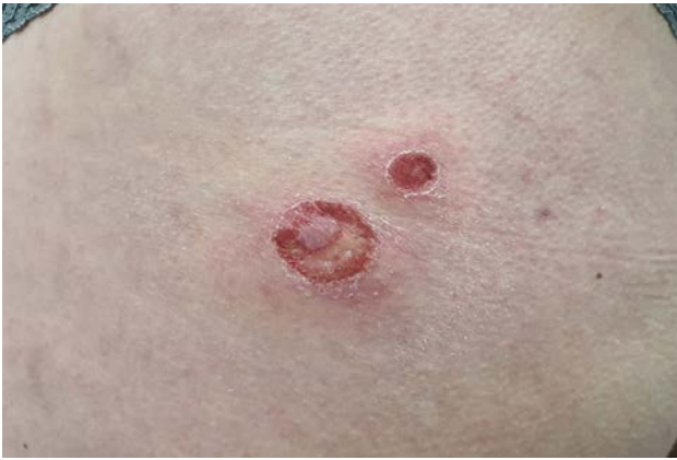
Figura 2. Impétigo ampollar o buloso (IB) en región glútea

purulento, más grandes y resistentes, pudiendo persistir durante varios días. Por lo general, hay menos lesiones, concentrándose con mayor frecuencia en regiones intertriginosas, axilas y cuello, aunque cualquier zona cutánea puede verse afectada, incluyendo palmas y plantas. El tronco se afecta con mayor frecuencia que en el INB 18 .