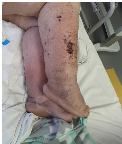
Figura 3. Linfedema de extremidades inferiores complicado con celulitis estafilocócica en paciente postrado con hospitalización prolongada