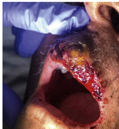
Figura 1. Herpes labial impetiginizado en paciente inmunocomprometido

El impétigo no buloso (INB) secundario representa el 70% de los casos de impétigo y es causado principalmente por S. aureus o Streptococcus pyogenes . Se produce sobre otra dermatosis subyacente que alteran la barrera cutánea.