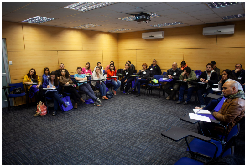
Curso «Gestión del Riesgo de Emergencias y Desastres» dirigido a Directivos y Profesionales con trayectoria en Atención Primaria de Salud” .