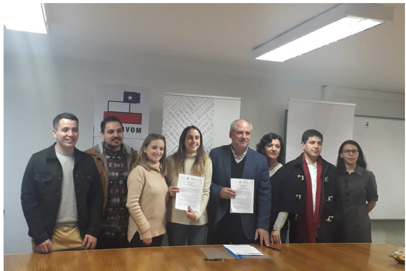
Firma de convenio de cooperación entre Movidos por Chile y CITRID 30 de mayo 2019 .