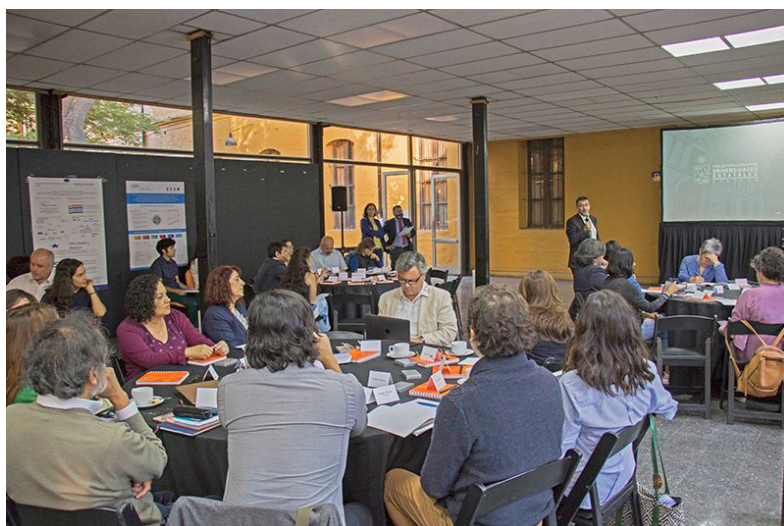
Participación en el “Primer Workshop de Investigación Interdisciplinaria y Transdisciplinaria de la Vicerrectoría de Investigación y Desarrollo 26 de marzo 2019.

Curso «Gestión del Riesgo de Emergencias y Desastres» dirigido a Directivos y Profesionales con trayectoria en Atención Primaria de Salud”.