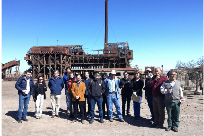
Participación en Plan de Gestión de Riesgo para Sitio de Patrimonio Mundial UNESCO "Oficinas Salitreras Humberstone y Santa Laura. Junio 2019.