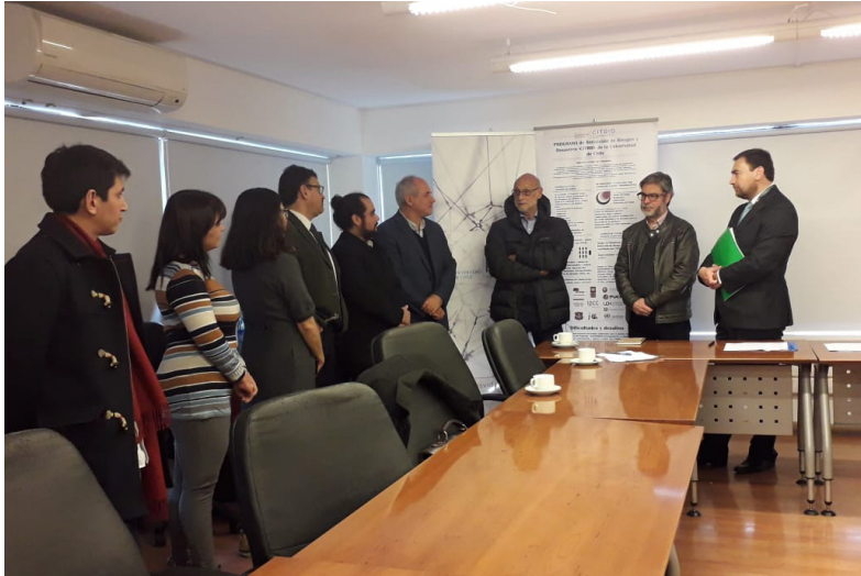
Firma de convenio de cooperación entre la Municipalidad de Pudahuel y CITRID 30 de mayo 2019.