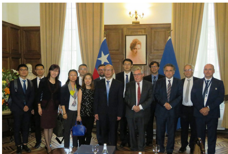
CITRID se reúne con Viceministro de Justicia de China.