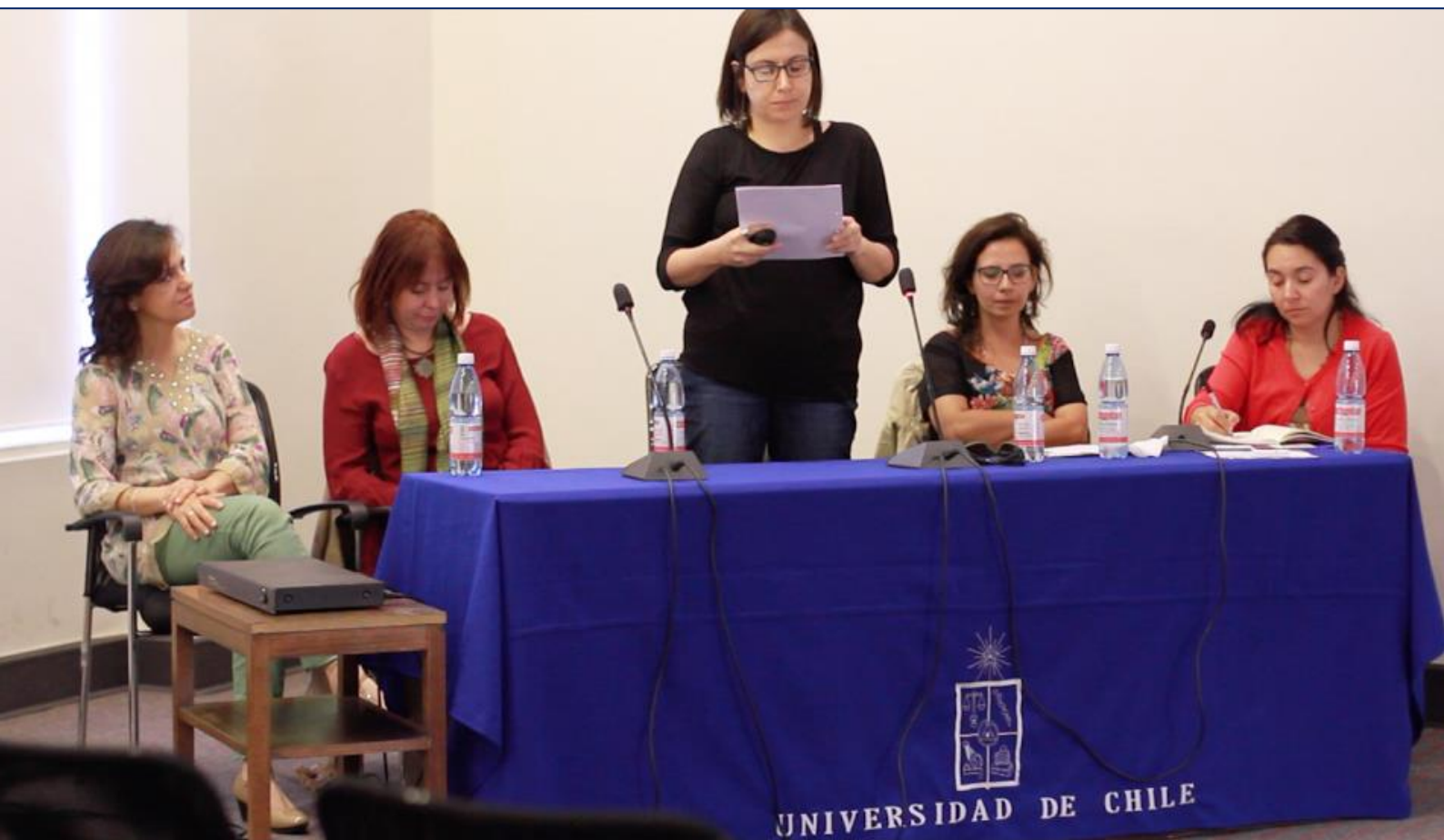
Jornada “Educación con niños y niñas de hoy” realizada en Casa Central en el marco de la III Semana de las Pedagogías.