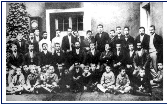
Primer curso de estudiantes de pedagogía. Instituto Pedagógico. 1889

En julio de 2016 se realizó una primera reunión con las autoridades de la Universidad de Bahía para iniciar las gestiones para la firma del convenio.