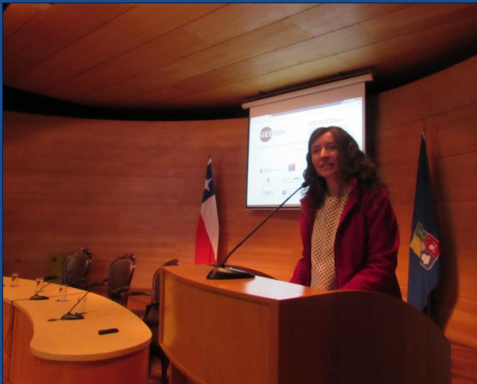
La subsecretaria de Educación Valentina Quiroga en la inauguración del Primer Seminario Internacional en Evaluación Educativa