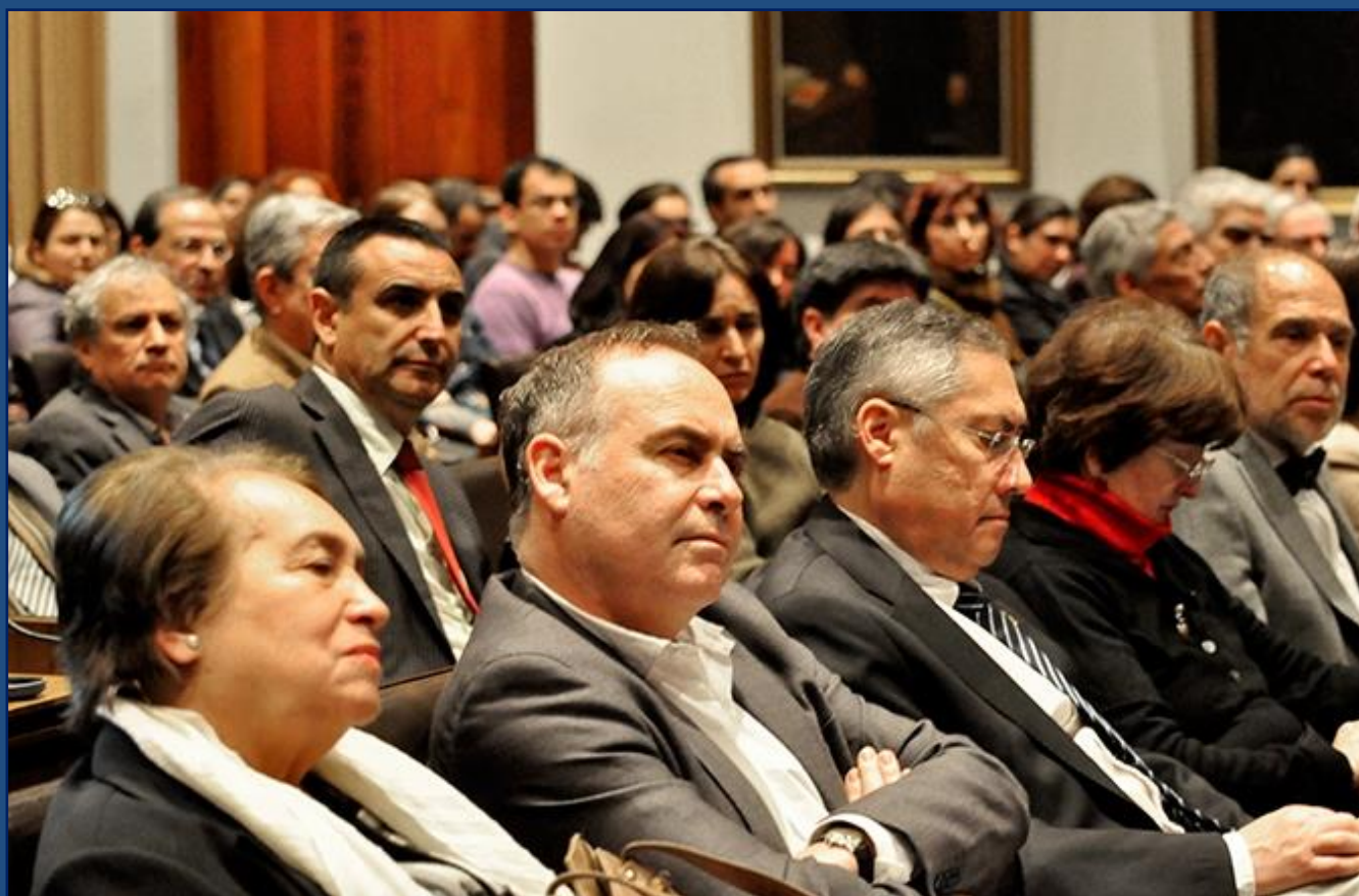
Rector Ennio Vivaldi y autoridades del PTE en la actividad oficial de lanzamiento del Programa efectuado en Casa Central.