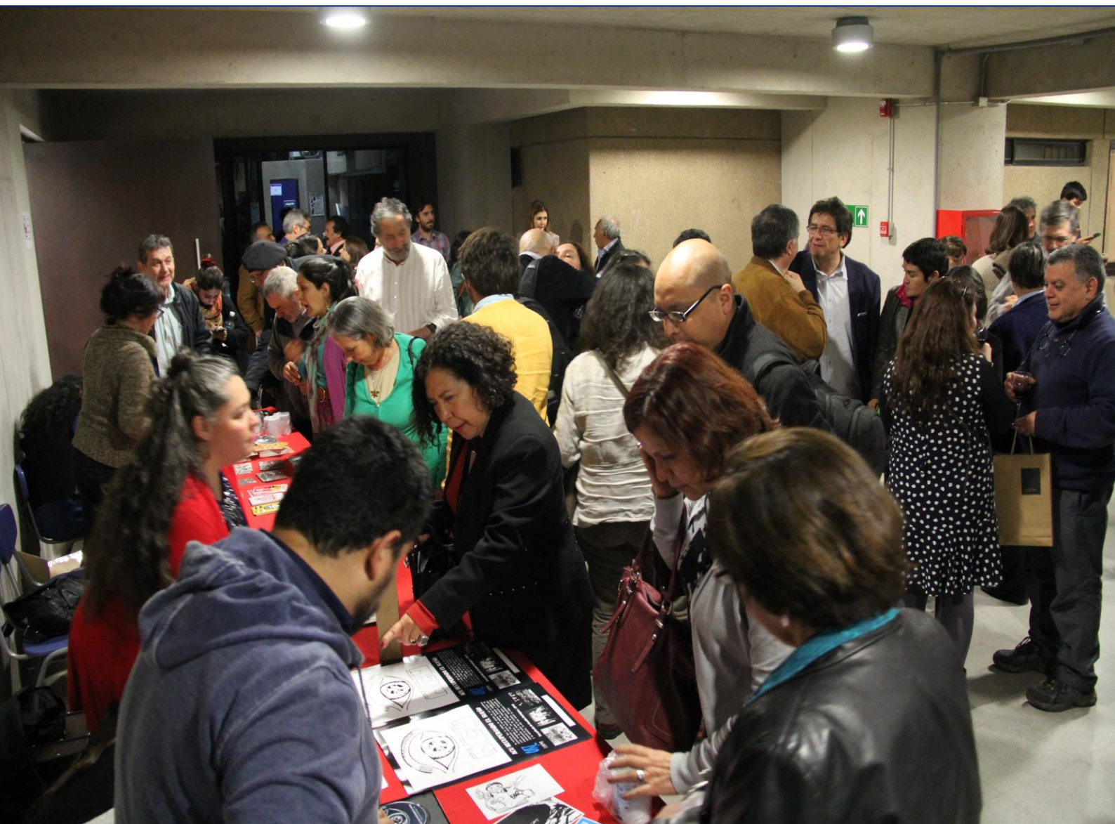
Lanzamiento del Documental "ACU: Recuperando el sueño".