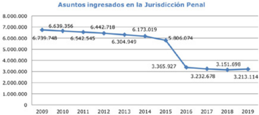
FIGURA 2. Asuntos ingresados en la jurisdicción penal.