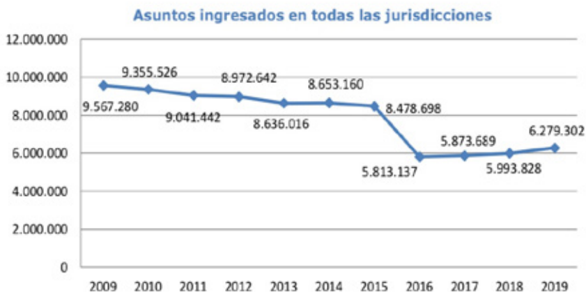
FIGURA 1. Asuntos ingresados en todas las jurisdicciones desde el 2009.

descendente pareciera ralentizarse, contemplándose un leve aumento al menos hasta las cifras del año 2019.