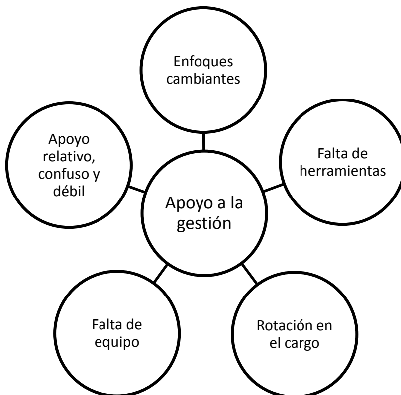
Figura N° 5 Diagrama discursivo Apoyo a la gestión

Se hace evidente las diferencias en cuanto a la formación de las y los encargados/as de convivencia escolar, sobretodo en relación a la formación de otros actores del sistema educativo. Es fundamental para una gestión educativa exitosa, contar con las herramientas que faciliten la planificación e implementación de acciones en este ámbito. Este es una de los elementos que ha dificultado la validación del cargo; por una parte las y los encargados/as sienten que no han vivido procesos de capacitación que les permita el desarrollo de competencias necesarias para la gestión en convivencia, y por otro, este mismo hecho a debilitado su relación con las comunidades educativas, complejizando aún más su aparición en el sistema educativo.