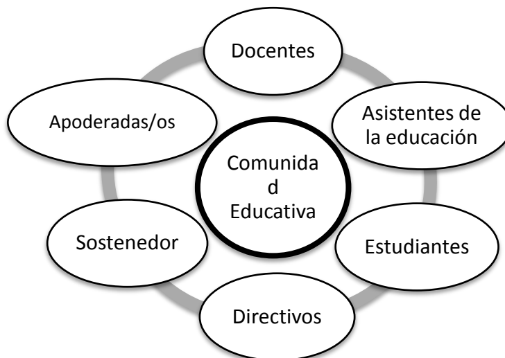
Figura N° 1 Actores Educativos

Sin embargo, es frecuente que el “sostenedor” tenga una presencia relativa en la cotidianeidad de los establecimientos educacionales, o cuando la tiene, desarrolla relaciones sociales determinadas por su rol dentro de la institucionalidad.