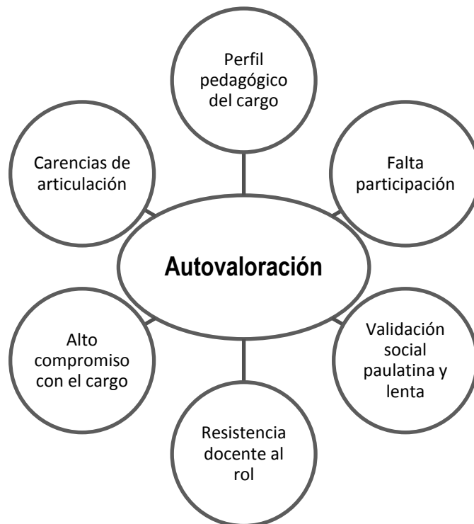
Figura N° 6 Diagrama discursivo Autovaloración