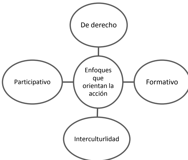
Figura N° 8 Diagrama discursivo Enfoques que orientan la acción