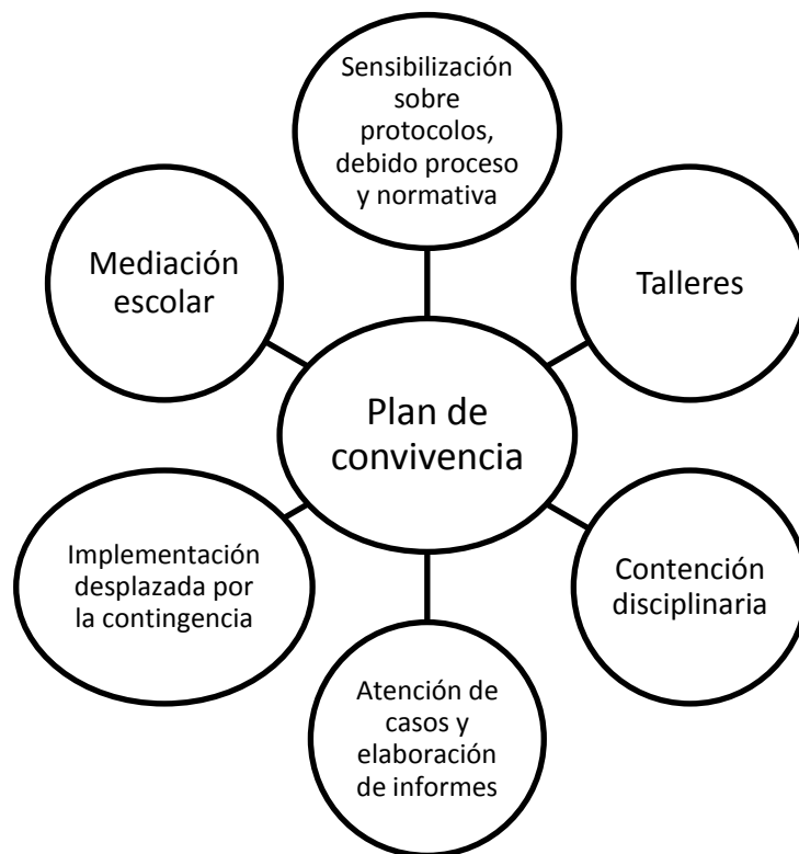
Figura N° 7 Diagrama discursivo Plan de convivencia