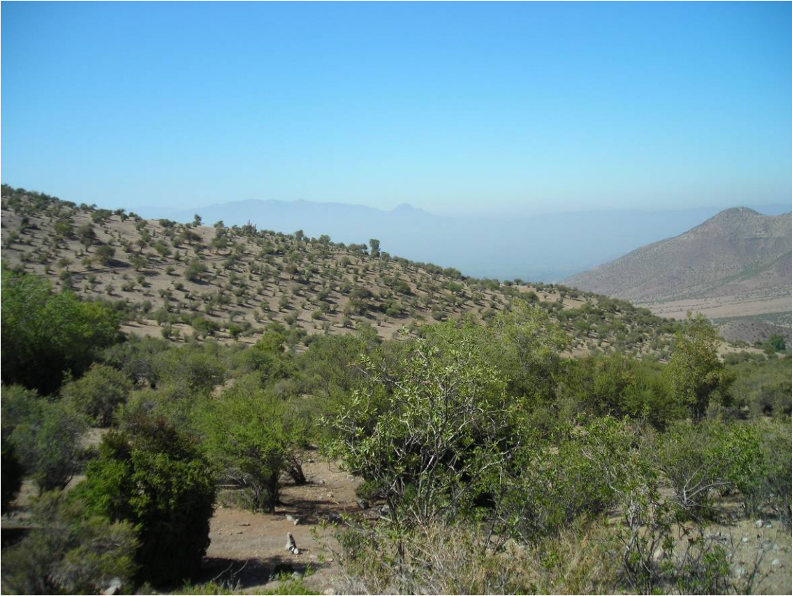
Ilustración 1 : Vista desde los campos comunes de la comunidad de campo Jahuel