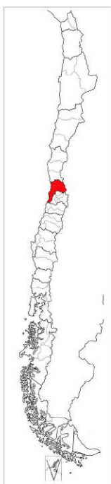
MAPA DE CHILE Región de Valparaíso.