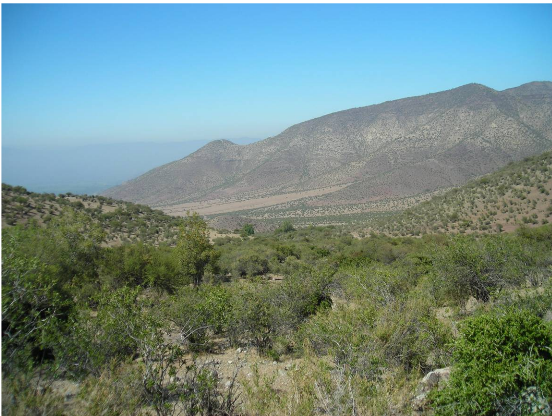
Ilustración 2: vegetación predominante de los campos comunes de la comunidad de campo Jahuel

sus terrenos se encuentran vegas y la Laguna del Copín, que se ubica a una altura aproximada de 2.000 metros sobre el nivel del mar.