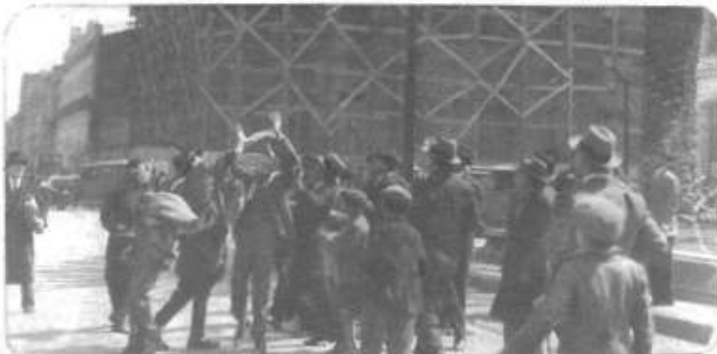
Las proclamas lanzadas por los aviones son arrebatadas por la multitud.