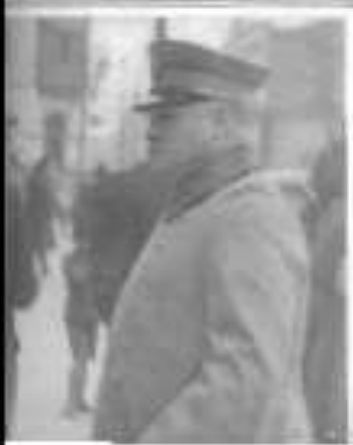
El señor Alessandri en visita a El Suroeste de un hecho decisivo en sus gestiones al efecto de liberar la provincia de Chile. La compañía el jefe de las fuerzas revolucionarias.