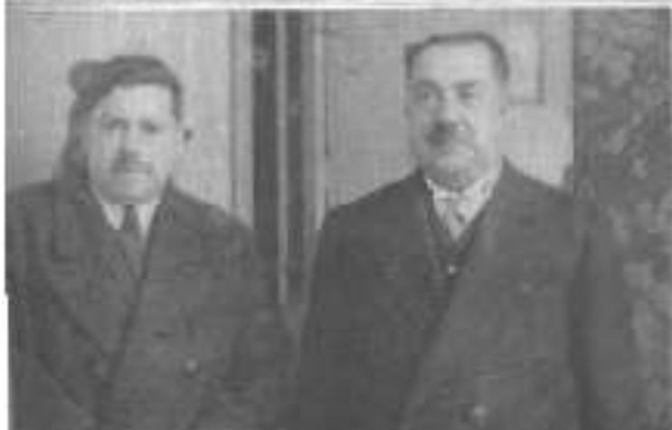
El Ministro de Fomento, don Vi- ctor Mazarón.