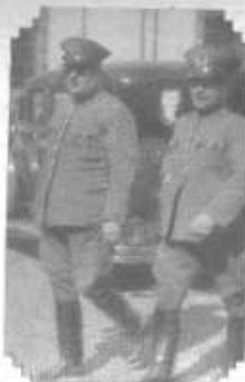
El general de carabineros señor Arriagada concurre al Ministerio de Guerra para asistir a la reunión de comandantes.