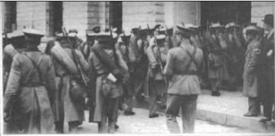
Como el Coronel Graue estuviera dispuesto a no acceder a las peticiones de los revolucionarios, se hizo, poco a poco, efectiva la orden de rodear, cada vez más, la Moneda con tropas. Instantánea que muestra a compañías su pie de guerra de la Escuela de Aplicación de Infantería de San Bernardo, entrando a reforzar las que ya había en el Ministerio de Defensa, desde temprano.