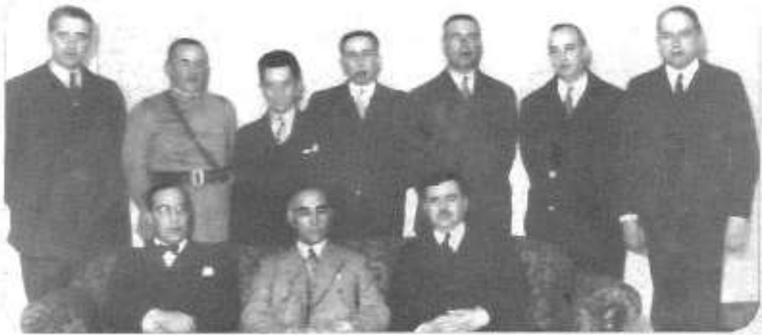
El Presidente Provisional, señor Bartolomé Blanche, rodeado del Ministerio, organizado en las últimas horas de la tarde del miércoles 14 y compuesto por los siguientes señores: Interior, don Ernesto Barros Jarpa; Relaciones Exteriores, don Luis Barriga Errázuriz; Hacienda, don Francisco Mardones; Justicia, don J. Antonio Ríos; Guerra y Aviación, general Luis Otero; Marina, contraalmirante don José Manuel Montalva; Educación, don L. David Cruz Ocampo; Fomento, don Gustavo Lira; Trabajo, don Fidel Estay; Tierras, don Virgilio Morales.