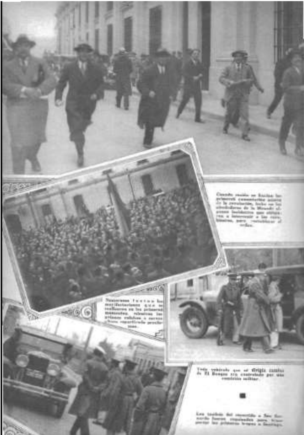
Cuando recibe en Bucarias los primeros comentarios acerca de la revolución, huye en los alrededores de la ciudad al punto de encuentro que eligió para a internarse a las montañas, pero -reintegrarse al orden.