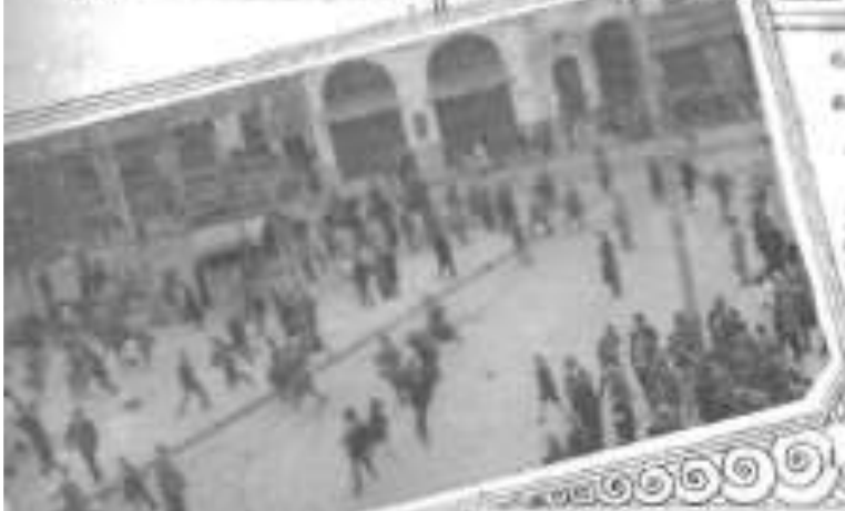
Al comenzar la revuelta se incendiaron varias banderas distribuidas de Buenos Aires, varias particularmente, recordadas por los revolucionarios, incendiadas que se consumieron en las banderas.