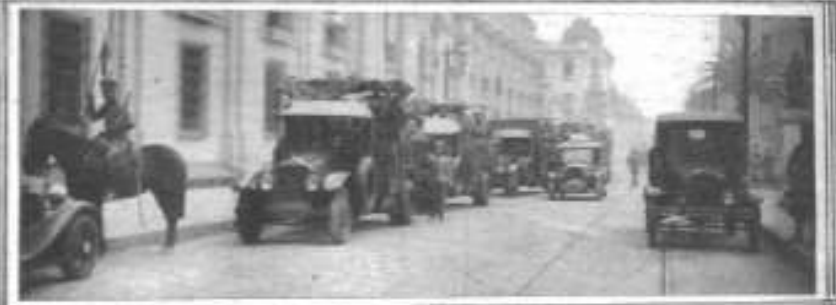
El Regimiento de Infantería "Buin", fue uno de los cuerpos de línea que ocupó el Ministerio de Guerra, en las últimas horas de la tarde del jueves. Utilizó para su viaje a la plaza de la Moneda, estos también.