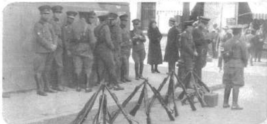
Frente a "El Mercurio", los carabineros impiden la salida de "Las Últimas Noticias".