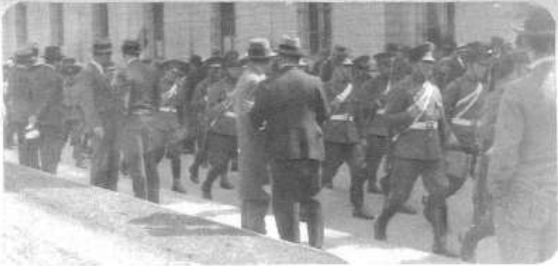
Tropa de carabineros Dega a reforzar la guardia de la Moneda, en la mañana del martes.