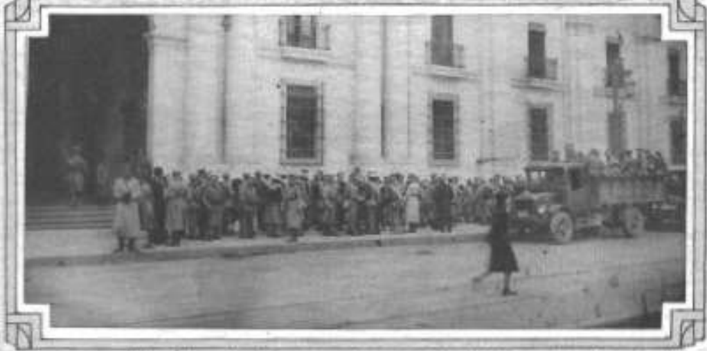
El panorama político había cambiado completamente en la mañana del viernes antepasado, y el público rodeó la Moneda para conocer detalles. Guardia de infantería que vigiló el Palacio hasta el relevo del mediodía.