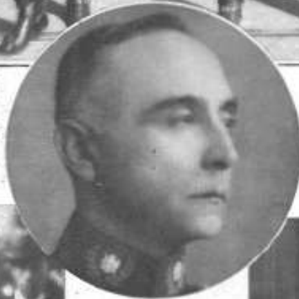
General Bartolomé Blanche que, por acuerdo de los representantes de las fuerzas armadas, quedó designado para reemplazar al señor Dávila en el Gobierno Provisional.