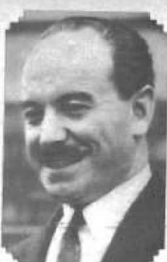
Señor Carlos Dávila, que hubo de renunciar a la Presidencia Provisional de la República.