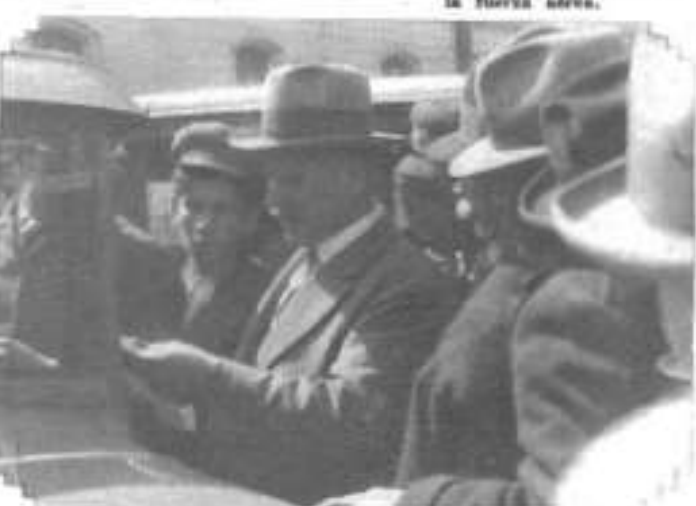
En la tarde del martes, los aviones dejan caer sobre la ciudad numerosas proclamas que son debidamente recibidas por el público.