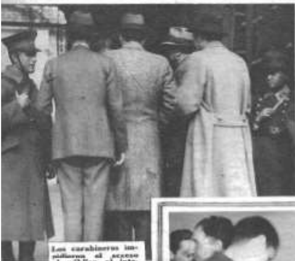
Los carabineros impidieron el acceso al público al interior del Palacio de Gobierno, en las primeras horas de los acontecimientos que culminaron con la caída de la Junta del 4 de junio; pero, horas más tarde, el coronel Arrigada ordenó al retiro de las tropas, que habían acudido.