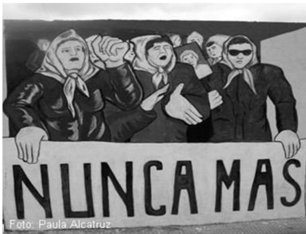
Imagen 71: Mural en barrio La Boca, Buenos Aires