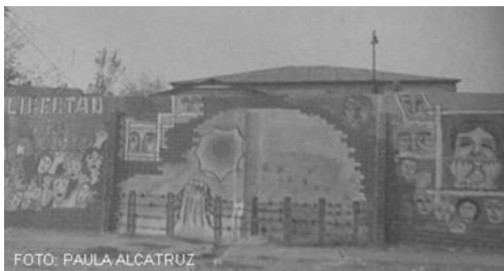
Imagen 25: mural Libertad a los presos políticos, Santiago (BEC)

En la actualidad al observar con detención las calles de Buenos Aires y Santiago se pueden observar distintos tipos de murales, aquellos que tienen una visión más decorativa, que buscan llenar con color las calles de la ciudad, aquellos que agrupan a un estilo cultural o moda generacional, murales que invitan a recoger símbolos urbanos que confrontan la identidad del barrio o su entorno más cercano, hasta aquellos que involucran temáticas de cuestionamiento al sistema o de denuncia a una situación específica.