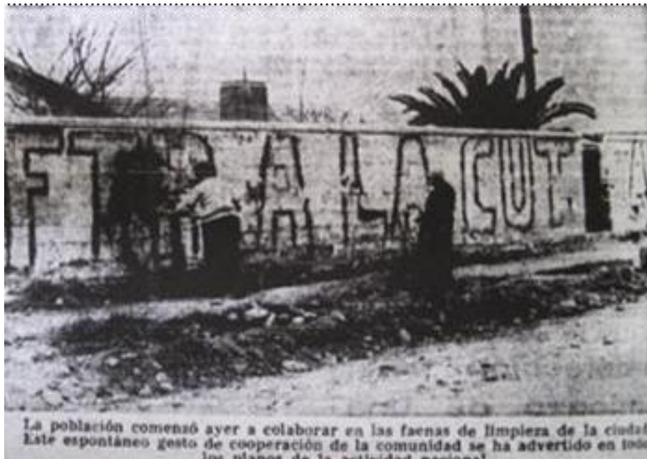
Imagen 20: Eliminación de murales tras el golpe de Estado en Chile, El Mercurio, 1973.

Por su parte en Argentina los murales adquirieron una fuerza inusitada; de acuerdo a Emilio Peterson la sucesión de golpes de gobierno trajeron consigo la creación de murales clandestinos, así señala “La etapa dictatorial de 1970 al 73 resultó emblemática por la creciente presencia de reclamos populares desde las paredes.” 92 De igual modo los murales cada vez serían más radicales ante el recrudecimiento de la represión del último gobierno militar, el que se diferenciaba de los golpes anteriores por la institucionalización de un sistema de represión contra la oposición política, basado en secuestros, detenciones,