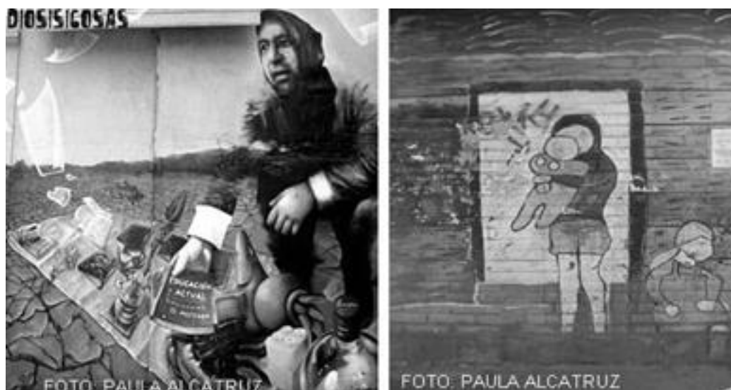
Imagen 1 y 2: ejemplos de murales decorativos el primero se encontraba ubicado en San Martín con Alameda en Santiago, el segundo en Buenos Aires

Así también Juan Carlos Castagnino expuso que el mural como arte de acción se establece como una posibilidad para superar el divorcio entre la pintura y lo público con un sentido realizador de carácter artesanal, pero enfrentado a la colectividad; presentando por ello una ruptura entre el criterio y la norma convencional del arte por el arte. De igual forma Demetrio Urruchúa sentencia “en el muro el artista no puede guardar silencio. Está obligado a exponer su concepción de las cosas; de lo contrario corre el peligro de caer en una pintura puramente decorativa, ornamental o informativa.” 13