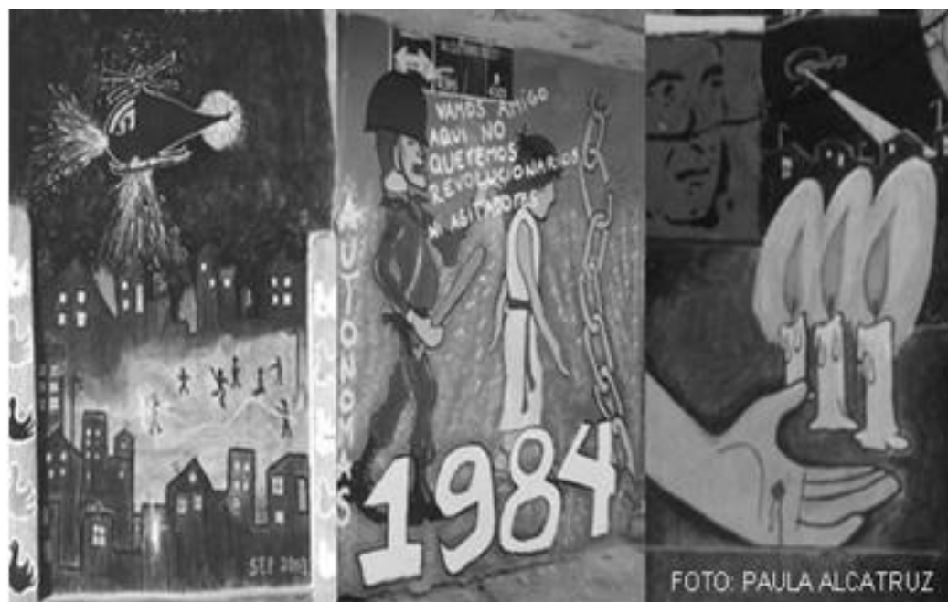
Imagen 55: detalle murales, La Victoria, 2002, 2003 y 2004.

Los murales anteriores fueron creados entre el 2002 y el 2004 y nos revelan el tema del allanamiento en la población, la figura del helicóptero da cuenta de la represión en las casas por militares y carabineros, pero también de la lucha de parte de la población. Manuel expone que su suerte fue la de cualquiera que vivía en la población en ese tiempo puesto que nadie estaba seguro: “en cualquier momento podían llegar a tu casa, allanarte y hasta matarte sin siquiera tener una razón”. 153 pensamiento que comparte con Liliana “nosotros no somos políticos, somos gente de trabajo, gente que se ha esforzado por tener lo que tenemos, me entendí, pero la gente que luchó por todo esto (la represión) yo también converse con ellos, ellos luchaban por la tranquilidad de la población, muchos cabros murieron de esta cuadra, chiquillos que yo conocía murieron y fue muy doloroso porque lo primero era que llegaban (los militares) aquí con tanquetas, micros y zorrillo y disparaban, disparaban y disparaban.” 154