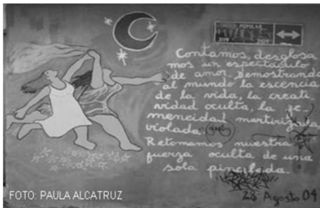
Imagen 34: Pincelada, La Victoria, Chile 2004.

En sus intervenciones se deja al descubierto a los agresores, se informa de diversos talleres de apoyo psicológico, emocional y jurídico, se da cuenta de algunas de las actividades nacionales como las marchas del día de la mujer. Siendo su interés fundamental el intentar dejar un mensaje de sensibilización con el objeto de fortalecer las relaciones de igualdad entre hombres y mujeres; tal como se expresa la imagen 35 el mural El árbol creado por el Colectivo arte para La Victoria . En dicho mural cada hoja representa