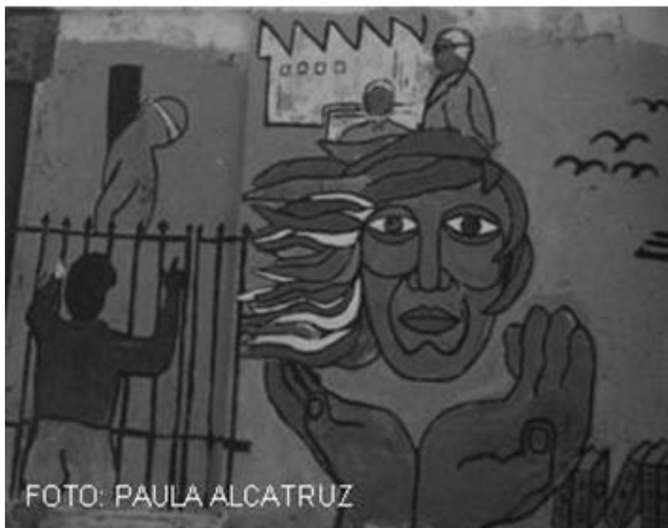
Imagen 60: torturas y detenciones en Chile y Argentina