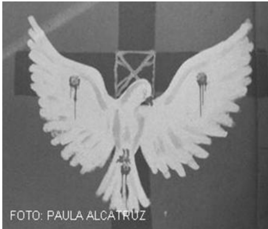
Imagen 59: Mural simbólico de la Dictadura en Chile y Argentina

Por medio de la convocatoria de una imagen los transeúntes–espectadores sacan a relucir sus historias y recuerdos, aquellos que si bien fueron sentenciados al olvido en la historiografía tradicional, forman parte de las grandes vivencias de la población común que vivió y creció en dictadura y que hoy recuerdan a las generaciones más jóvenes una parte de la historia que se niega a ser olvidada.