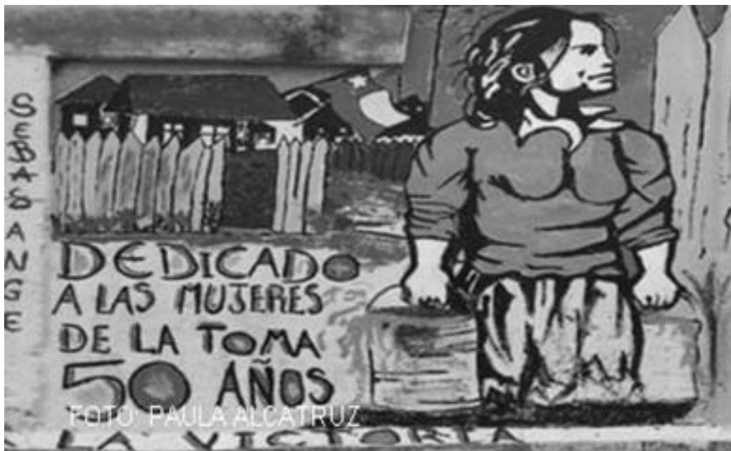
Imagen 41: La Victoria, La Victoria 2007