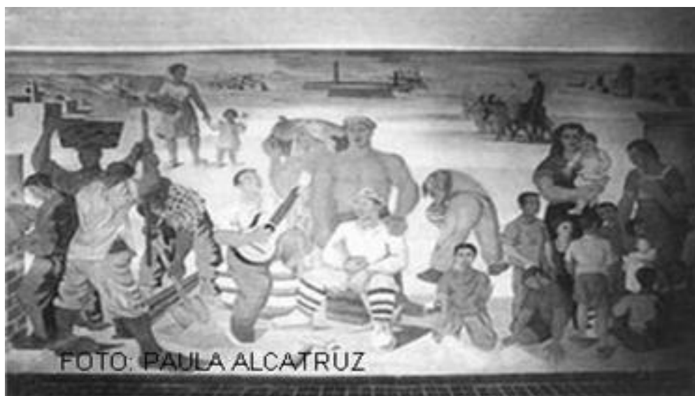
Imagen 15: Homenaje a Gabriela Mistral y los trabajadores el salitre, mural metro Ciudad del Niño, Santiago 1946.

El mural social acoge el devenir de las clases trabajadoras y sus demandas las que adquieren mayor brío con el paso del tiempo. El mural pasa a ser entonces una representación de ellos, su acontecer y desafíos, que si bien será interpretada por todos, sólo será dibujada por un grupo de artistas formales respaldados por las academias, quienes interpretan plásticamente un mundo que no les pertenece. Esto no tardaría en cambiar.