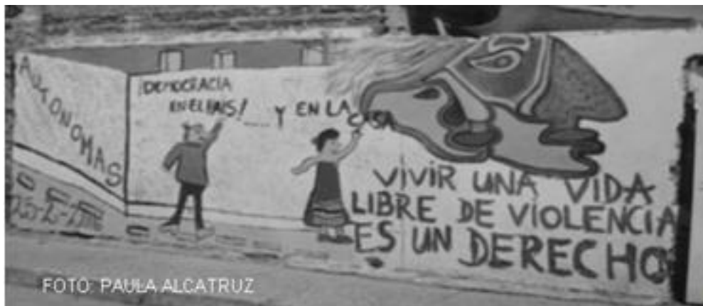
Imagen 32: Vivir, La Victoria, Chile 2006.

Uno de los principales problemas de la población La Victoria refiere al fenómeno de la violencia contra las mujeres que es multidimensional y por tanto debe ser abordado por el conjunto de la comunidad. Entre los métodos de prevención de la violencia de género se enmarca la necesidad de generar asociatividad por lo que se necesita de distintas estrategias para la prevención y erradicación de este grave flagelo, así es de vital importancia la creación de diversas intervenciones comunitarias que tengan impacto local y en lo posible comunal. Es ahí donde los murales de las brigadas Autónomas de La Victoria y La Kuneta adquieren fuerza.