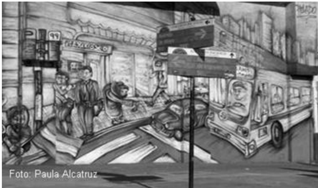
Imagen 27: mural de Alfredo Segatori, Buenos Aires 2001.

Sea cual sea su temática, sus medios de financiamiento y ejecución se debe tener en cuenta, que los murales callejeros responden a una necesidad social y política y que si bien su intencionalidad puede ser específica lo que importa es cómo el mural pasa a ser una herramienta de empoderamiento de la sociedad civil para poder expresarse como un medio alternativo de comunicación, enfrentando y dialogando en la cotidianidad.