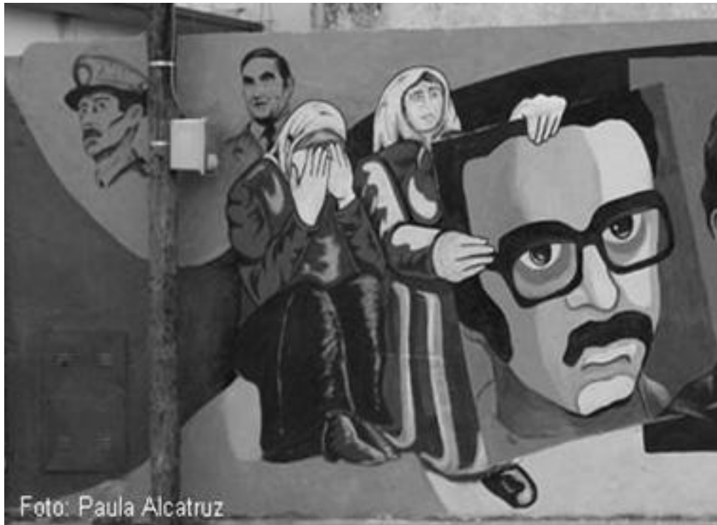
Imagen 70: Madres Plaza de Mayo, Buenos Aires