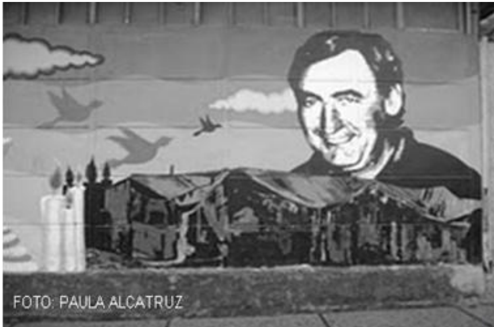
Imagen 66: Mural André Jarlán, 2009

permanece como una marca de agua al igual que la de los niños de la velatón dejando en el aire la posibilidad de la huella que persiste tras el intento de borradura.