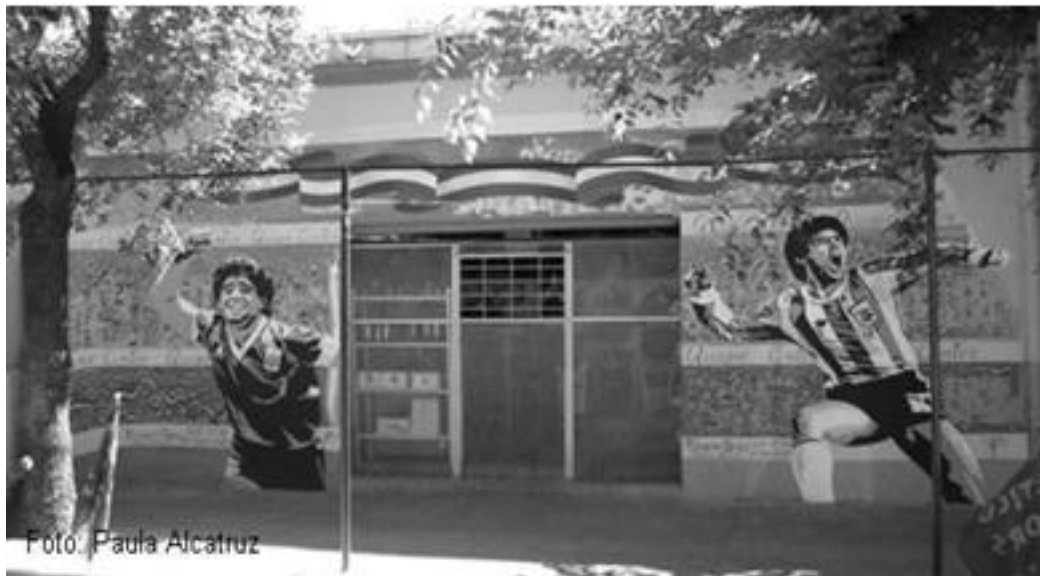
Imagen 48: Mural Boca Juniors

La devoción por el equipo en las calles se manifiesta claramente en los murales propios del Boca como también en los murales generales de la identidad barrial, ya que siempre aparece la imagen de un jugador o de un hincha como el símbolo claro de la identidad local. “Tenés que tener en cuenta que los de River y Boca nacieron acá en el barrio, ellos los del River se fueron a la zona norte que era una zona baldía, pantanosa, que con el desarrollo urbanístico se transformo en una zona súper paqueta, paquetísima donde viven todos los