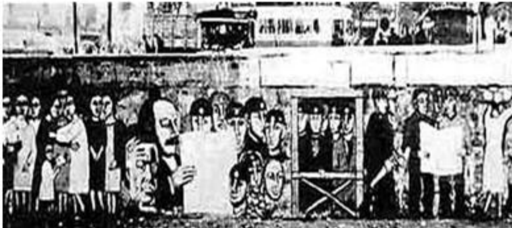
Imagen 16: mural realizado en el río Mapocho en 1964.

Ya en el gobierno de la Unidad Popular en Chile los murales aumentaron en manos de diversas brigadas que hicieron de este arte un medio de expresión popular, con un carácter colectivo, social y público, llenando de color las calles de la ciudad. 86 Una muestra del apogeo del mural es El primer gol del pueblo chileno , creado en conjunto entre la brigada Ramona Parra y el artista Roberto Matta que refleja, mediante un partido de fútbol, la polarización política del país en aquel tiempo, donde la alusión al gol es la representación del triunfo electoral de la izquierda. 87 Su creación fue el encuentro de dos mundos del arte; el consagrado de los museos y galerías y el arte social más cercano al habitante de la urbe. Pero fue también una marca fundante de la estrecha relación del mural y la memoria de aquellos que vieron, sintieron y vivieron la violencia durante el transcurso de la dictadura.