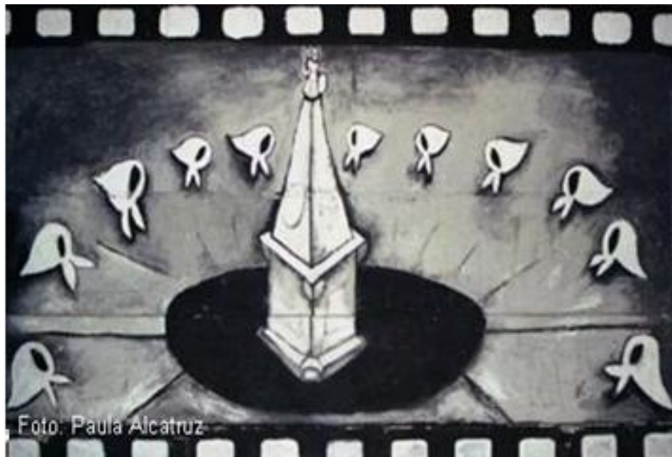
Imagen 67: Madres Plaza de Mayo, Buenos Aires

Tras las primeras detenciones políticas, los familiares de las víctimas comenzaron a movilizarse denunciando sus casos a la Iglesia, la policía, los partidos políticos y todo aquel que pudiera tener alguna información sobre sus detenidos. Las detenciones comenzaron a convertirse en desapariciones que aumentaban con el paso del tiempo, permitiendo la formación de organismos de denuncia, las que de una u otra manera terminaban en la indiferencia de la burocracia y la amenaza militar. Ante el desconocimiento del paradero de sus familiares y la censura de los medios que impedía dar cuenta libremente de su denuncia, los familiares recorrían todos aquellos lugares en los que posiblemente podrían encontrar información, siendo constantemente perseguidos y amenazados.