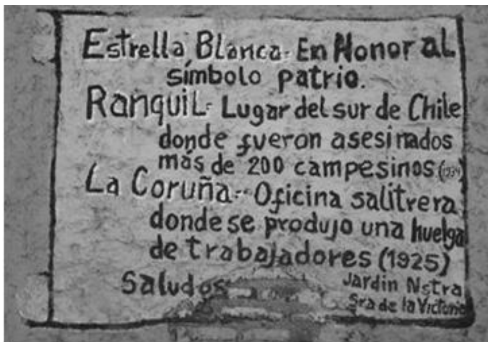
Imagen 29: mural, La Victoria, Santiago año (?).