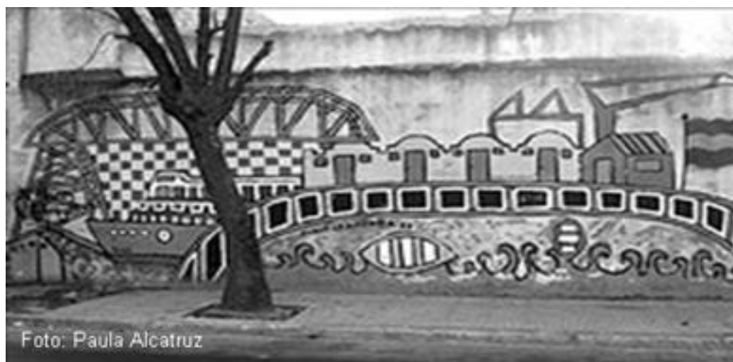
Imagen 46:barrio La Boca, sin datación

debe investigar, estudiar, crear y recrear la realidad histórica y social, empleando imágenes y símbolos accesibles al público, al hombre de la calle. Pensando en los demás, en los otros a los que está destinado su mensaje.”