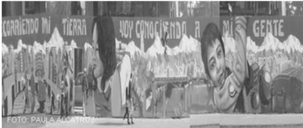
Imagen 26: Parte del mural Recorriendo mi tierra voy conociendo a mi gente, ubicado frente al Centro Cultural Gabriela Mistral, Santiago 2009.

Sea cual sea su temática, sus medios de financiamiento y ejecución se debe tener en cuenta, que los murales callejeros responden a una necesidad social y política y que si bien su intencionalidad puede ser específica lo que importa es cómo el mural pasa a ser una herramienta de empoderamiento de la sociedad civil para poder expresarse como un medio alternativo de comunicación, enfrentando y dialogando en la cotidianidad.