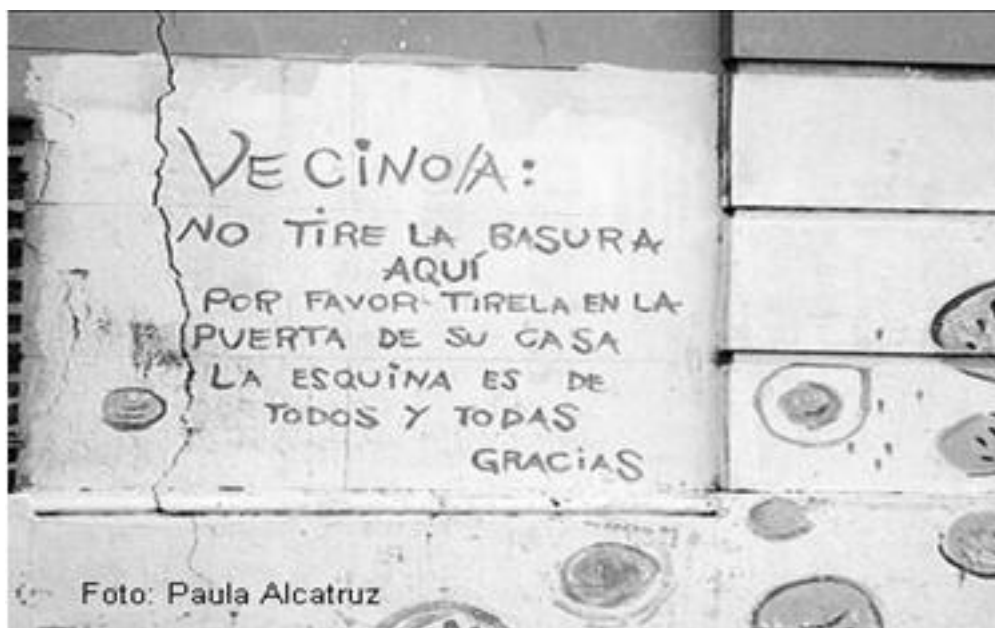
Imagen 30: Mural barrio La Boca, ciudad de Buenos Aires, 2007.