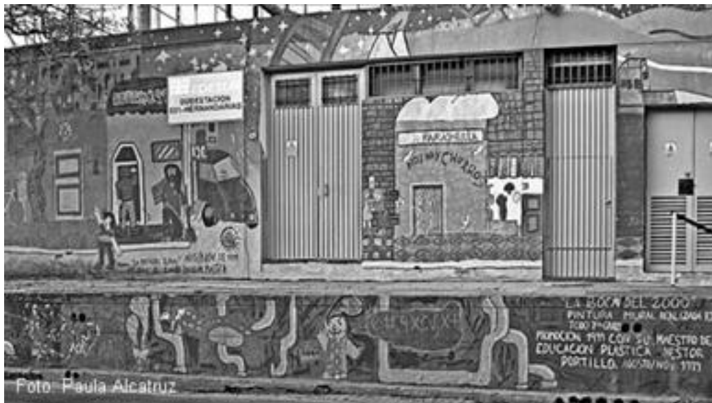
Imagen 45:barrioLa Boca del 2000, pintura realizada en 1999

A diferencia del mural escenográfico, el mural de Trizkelion es más realista, ya que lejos de demostrar una visión retocada del barrio para el turista, este solo tiene el fin de enseñar una escena cotidiana de todo barrio reflejando los juegos infantiles, las familias conversando o leyendo en las calles, mientras cuidan a los niños en su juego de pelota, y la imagen infaltable del aficionado al club de fútbol de la zona.