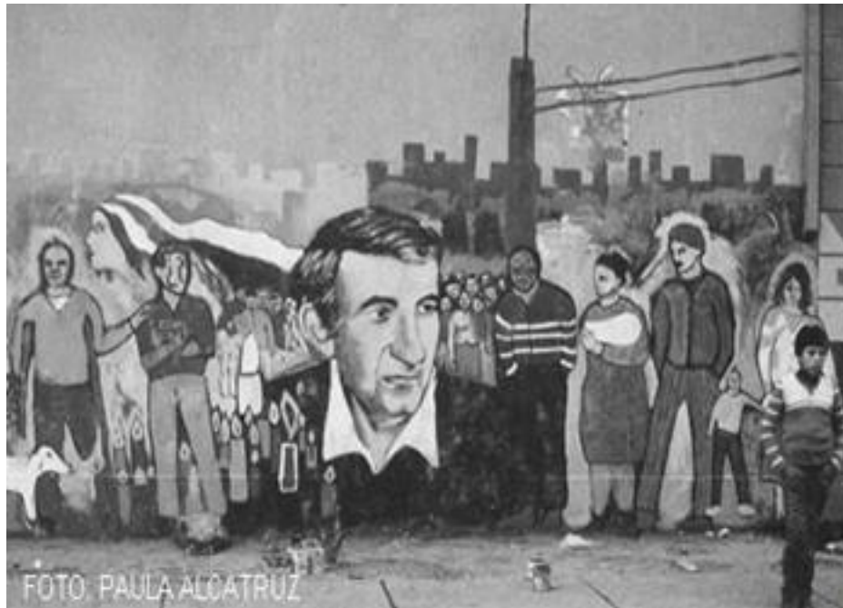
Imagen 77: mural en homenaje a André en Ranquil con 30 de octubre. (1984)