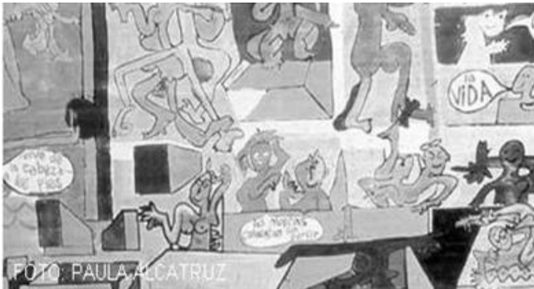
Imagen 17: El primer gol del pueblo chileno 1971, ubicado en la piscina municipal de la comuna de La Granja

Ya en el gobierno de la Unidad Popular en Chile los murales aumentaron en manos de diversas brigadas que hicieron de este arte un medio de expresión popular, con un carácter colectivo, social y público, llenando de color las calles de la ciudad. 86 Una muestra del apogeo del mural es El primer gol del pueblo chileno , creado en conjunto entre la brigada Ramona Parra y el artista Roberto Matta que refleja, mediante un partido de fútbol, la polarización política del país en aquel tiempo, donde la alusión al gol es la representación del triunfo electoral de la izquierda. 87 Su creación fue el encuentro de dos mundos del arte; el consagrado de los museos y galerías y el arte social más cercano al habitante de la urbe. Pero fue también una marca fundante de la estrecha relación del mural y la memoria de aquellos que vieron, sintieron y vivieron la violencia durante el transcurso de la dictadura.