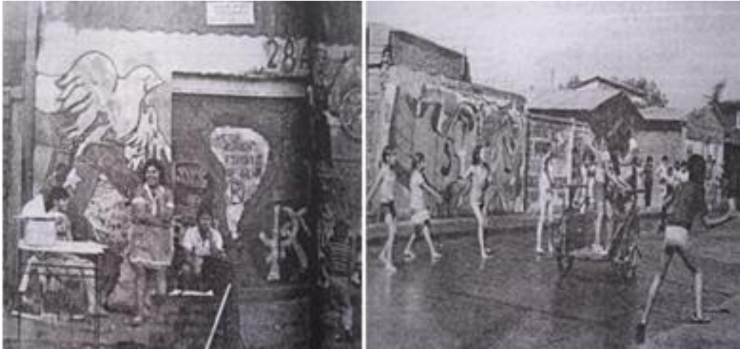
Imagen 21 y 22: murales población La Victoria, Apsi, octubre 1986.

Las brigadas por medio de talleres populares enseñaban sin costo el arte mural popular a jóvenes de comunidades cristianas, mujeres y participantes de organizaciones sociales de cuadras y poblaciones. Ejemplo de ello fueron los murales realizados por el taller La Caleta creada a fines de 1986, con el objetivo de apoyar visualmente a diversas organizaciones sociales aportando a la expresividad y creatividad popular. “Realizamos capacitaciones a miembros de organizaciones en las cuales se entregan herramientas técnicas y una metodología que promueva la participación sobre la realidad de los participantes, sus vivencias y motivaciones.” 97