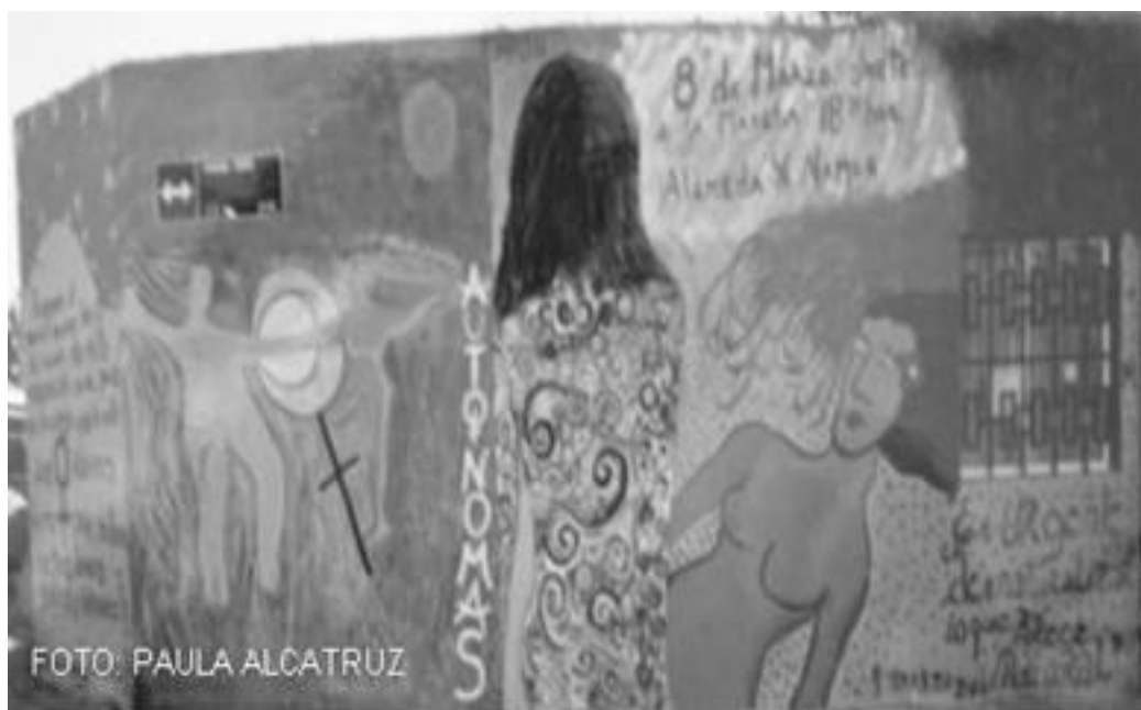
Imagen 36: 8 de marzo, La Victoria, Chile 2006.