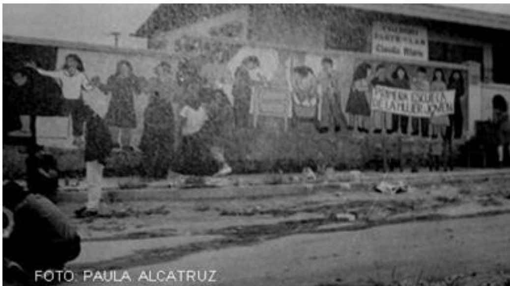
Imagen 23: mural Primera escuela de la mujer joven realizado por el Colectivo Peulla y el taller La Caleta 1989.

Las brigadas por medio de talleres populares enseñaban sin costo el arte mural popular a jóvenes de comunidades cristianas, mujeres y participantes de organizaciones sociales de cuadras y poblaciones. Ejemplo de ello fueron los murales realizados por el taller La Caleta creada a fines de 1986, con el objetivo de apoyar visualmente a diversas organizaciones sociales aportando a la expresividad y creatividad popular. “Realizamos capacitaciones a miembros de organizaciones en las cuales se entregan herramientas técnicas y una metodología que promueva la participación sobre la realidad de los participantes, sus vivencias y motivaciones.” 97