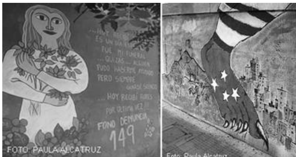
Imagen 11 y 12: Murales contemporáneos Denuncia Santiago y La Garra Buenos Aires

La violencia en los murales será abordada en los lugares de estudio en diversos tiempos y perspectivas, puesto que por medio de sus contenidos se observan transformaciones importantes de la realidad social local y nacional, entre el paso de las dictaduras a la democracia y por ende en quienes generan distintas formas de violencia. Como el caso de las agresiones de género, la económica o simbólica expresada en el mural de denuncia número 11 en el que se representa a una mujer con un ramo de flores y parte del poema hoy recibí flores con el objeto de motivar en las mujeres víctimas de maltrato la denuncia. 70