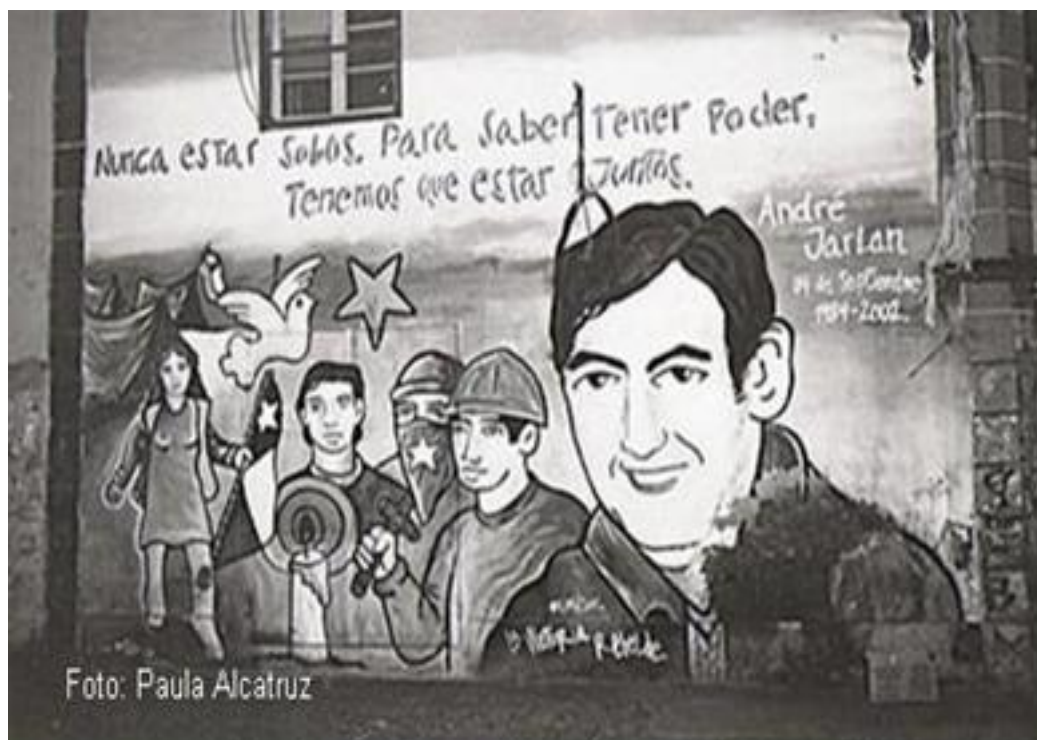
Imagen 83: mural Ranquil con treinta de octubre, año 2002.

Textos motivados por el nuevo espíritu propositivo de la población, como el levantamiento de las organizaciones sociales del sector y la necesidad de unidad para el futuro mejor. Situación que se fortalece con el mensaje del año 2007, año en que se cumple el aniversario número 50 de la población “nuestra lucha es cambiar esta realidad y no acomodarnos a ella”, haciendo alusión a la problemática del aumento de la drogadicción dentro de la población y las metas de organización en los cincuenta años de su creación.