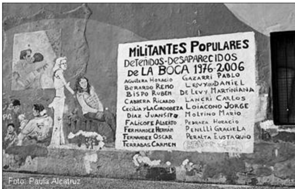
Imagen 73: Mural “Los desaparecidos de La Boca” en barrio La Boca, Buenos Aires