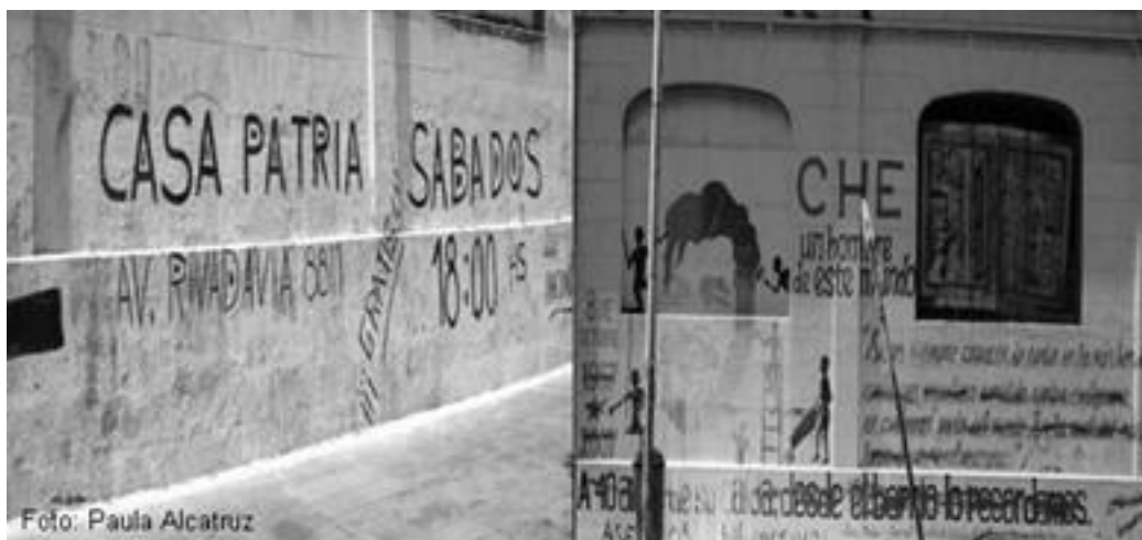
Imagen 7: murales borrados ex Olimpo hoy casa Martí, Buenos Aires Argentina.

Los otros murales fueron creados durante el año 2007, uno de ellos fue el mural realizado por la agrupación de artistas Víctor Jara en conmemoración de la muerte del Che Guevara; este mural fue blanqueado junto a otros murales realizados en El Olimpo por grupos de extrema derecha durante este año. 29 Habría sido entonces interesante el poder trabajar el tema de los murales de El Olimpo , sin embargo no se encontró mayor información virtual sobre la existencia de otros murales en el entorno, ante este impedimento y la inseguridad de contar con los recursos económicos necesarios para una visita posterior en terreno en Argentina se decidió dejar de lado esta opción.