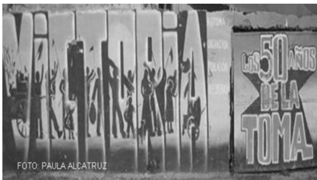
Imagen 42: La Victoria, La Victoria 2007

Las experiencias y recuerdos que convocan estos murales en sus espectadores son parte de distintas individualidades enmarcadas en una narrativa colectiva mayor, un código cultural que se mantiene en el tiempo tras cada semana de conmemoración fundacional en octubre, donde la memoria es prácticamente una reconstrucción reforzada en la ritualidad grupal más que un recuerdo pasivo. 120 Siendo también su mensaje replanteado mediante las necesidades actuales que la población requiera cubrir, tal como se expone en el mural 42 donde a la imagen de la toma se agrega en letras blancas la consigna del “retoma organizada población recuperada”. 121 Que es parte del discurso vigente de la población para recuperar el espacio público de la drogadicción y la delincuencia.