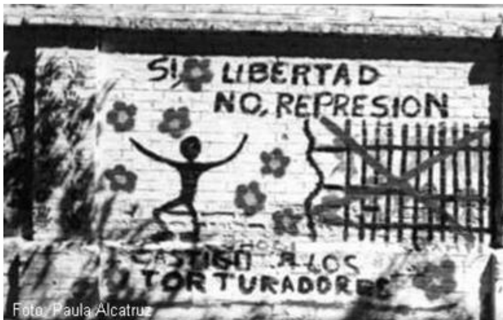
Imagen 24: Si libertad, No represión. Buenos Aires.

gobiernos democráticos o el sistema económico actual, son algunas de las temáticas que podemos observar libremente por las calles de la ciudad.