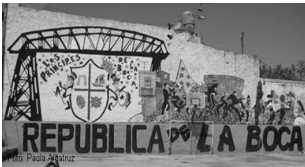
Imagen 49: Mural Boca Juniors en cancha publica de la zona turística

ladrones de la Argentina y Boca se quedo aquí, en el barrio y bueno, se consolido alrededor de Boca todo un imaginario, un mito que es más puesto por la gente que por Boca, porque Boca nunca tuvo una preocupación por el barrio en toda su historia. 133