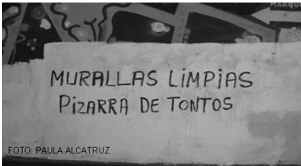
Imagen8: Mural Murallas limpias pizarra de tontos, Valparaíso 2010

guarda relación con el poder de la imaginación colectiva e imágenes compartidas. Esto es, la construcción de un imaginario social que tiene poder de condicionar o definitivamente transformar una realidad. 36 La cultura sería un mundo de significados, con discursos, prácticas y símbolos que mutan realidades, a partir de esto Chartier expone que si bien las ideas y mentalidades otorgan sentido a las prácticas, estas permiten determinar identidades. 37 Siendo entonces la producción simbólica parte de una composición mayor y compleja en la que se entrecruzan expresiones en medio de continuos debates, que apropian, resignifican transforman y reproducen imágenes conformando identidades individuales y colectivas. 38