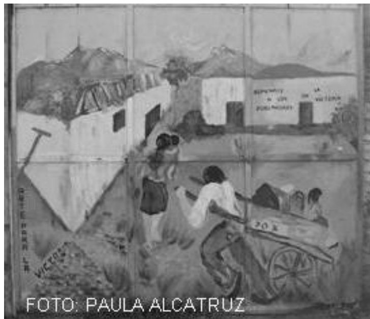
Imagen 38: colectivo Arte para la Victoria, Victoria 2009.