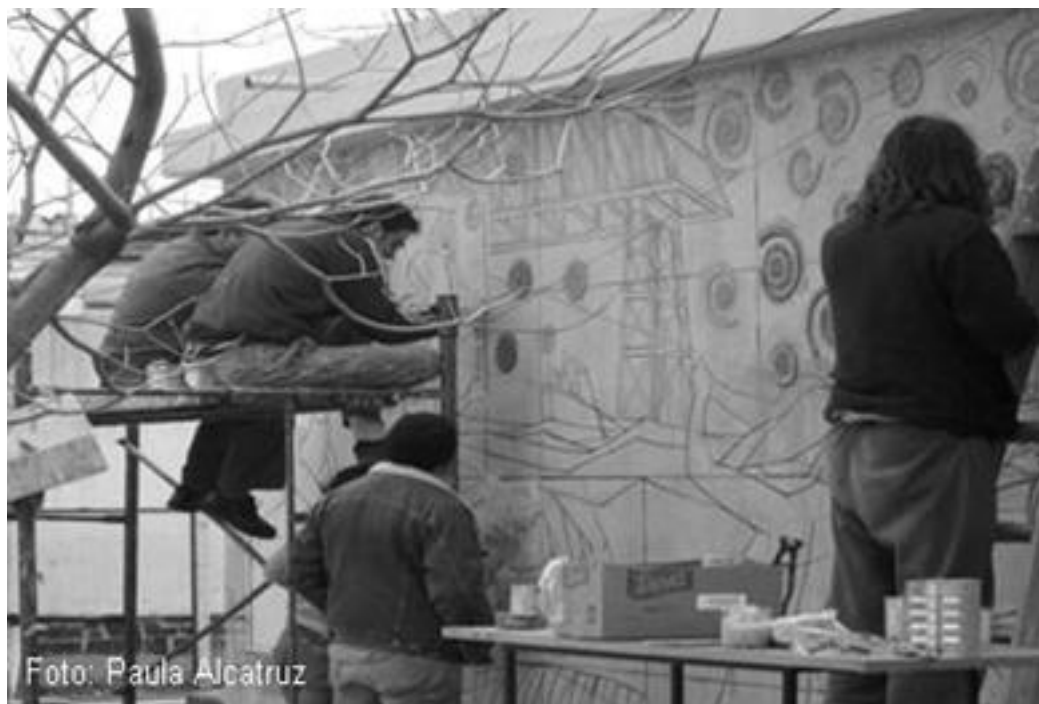
Imagen 50: taller mural contraluz, octubre 2010.

Ambas brigadas realizan trabajos pedagógicos orientados a la formación de nuevos integrantes, de igual forma en el desarrollo de los murales, los vecinos son invitados a participar en las creaciones como ejecutores no así como ideadores de los diseños o bocetos.