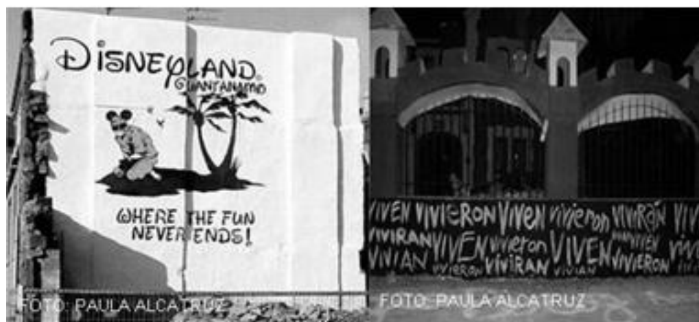
Imagen 3 y 4: Mural Disneyland Guantánamo (Cuba) y Mural Vive, vivieron vivirán (Chile).

Como observaremos en las siguientes imágenes, los murales tienen una activa función social, que va desde la elaboración de contradiscursos frente a políticas mundiales, a las luchas por la memoria del pasado reciente y colectivo. De la defensa de derechos humanos, al fortalecimiento de la historia local, la que a su vez, robustece la identidad de un sector social puntual, logrando de esta manera abarcar distintas temáticas.