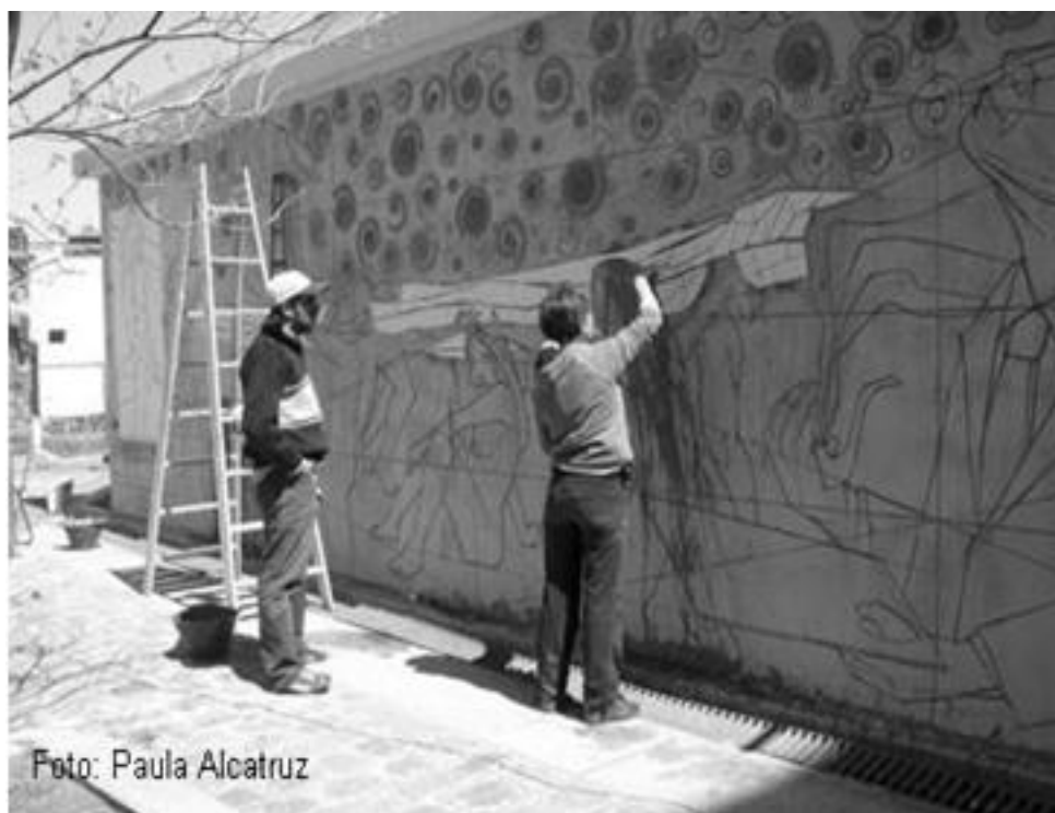
Imagen 51: taller mural contraluz, octubre 2010.

Las imágenes 50 y 51 son parte del Curso de Capacitación en Pintura Mural organizado por el profesor Néstor Portillo y la Fundación por La Boca dictado en el centro de Interpretación del Transbordador Nicolás Avellaneda. El curso práctico consiste en la creación de un mural de alrededor de 300 metros cuadrados, denominado La Boca a contraluz , y a diferencia del mural La Boca del 2000 sus realizadores serán alumnos y profesores de arte avanzado, de ahí que la técnica empleada sea también distinta. 136