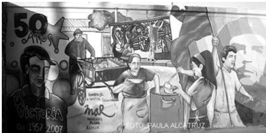
Imagen 6: Mural completo realizado en población La Victoria (Chile) durante la semana aniversario de la población octubre 2007. Sus creadores la brigada muralista acción rebelde.

Es probable también que este punto pueda cambiar en el tiempo ya que nuestra mirada se objetiviza en razón a los intereses del momento. Por tanto los murales barriales son más que una simple imagen pues cada mural barrial entrega distintas emociones y recuerdos que pueden diferir entre las personas que ven el mural a diario y quienes lo ven por primera vez, los que conviven con él mural y los que coinciden casualmente con él. Todo dependerá entonces de los códigos culturales existentes entre ellos también.