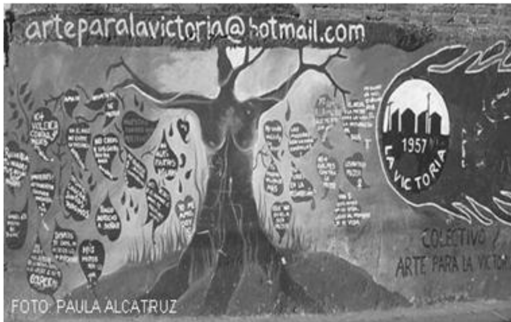
Imagen 35: El árbol, La Victoria, Chile 2008.

un derecho de la mujer, y un concepto que busca anular la sensación de vejación de las mujeres violentadas.