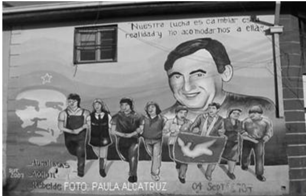
Imagen 85: mural Ranquil con treinta de octubre, año 2007.

Es por ello que significativamente aparece la población de frente al mural representada en estudiantes, abuelas, jóvenes y niños, esa imagen y la aparición de la bandera de paz, se revela como un símil de la procesión de la población con los restos de Jarlán a la Catedral de Santiago antes de su repatriación a Francia. La imagen del Ché Guevara guarda relación con la firma de la brigada muralista presentándose a partir del 2007 en los distintos murales de su creación.