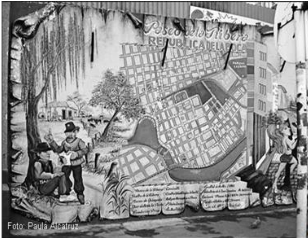
Imagen 28: mural Paseo La Ribera, Buenos Aires año 2006(?).

Así el mural barrial puede tener una connotación netamente informativa definida por ejemplo en clarificar el entorno o dar a conocer algo más particular como la razón del nombre de una calle a la comunidad, esto último sucede con uno de los murales de la población La Victoria en Santiago; en una esquina de uno de sus pasajes aparece un mural que busca entregar una explicación a la denominación del mismo. Este mural formó parte de una de las actividades realizadas hace más de diez años en la población con motivo de la conmemoración de la formación de la población.