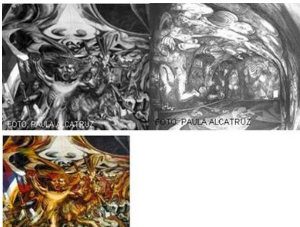
Imagen 13: Muerte al invasor Imagen 14: Ejercicio Plástico

David Alfaro Siqueiros viaja exiliado a Chile y Argentina, en esta última genera una proclama a los artistas bonaerenses en la cual expone la necesidad de abrir el mural al espacio cotidiano. “Vamos a sacar la producción pictórica y escultórica de los museos - cementerios- y de las manos privadas para hacer de ellas un elemento de máximo servicio público y un bien colectivo, útil para la cultura de las grandes masas populares”. 79 Contribuyendo con ello a la formación de muralistas nacionales, los que se encargarán de realizar diversas creaciones en edificios públicos, siempre abocados a temas de interés social, ejemplo de ello es Muerte al invasor en la Escuela México de Chillán en Chile realizado en 1942 y Ejercicio Plástico en Buenos Aires, Argentina en 1933. 80