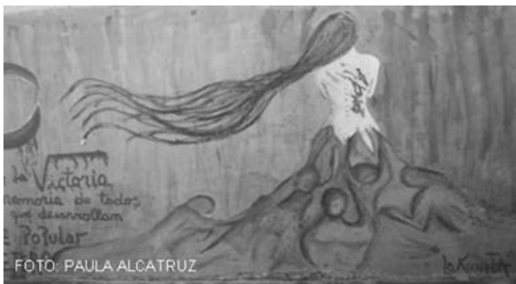
Imagen 33: No llores, La Victoria, Chile 2002.

trabajar y después cuando vuelve a su casa está nuestro arte reprochando su violencia”, tal como expone Roxana. 109