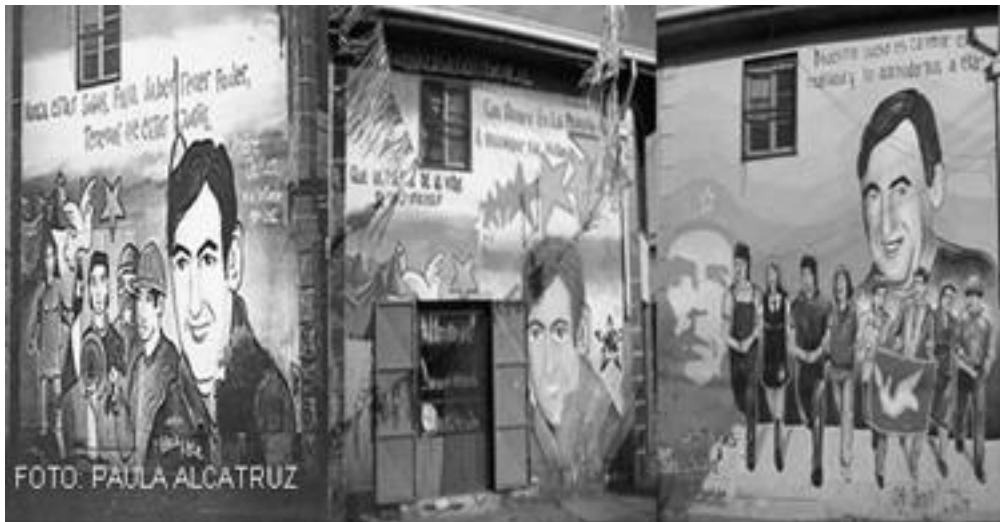
Imágenes 80,81 y 82: mural Ranquil años 2002, 2005 y 2007 respectivamente.