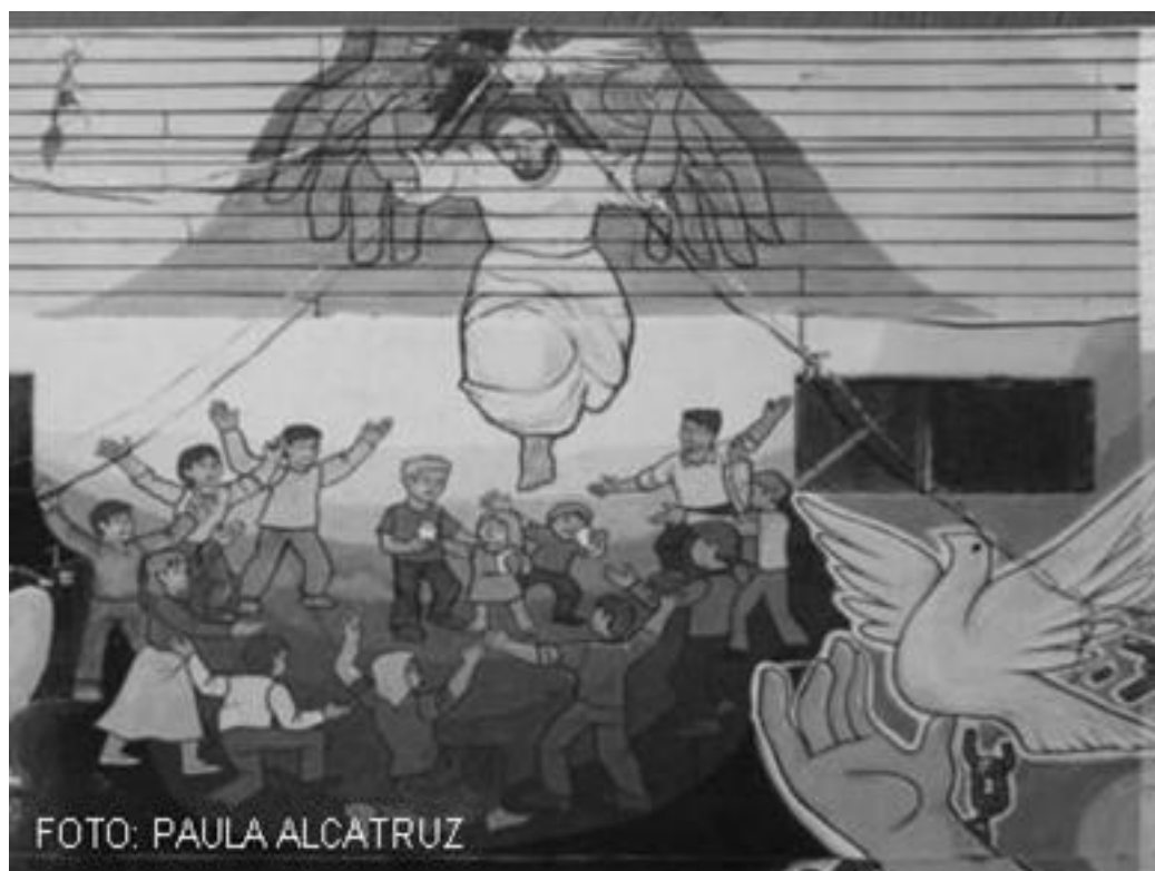
Imagen 58: Mural Vaso de leche. La Victoria