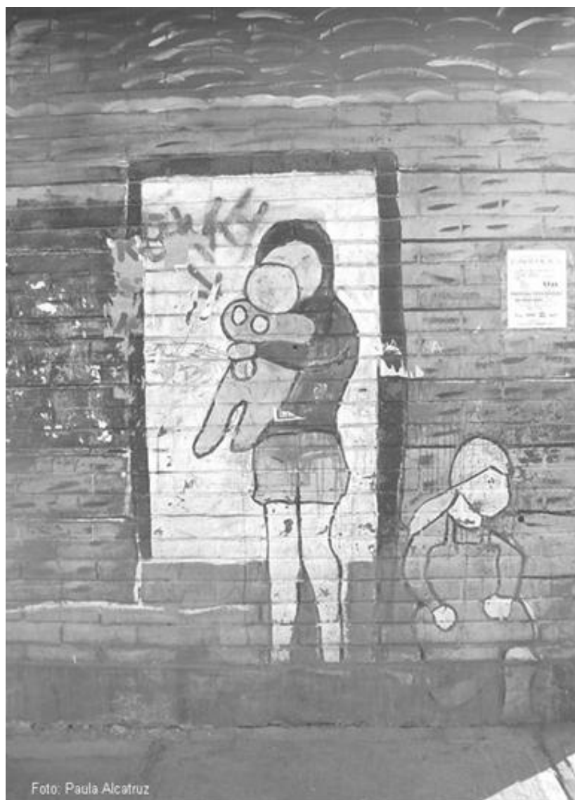
Población La Victoria, Santiago