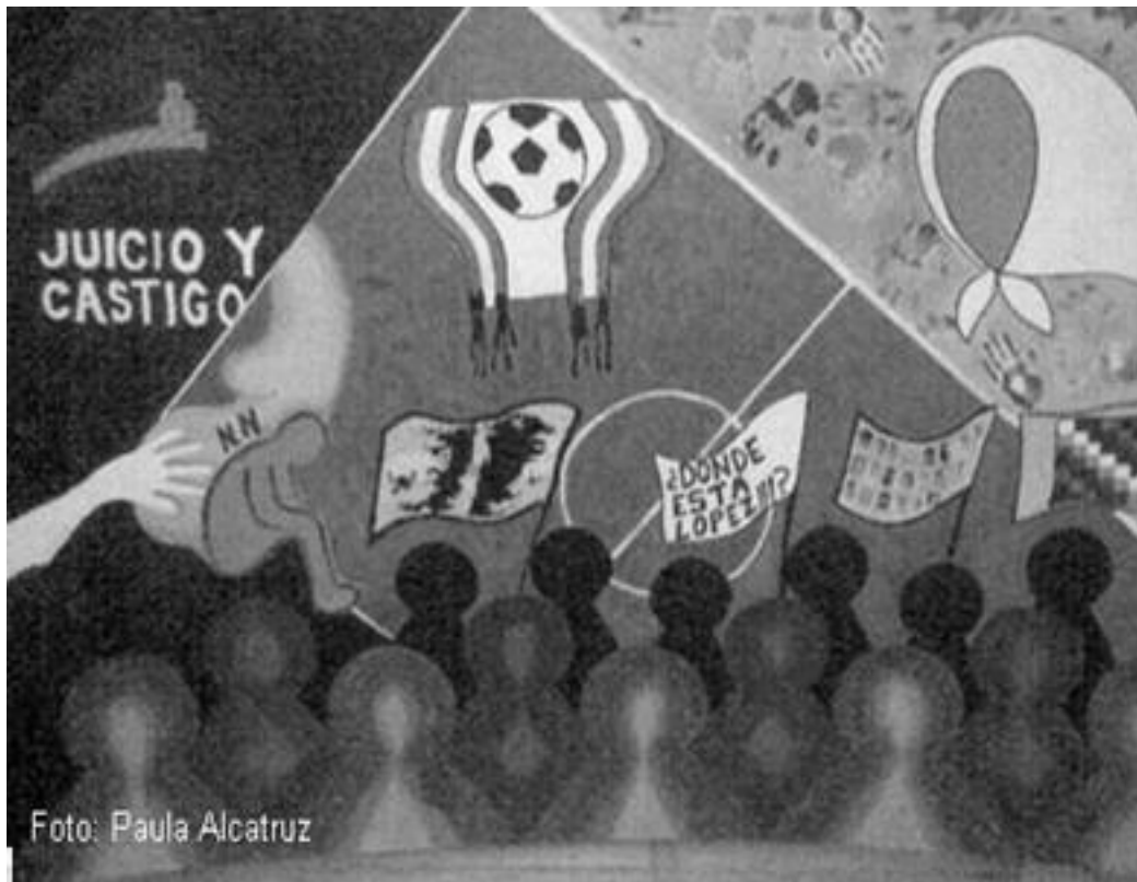
Imagen 54: mural Buenos Aires, Argentina 2006