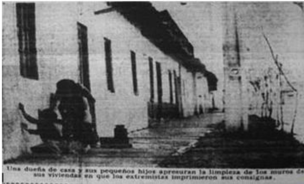
Imagen 19: Gente limpiando muros, El Mercurio 1973.