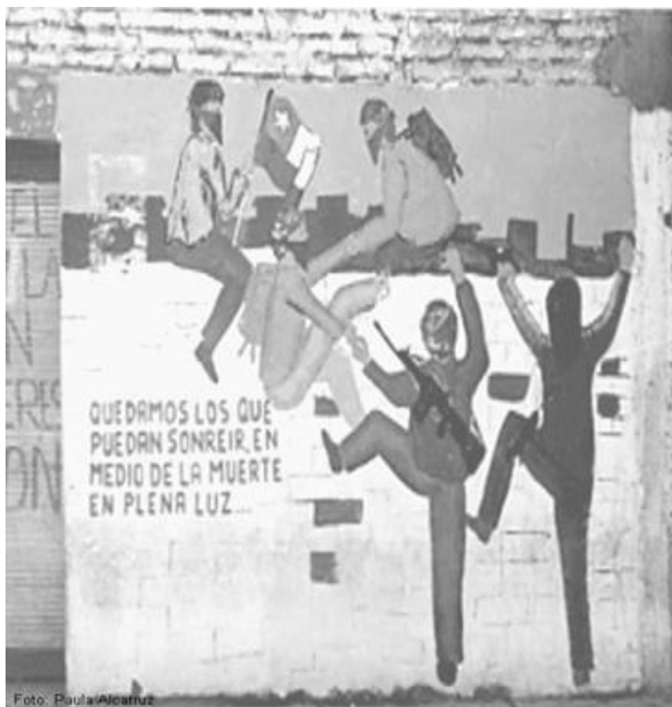
Población La Victoria