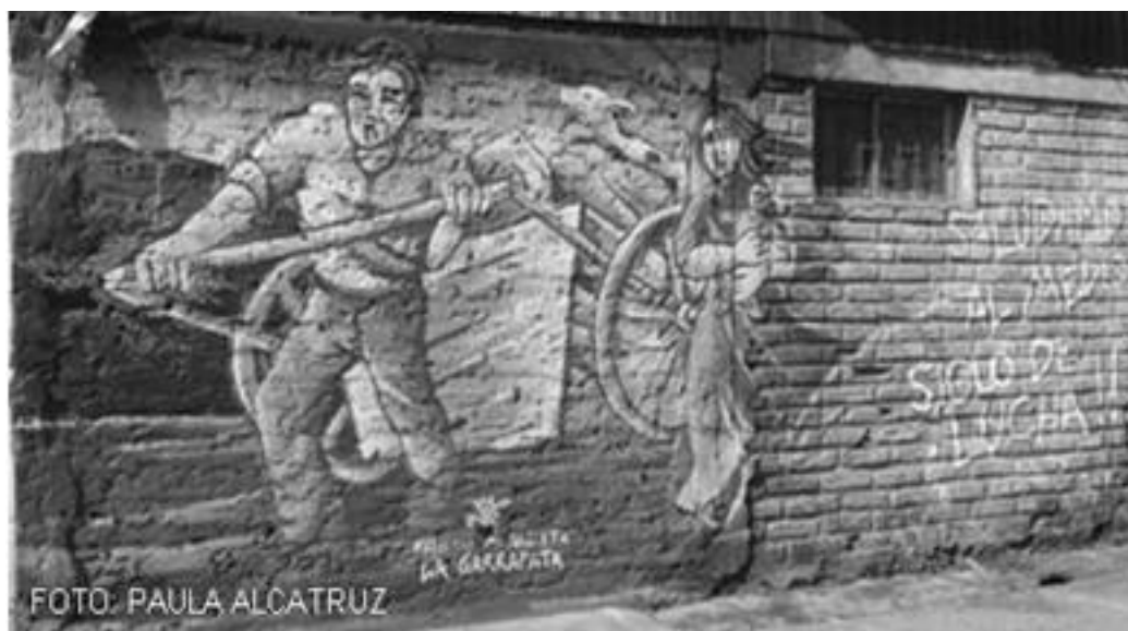
Imagen 39: Medio siglo de Lucha, La Victoria, 2007