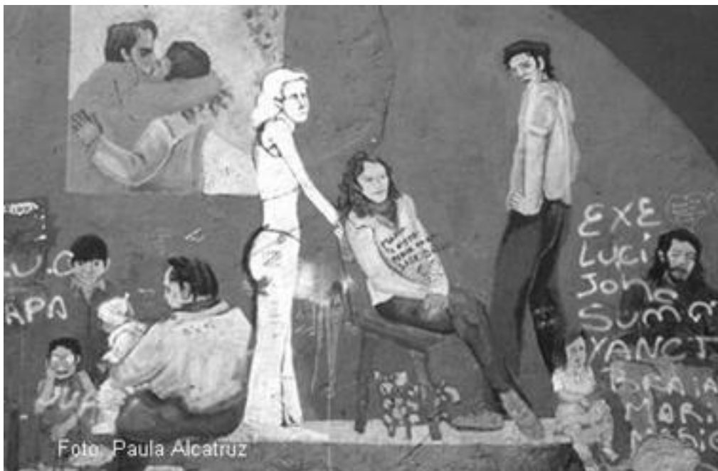
Imagen 72: Mural base de “Los desaparecidos de La Boca” en barrio La Boca, Buenos Aires

En el caso de La Boca no se pudo pesquisar un mural con características similares. En una primera instancia se pensó que el mural de los desaparecidos podía ser un caso cercano de mural emblema; sin embargo tras una mayor profundización en terreno se dio cuenta que el mural creado en el 2006, difería de la motivación del mural que en ese