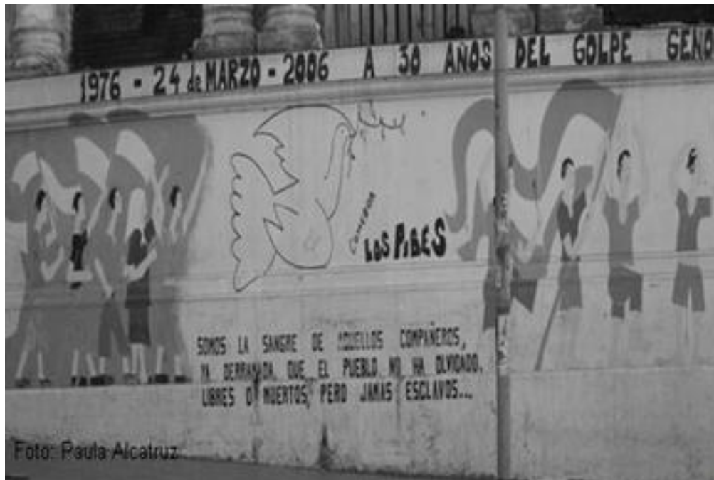
Imagen 56: mural Buenos Aires, La Boca 2006