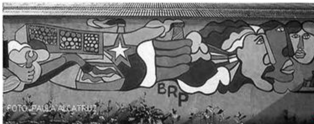
Imagen 18: mural realizado en Santiago por la Brigada Ramona Parra en 1972.

Lentamente el pintar consignas en las paredes se fue consolidando. Ellas difundían las medidas del gobierno, apoyaban a distintas causas sociales, pero también y de manos de la Brigada Roberto Matus se realizaría parte de la campaña del terror realizada durante el gobierno de Salvador Allende por la oposición 89 .