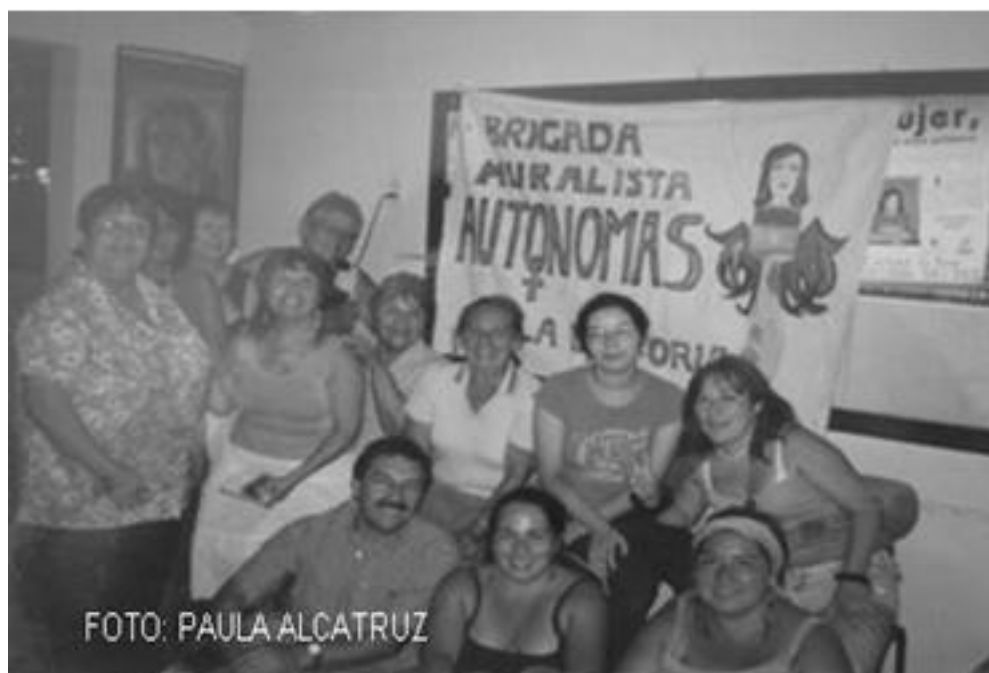
Imagen 52: Brigada muralista Autónomas, diciembre 2006.

El trabajo de las Autónomas no se limita a la creación de murales de denuncia sino también buscan crear lazos para el fortalecimiento de los derechos de la mujer. Así mediante uno de los aportes del fondo iniciativas 2005 de Fundación Alquimia logran realizar una serie de actividades como talleres de muralismo con dos organizaciones barriales de género Mujeres Hoy de Lo Espejo y Fortaleza de Mujer de Ñuñoa. 142