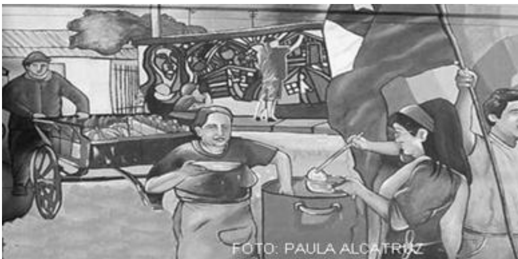
Imagen 5: detalle de mural modificado digitalmente para efectos de investigación

Observemos con atención la imagen que antecede: ¿qué puede verse en ella?, ¿por qué fue creado el mural?, ¿qué objetivos e historias esconde?, finalmente ¿qué ideas evoca la imagen en el lector? Estas preguntas tienen diversas respuestas, tantas como espectadores tenga el mural, muchas pueden encontrar contradicciones entre ellas, pero eso no resta importancia a cada interpretación, después de todo, esa la principal característica del arte, la multiplicidad de interpretaciones y diálogos que se enfrentan sobre la pieza plástica. En este caso un mural en plena calle central de una población de Santiago.