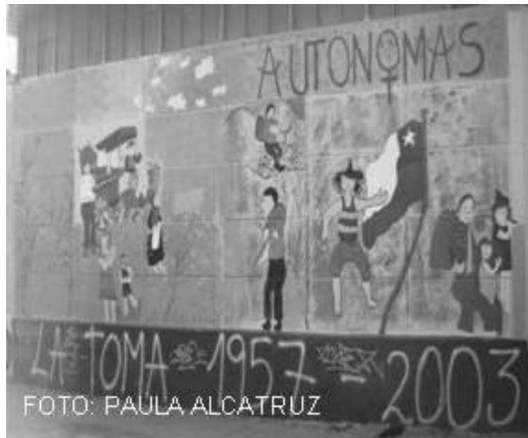
Imagen 37: La Toma, brigada Autónomas, La Victoria, 2003