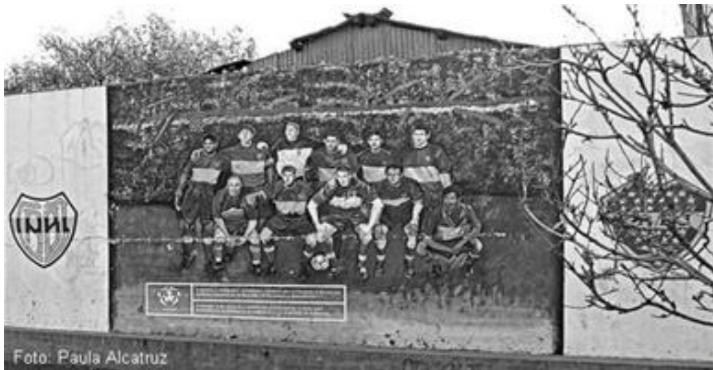
Imagen 47: Mural La Mitad más Uno, Boca Juniors

en abril de 1905 cuando cinco jóvenes inmigrantes italianos del barrio de La Boca deciden fundar un club de fútbol. 131