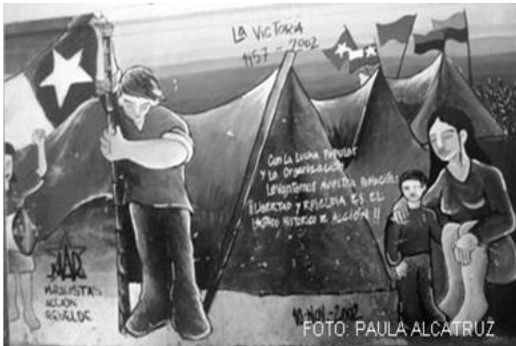
Imagen 40: La Victoria, La Victoria 2002.

Los murales encierran un conjunto de memorias, ya que el tema central la toma es resignificado por cada espectador en razón a sus propias experiencias, las que se superponen conformando un universo interpretativo tan diverso como enriquecedor tal como menciona Jelin. 117