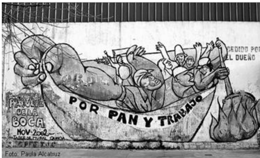
Imagen 31: Por pan y trabajo La Boca Buenos Aires Argentina 2002.