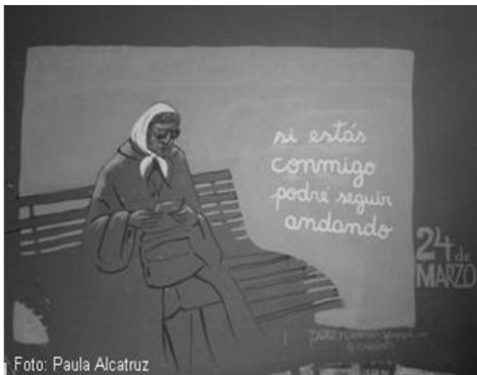
Imagen 69: realizado en La Boca, Buenos Aires