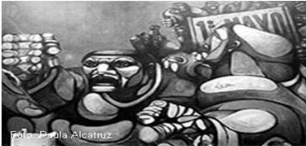
Imagen 14: Mural de Ricardo Carpani perteneciente al grupo Espartaco titulado 1° de Mayo, ubicado en el sindicato de los obreros del vestido (4m. x 5,50m) creado en 1964, Buenos Aires.

En dicho manifiesto se expone como el arte actúa como un arma de combate, siendo entonces un mecanismo visual intermediario entre las tensiones de la vida en sociedad y las esperanzas de la comunidad, en razón de ello se expone: “el arte, no puede ni debe estar desligado de la acción política y de la difusión militante y educadora de las obras en realización. El arte revolucionario latinoamericano debe surgir, en síntesis, como expresión monumental y pública. El pueblo que lo nutre deberá verlo en su vida cotidiana. De la pintura de caballete, como lujoso vicio solitario hay que pasar resueltamente al arte de masas, es decir, al arte.” 82