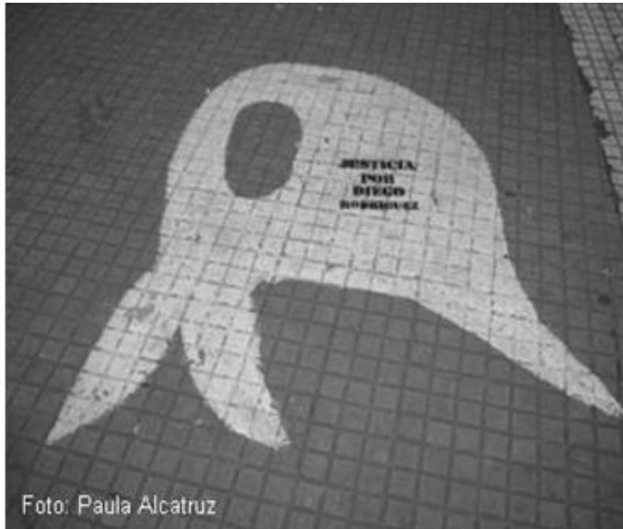
Imagen 68: estencil realizado en el suelo de la Plaza de Mayo, Buenos Aires

La mayoría de los denunciados eran mujeres, madres de los detenidos, las que lentamente fueron siendo conocidas por su incansable búsqueda y por su pañuelo distintivo. “Mira el pañuelo es el símbolo de las madres de mayo, es mundial y ahora lo que tu ves pañuelo, no es más que un pañal de tela por eso es un símbolo de madres, yo lo sé porque estuve en la plaza esa vez.” 181 Aludiendo a la primera vez que las madres se reunieron en la plaza de mayo con ese distintivo.