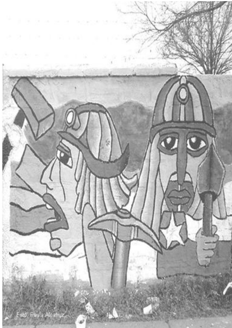
Homenaje a los 33 mineros, Santiago 2010