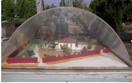
Ilustración 5. Maqueta