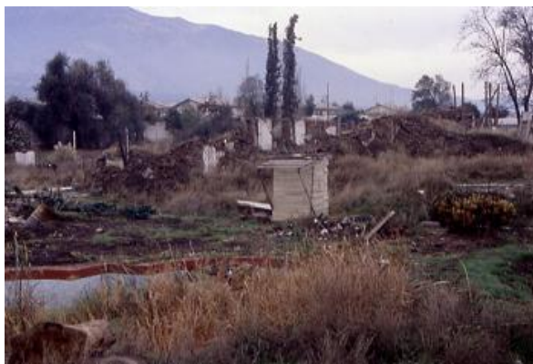
Ilustración 4. Villa Grimaldi destruida