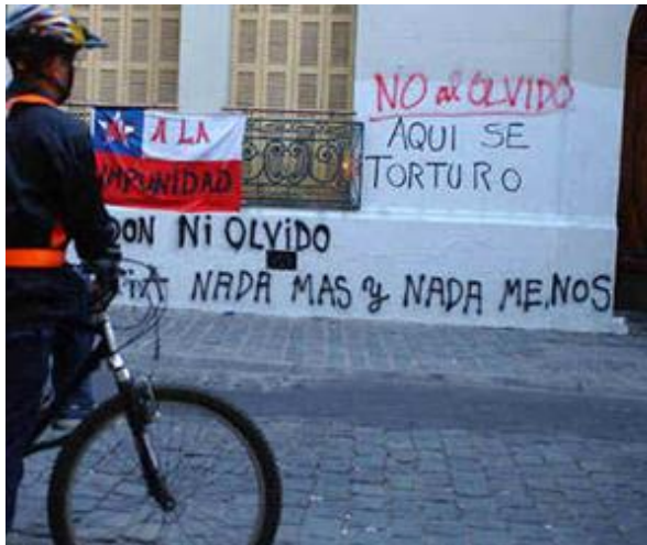
Ilustración 2. Londres 38