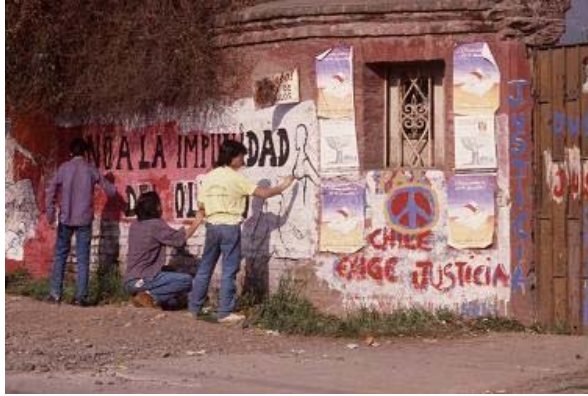
Ilustración 1. Villa Grimaldi