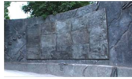
Ilustración 9. Muro de los nombres