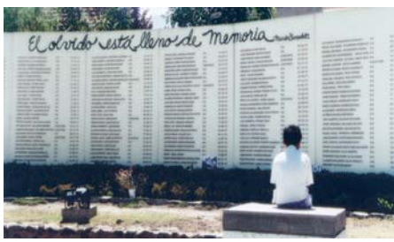
Ilustración 10. Muro de los nombres