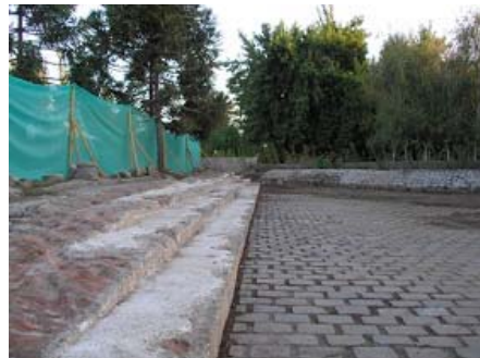
Ilustración 12. Puesta en valor restos arquitectónicos mansión Villa Grimaldi