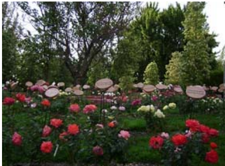
Ilustración 8. Memorial Rosas de Villa Grimaldi