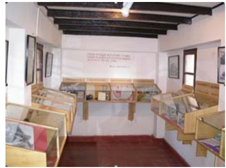
Ilustración 7. Sala de la memoria