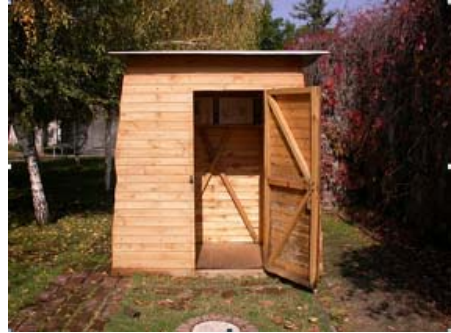
Ilustración 6. Celda (reconstrucción)