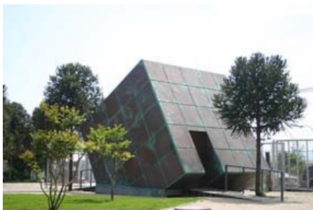
Ilustración 11. Monumento rieles