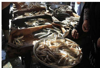
Tribunal Constitucional rechaza recursos contra Ley de Pesca