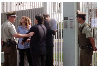
Militantes UDI y grupo de apoyo a Cuba protagonizaron altercado frente a embajada