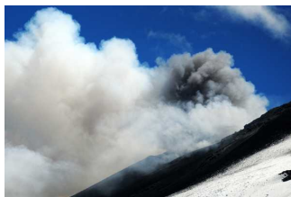
Elevan nivel de alerta por actividad del volcán Copahue a "naranja"