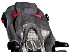
Safety 1st Silla de Auto Convertible Deluxe 3 En 1 Stonewood