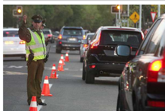
Desvíos de tránsito por Celac-UE se concentrarán en tres puntos de la RM