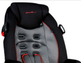
Safety 1st Silla de Auto Comfort Booster Lakewood