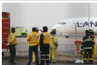
Un imprevisto obligó a vuelo LAN a aterrizar "por precaución" en Copiapó