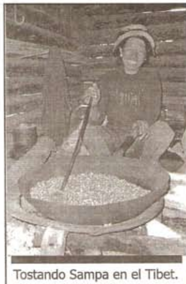
Tostando Sampa en el Tibet.

Vivimos en medio a una civilización bizarra, enfermiza, esquizofrénica y enajenadora. La plena realización de la vida en todas sus potencialidades, belleza, placeres, se niega para favorecer al constante mantenimiento de todos los elementos e instituciones que sostienen a la civilización, la jerarquía y sus relaciones desiguales entre las personas, el patriarcado y la división sexual del trabajo, el Estado con sus fronteras, masacres y guerras, la explotación económica y dominación insalubre de la naturaleza con la modificación y destrucción de sus plantas y animales;