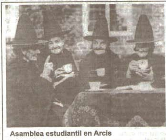
Asamblea estudiantil en Arcis

Ahora el hecho aun no se acaba, es mas se agrava a la casa de estudiantes llega la brigada del crimen de la policía de investigaciones "los ratis" con una orden para ir a declarar a investigaciones, por que adivinen que, demandaron a los estudiantes con penas