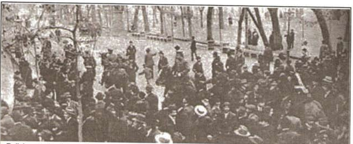
Policia arresando manifestantes, luego de un meeting en 1912