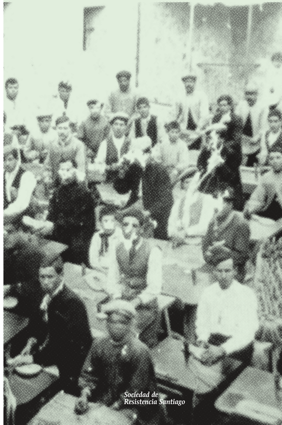
Sociedad de Resistencia Santiago