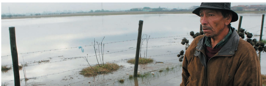
Inundaciones en el sector de Lampay Batuco, Región Metropolitana. 28 de junio de 2006.