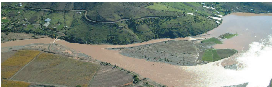
Desborde del río Tulaheuen, sector el Tome, comuna de Monte Patria, 300 metros aguas debajo de la Quebrada de Cárcamo, y 2 km al sur de la entrada al embalse La Paloma. Fotografía tomada desde un helicóptero durante los temporales de julio de 1997.