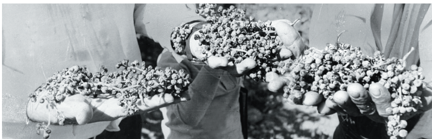
En la fotografía, Santa Cruz: otra muestra de la cruel sequía que ha azotado a esta zona. Agricultores exhiben muestras de uvas en la Viña Nerquihue, cuyos racimos y la fruta misma son de tamaños sumamente inferiores a otros años. Sequía de 1968-1969.