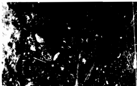
Nº 1: Ch11 Rep 05. Caverna con restos óseos en las Guaitecas (saqueada).

Los fechados radiocarbónicos (RC1 4) de estas muestras arrojaron los siguientes resultados: sitio Ch 11 Rep 02 (conchal abierto), fecha el momento inicial de la ocupación Beta 12767, años 2.430 \pm 80 BP, y sitio Ch 11 Ben 01 (alero con entierros superficiales) fecha de las cortezas de ciprés que sirven de cama a los restos óseos humanos Beta 12768, años 410 \pm 70 BP. La última fecha revela el carácter tardío de la práctica mortuoria, documentada etnohistóricamente como típica del grupo chono.