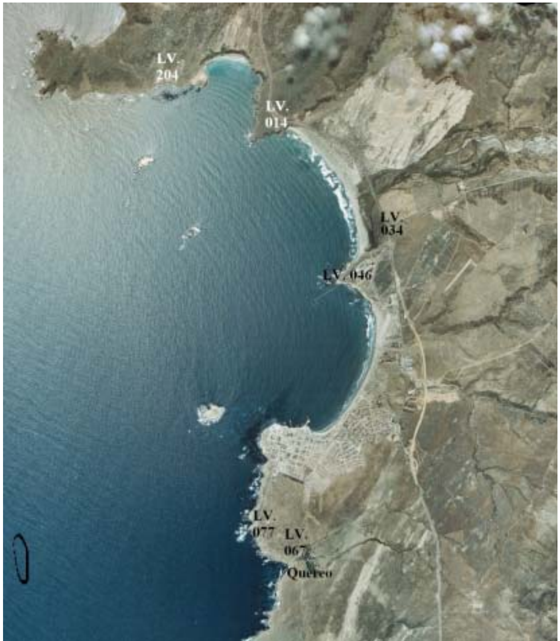
Figura 2. Área de estudio y asentamientos del Holoceno tardío. Study area and late Holocene settlements discussed in text.

Su potencia estratigráfica (entre 30 y 40 cm), en conjunto con la variedad en la explotación de invertebrados y las características de su industria tecnológica, aluden a una funcionalidad residencial, más alejada del litoral. Se planteó que el asentamiento sería asignable al Complejo Cultural Papudo, característico del Holoceno medio, aunque en tiempos más tardíos (Barrera y Belmar 2000).