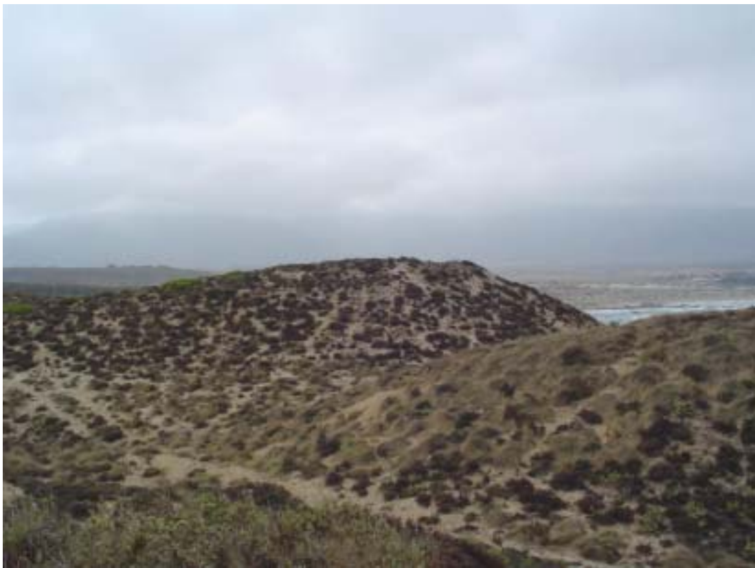
Figura 3. Basurales conchíferos monticulares del sitio de Punta Chungo (LV. 046a). Shell midden mounds at the Punta Chungo site (LV. 046a).

Una descripción casi idéntica podría ser sostenida para Punta Chungo B (LV. 046b). Este asentamiento, muy próximo al anterior (400 m), se emplaza sobre un sistema de dunas y corresponde a un gran montículo de conchal con escasas evidencias superficiales (Jackson y Méndez 2004). Una intervención de 6 unidades de excavación (18 m 2 )