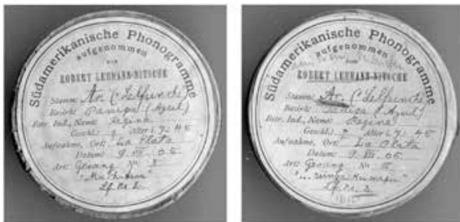
Imagen 2: Detalle de los cilindros 2 y 3 grabados a Regina el año 1905 y conservados .en el Museo Etnológico de Berlín.