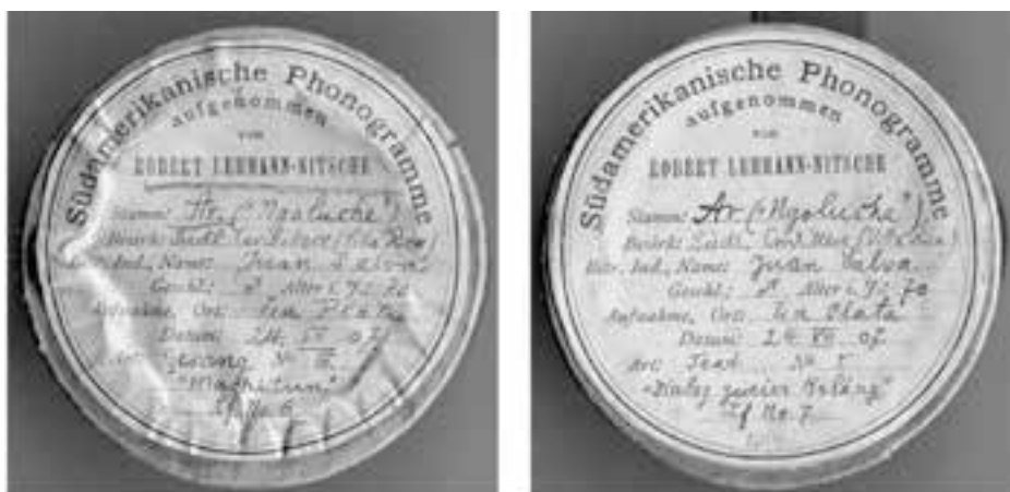
Imagen 3: Detalle de los cilindros 6 y 7, grabados a Juan Salva el año 1907 y conservados en el Museo Etnológico de Berlín.