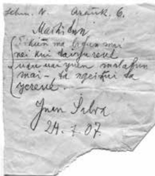
Imagen 5: Hoja con la transcripción del “machitun” interpretado por Juan Salva y conservado en el Museo Etnológico de Berlín.