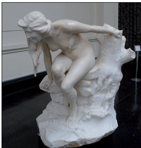
Figura 2. El Eco, mármol. MNBA Santiago.

Las obras en bronce más notables que se pueden apreciar en Chile son el Monumento a los Héroes de la Concepción en la Avenida Libertador Bernardo O’Higgins, y el grupo escultórico ya mencionado en el Museo de Bellas