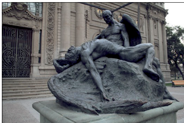
Figura 1. Dédalo e Ícaro, bronce. MNBA Santiago. http://www.plataformaurbana.cl/archive/2012/05/22/guia-urbana-de-santiago-museo-nacional-de-bellas-artes/67-2/

Hospital Dr. Exequiel González Cortés, Universidad de Chile.