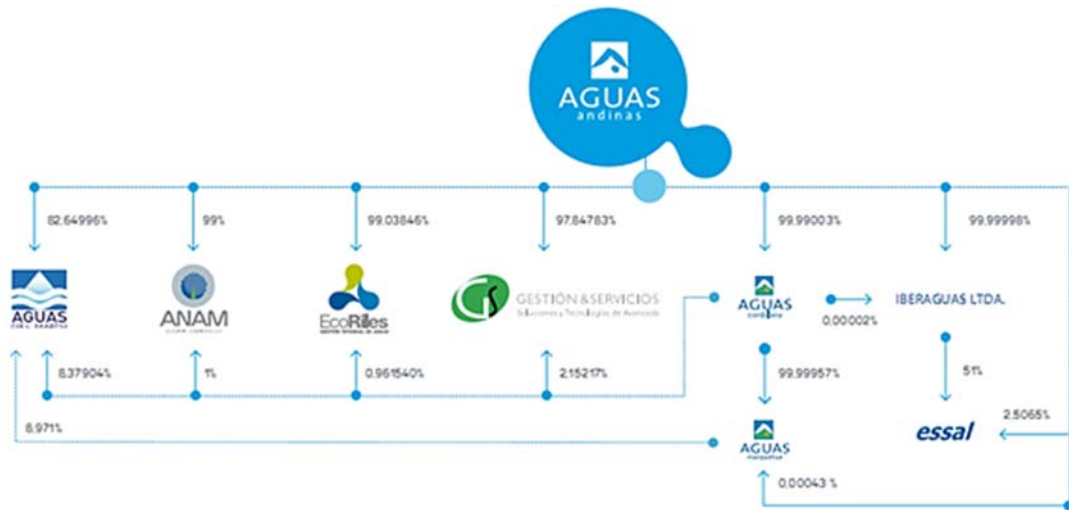
i Esquema Societario - Grupo Aguas

Es posible apreciar de manera simplificada la estructura del Grupo Aguas a través del siguiente esquema: