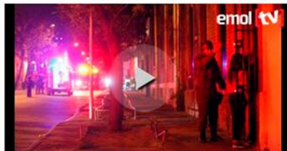
Primeros instantes tras el atentado