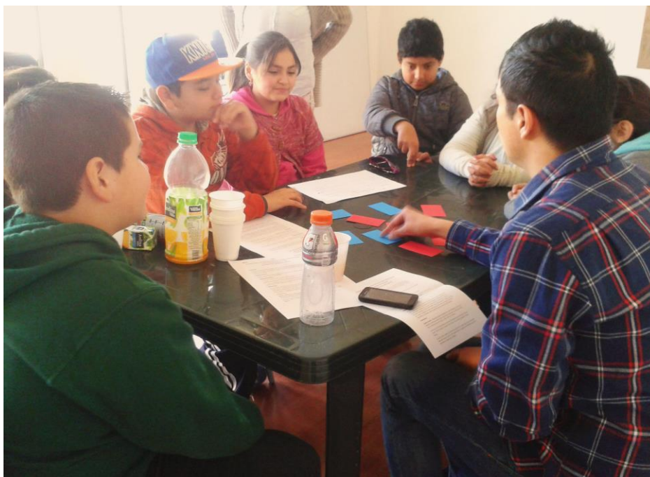
Primera reunión del equipo de la Radio JGM con el Consejo Comunal de la Niñez y las Juventudes.

Finalmente, dijeron que podrían invitar al alcalde de Recoleta, Daniel Jadue 33 , a conversar con ellos en la radio. Todas estas ideas las anotamos para trabajarlas en el futuro.