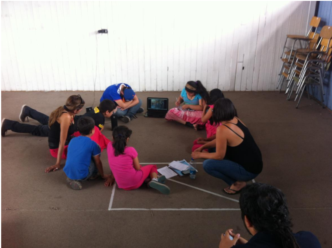
Reunión del Consejo en la Biblioteca Comunitaria de Recoleta.