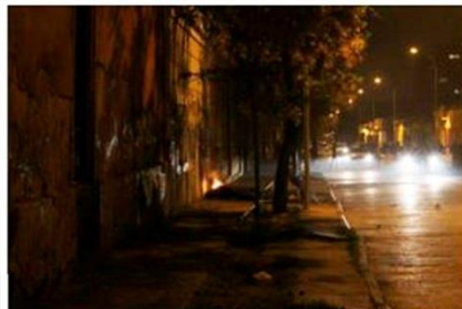
El estallido ocurrió en el sector de calles Erasmo Escala y García Reyes y fue captado en imágenes subidas a redes sociales.