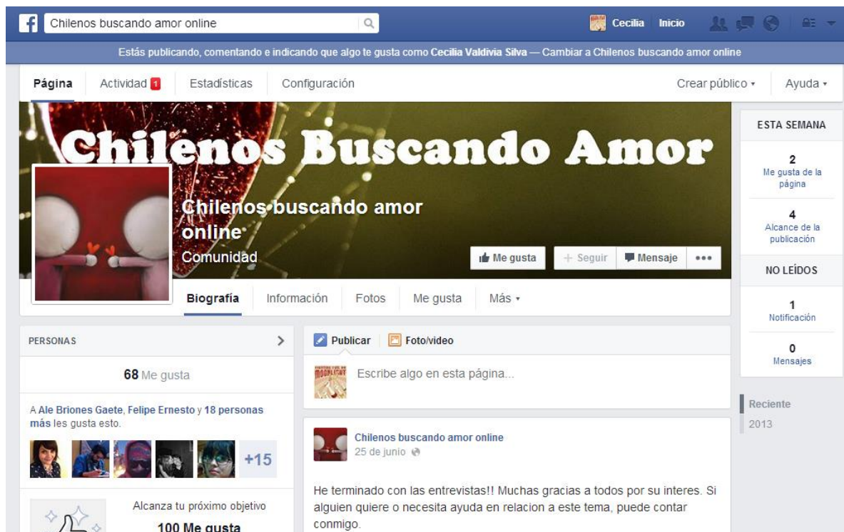
Pantalla de inicio de la página en Facebook

Visualmente la página luce de la siguiente manera.