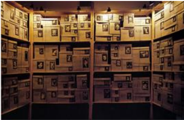
Instalación Christian Boltanski .