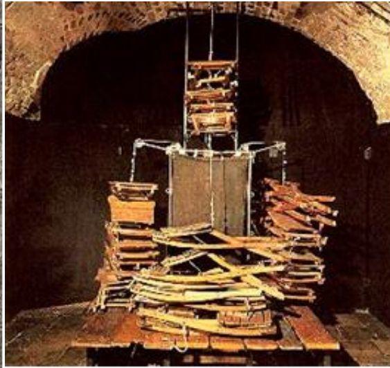
Escenografía de Tadeusz Kantor