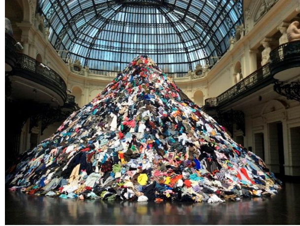
"Personas" de Christian Boltanski. 2014. Museo Nacional de Bellas Artes. Santiago, Chile.