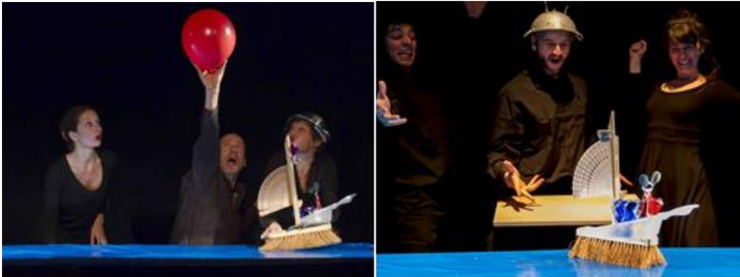
Montaje escénico "La llamada del mar" de Philippe Genty.

su funcionalidad cotidiana para dar virtud a su poder poético. Allí nace un Teatro de Objetos. Lo que hace el Teatro de Objetos, es dar vida a esa inactividad 103 , y a su vez, el espectador es responsable y vulnerable a otorgarle dichas lecturas y de empatizar con el juego y poéticas que se proponen. Como cuando niños, en donde todo puede gozar de una condición "animista".