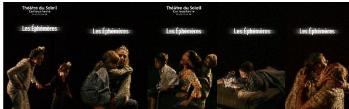
Afiche obra " Les Éphémères ". Théâtre du Soleil. 2006. Realizado por Thomas Félix-Francois.

Este recurso gráfico, que expresa precisa y delicadamente el mensaje resultado y gestacional de la obra, se ha servido por lo tanto del trabajo en serie, de apropiación, de superposición de textos y de acumulación, tal como vimos en los artistas mnémicos, tal como vimos en la alegoría, tal como vimos también en el collage y en el fotomontaje; tal como ya sabemos funciona nuestra memoria, modo de almacenar sus recuerdos y más aún, de ser recuperados.