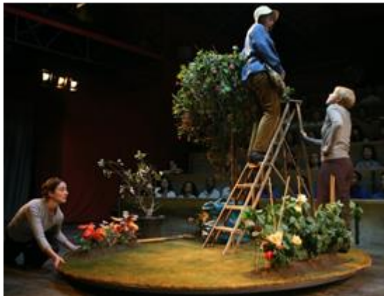
Fotografía función obra "Les Éphémères" del Théâtre du Soleil. 2007.

protagoniza Macbeth en su último espectáculo, es también un gran e importante escenógrafo en Francia en proyectos anteriores y paralelos al Soleil.