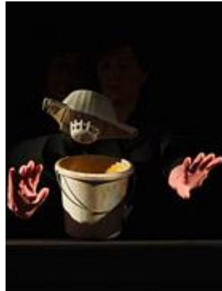
Montaje escénico "Las cosas de la vida" de Tastram Teatre. España