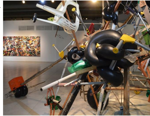
Instalación "Cuando todo el ruido se duerma" de Diego Figuerola. 2014.

Museo Bellas Artes René Brusau. Argentina