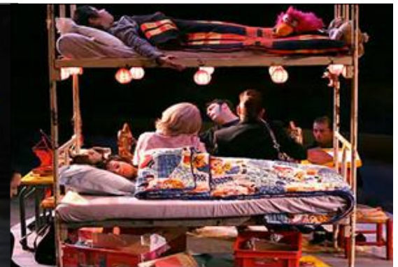
Fotografía función obra "Les Éphémères" del Théâtre du Soleil. 2009. Lincoln Theater Festival