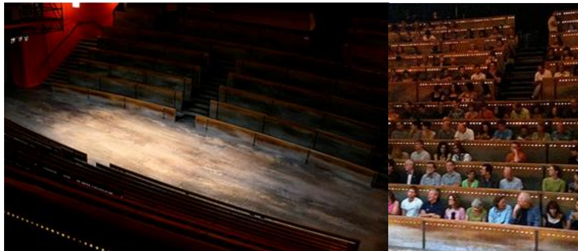
Espacio escénico y extracto espacio espectador en obra "Les Éphémères" del Théâtre du Soleil.