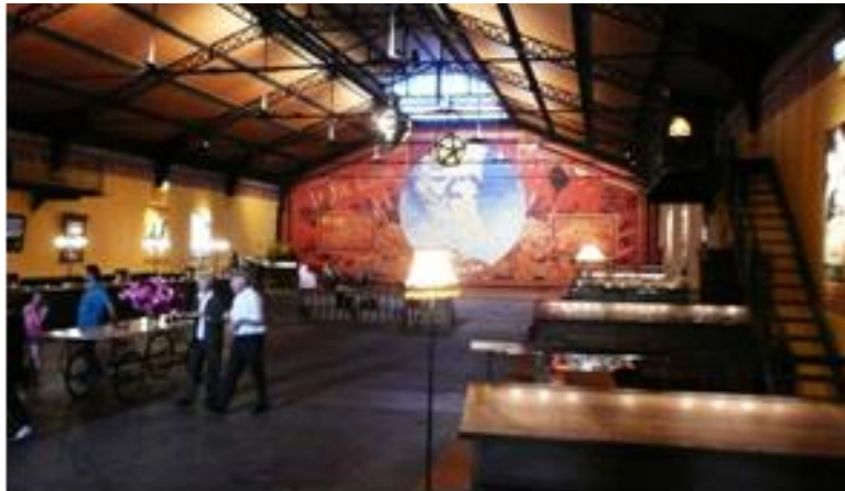
Recepción espectador "Les Naufrages du Fol Espoir" . Théâtre du Soleil . 2010. Cartoucherie. Paris, Francia

lugar, mucho antes del comienzo del espectáculo, se nos instala la "realidad" que nos guiará y envolverá por unos momentos. Una ilusión, consciente y decididamente olvidada; un acuerdo mutuo de convenciones, entre artistas y espectadores.