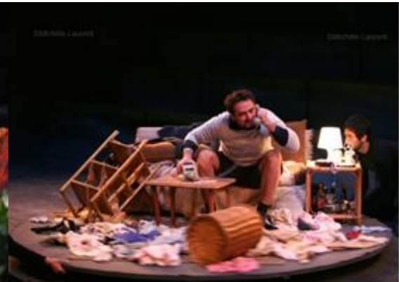
Fotografía ensayo obra "Les Éphémères" del Théâtre du Soleil. 2006. Paris, Francia