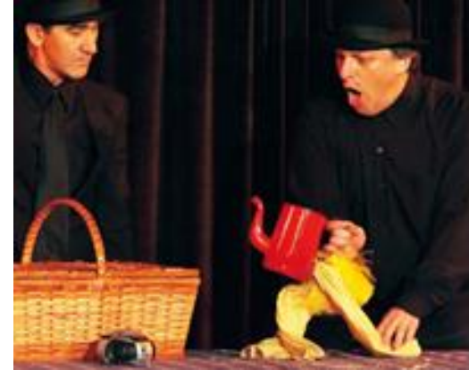
Montaje escénico "Zoo-ilógico" de la compañía Trucks. 2004. Brasil

Tadeusz Kantor, por último, es un importante exponente a la hora de hablar de Memoria a través de la Objetualidad. Pues aparte de ser un artista íntegro perteneciente en sus inicios al núcleo Vanguardista del siglo XX (las cuales influyen enorme y permanentemente en sus obras con la incorporación de objetos de desecho en sus puestas en escena y "extrañas" marionetas, por ejemplo), hace de su utilización una evocación a la memoria refiriéndose directamente a la muerte, al olvido. Al pasado, lo que ya fue y por lo tanto murió: "Decidí