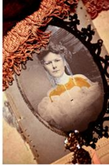
Detalle de obra en proceso de Mónica Canilao , en visita a estudio. 2012.