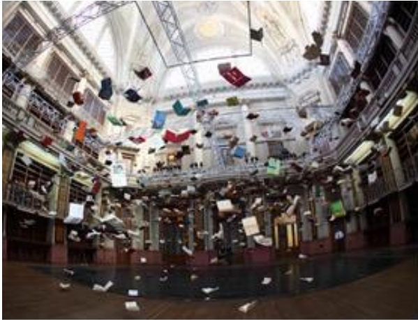
"Flying Books" de Christian Boltanski. 2012. Universidad Nacional de Tres de Febrero. BsAs, Argentina