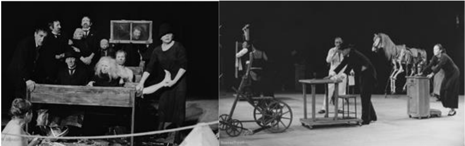
Montaje escénico "Una clase muerta" de Tadeusz Kantor. 1975

carpintero, el que ya casi no sirve para nada y se amontona en el aserrín. Es el objeto que se convierte, en ocasiones, en un pedúnculo más del personaje creando en esta hibridación un monstruo de carne muerta y materia inorgánica" 105 . Dicha descripción es lo que el mismo Kantor denomina Bio-Objeto, haciendo referencia al ensamble y tensión generada entre el sujeto y el objeto.