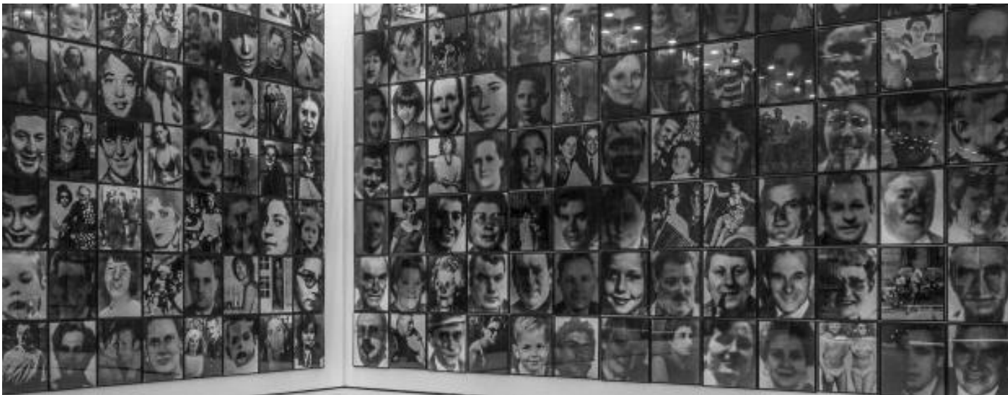
Instalación "Holocaust" De Christian Boltanski. 2012.