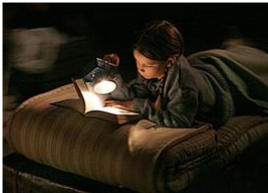
Fotografía ensayo obra "Les Éphémères" del Théâtre du Soleil. 2006. Paris, Francia