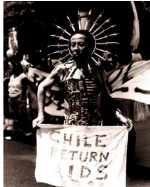
Performance intervención en marcha de Stonewall. Pedro Lemebel. 1994. New York, Estados Unidos.