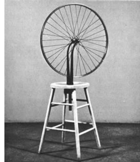
Ready-made "La rueda de bicileta" de Marcel Duchamp.