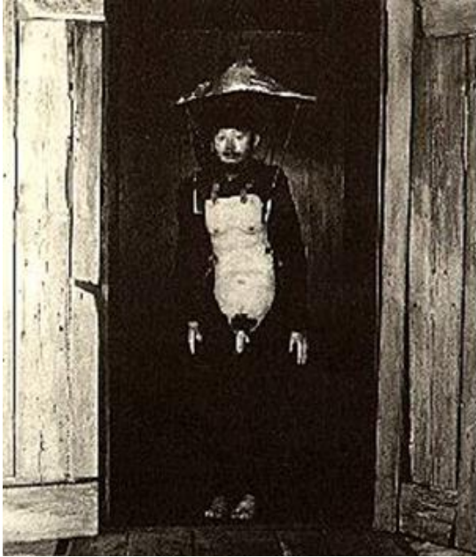
Performance de Tadeusz Kantor