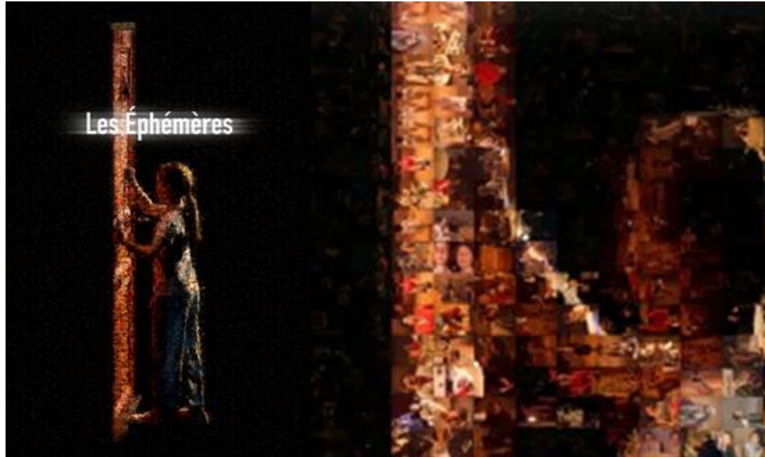
Afiche y detalle affiche obra "Les Éphémères". Théâtre du Soleil. 2006. Realizado por Thomas Félix-Francois.