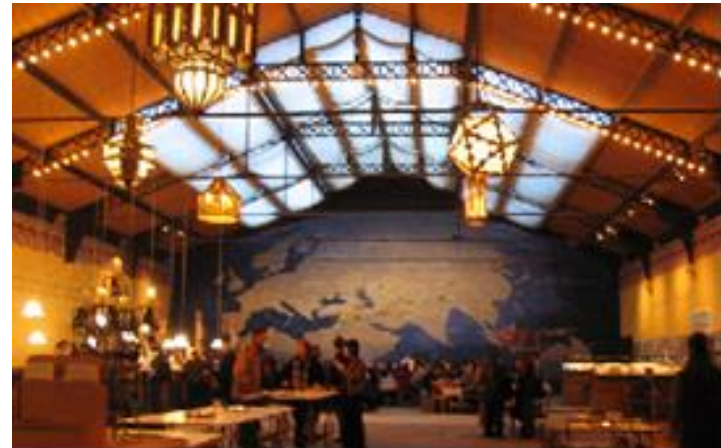
Recepción espectador "Le Dernier Caravansérail" . Théâtre du Soleil . 2003. Cartoucherie. Paris, Francia