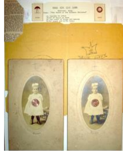
Collage "La marcha de las siameses" de Álvaro Sánchez .