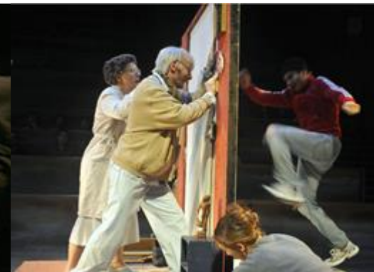
Fotografía ensayo obra "Les Éphémères" del Théâtre du Soleil. 2006. Paris, Francia