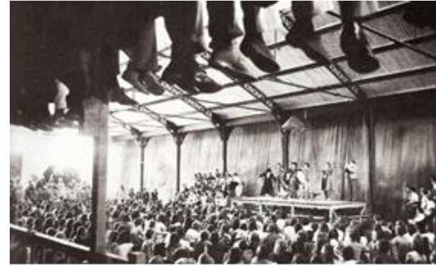
Recepción espectador "1973".

Théâtre du Soleil. 2014. Cartoucherie. Paris, Francia