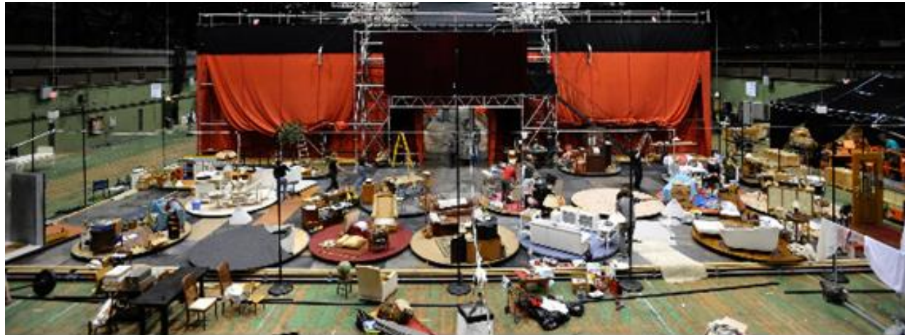
Montaje tras bambalinas obra "Les Éphémères" del Théâtre du Soleil. 2009.

resonancia muy fuerte. Estos mini-mundos, familiares, nos hablan del gran mundo' 147 . Mundos que a medida que aparecen por un costado del escenario, por el otro va desapareciendo el anterior; estamos frente a un constante fluir que nos lleva tanto al recuerdo como también al olvido, al dejar pasar y estar abiertos a recibir al que viene.