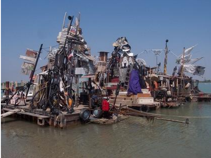
Instalación "Invisible city" de Swoon.