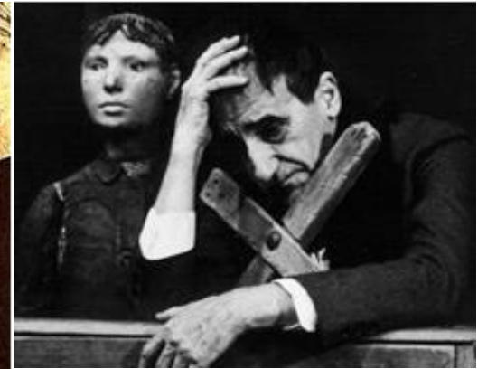
Tadeusz Kantor en montaje escénico "Una clase muerta". 1988. Kraków.

En todos los casos descritos podemos rescatar como elemento transversal la reiteración, ya sea para insistir sobre una poética, concepto o idea, o bien en su visualidad. Pues con ella hacemos instantáneamente un trabajo de memoria, un no olvido, una insistencia en el recuerdo y volvemos a las bases de nuestra conformación de identidad. Como dice Bachelard "la identidad está hecha de reiteraciones". 106