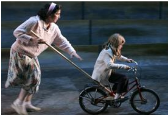
Fotografías ensayo obra "Les Éphémères" del Théâtre du Soleil. 2006.