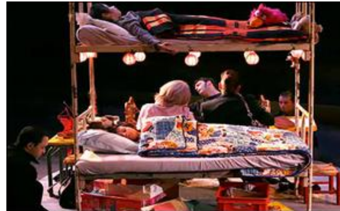
Fotografía ensayo obra "Les Éphémères" del Théâtre du Soleil. 2006.