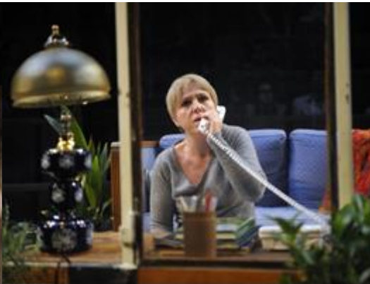
Fotografía función obra "Les Éphémères" del Théâtre du Soleil. 2009. Lincoln Theater Festival