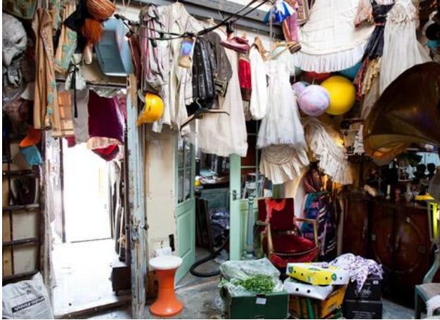
Instalación "The Pale Blue Door" pop-up. de Tony Hornecker.