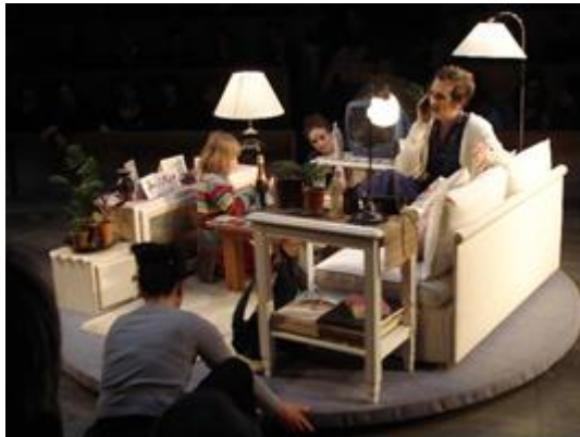
Fotografía ensayo obra "Les Éphémères" del Théâtre du Soleil. 2006. Paris, Francia