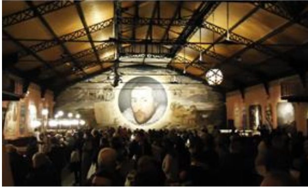
Recepción espectador "Macbeth".

Théâtre du Soleil. 2014. Cartoucherie. Paris, Francia