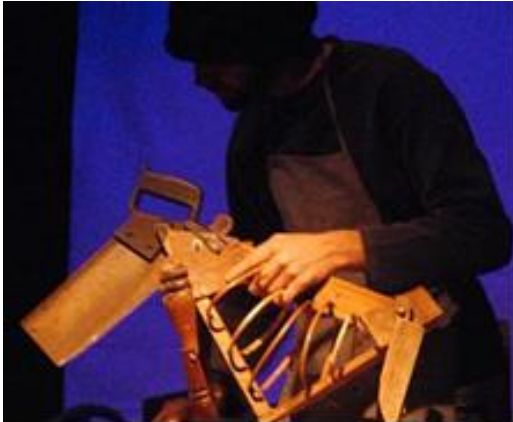
Montaje escénico "Xilodrama" de la compañía Astilla. México.