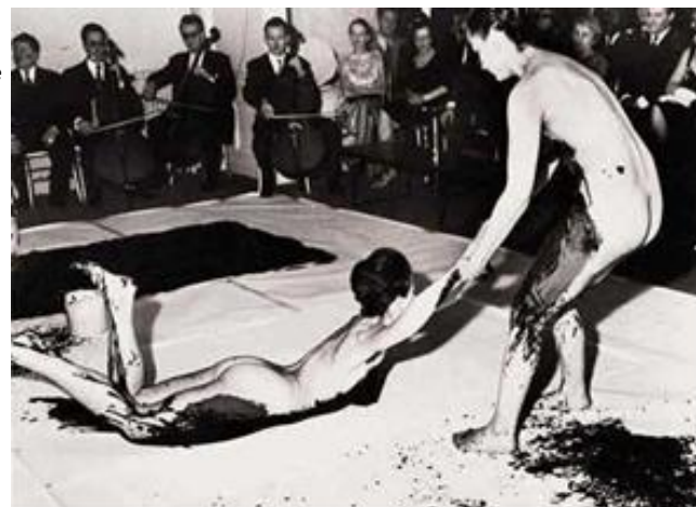
Performance "The Monotone Symphony" de Yves Klein. 1960.

Galerie Internationa l d'Art Contemporain in Paris.