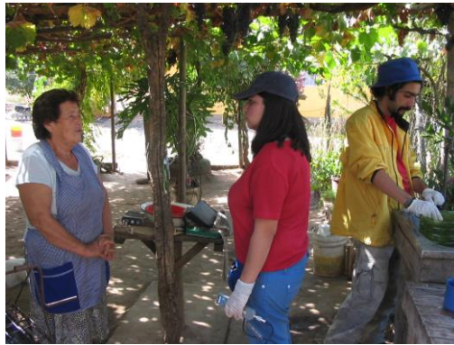
Figura 5. Toma de muestras de agua en los alrededores del Puente Pencahue.