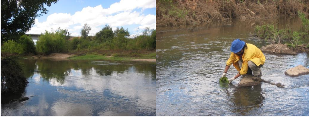
Figura 4. Toma de muestras de agua en el estero Los Puercos, sector Puente Pencahue