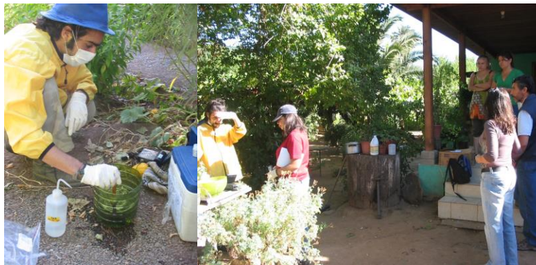
Figura 3. Toma de muestras de agua en los alrededores de la Hacienda Las Palmas