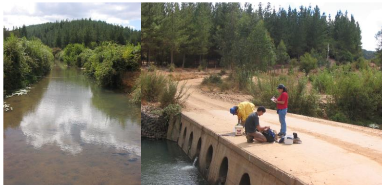
Figura 4. Toma de muestras en el estero San Josito, sector de Botalcura.