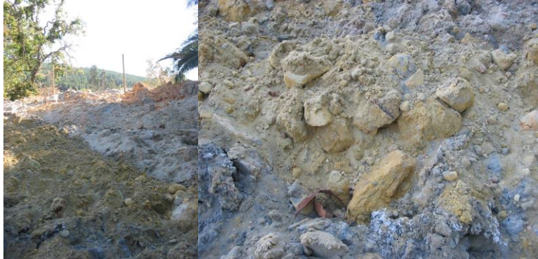
Figura 2. Residuos dejados por el vertimiento de los relaves producto del terremoto en el sector de Hacienda Las Palmas