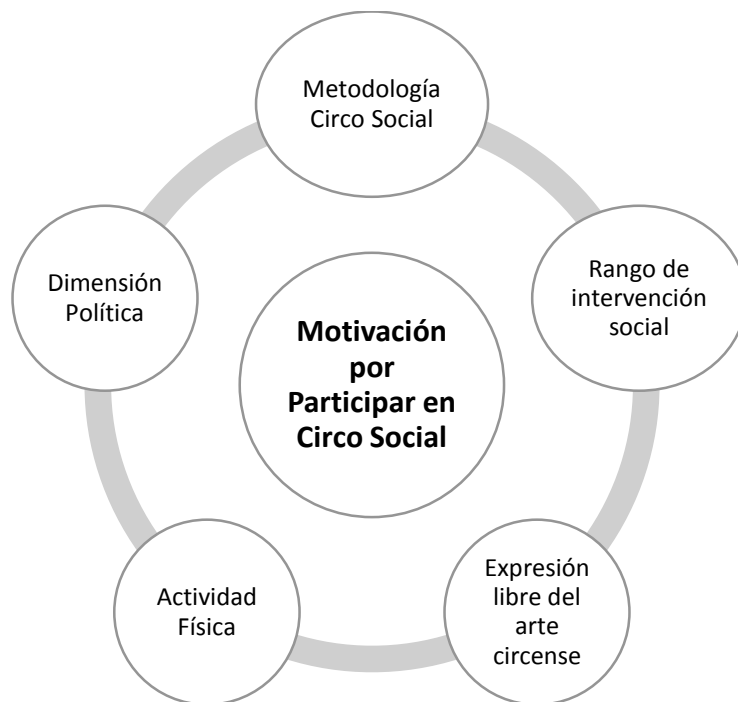
Ilustración 1: Modelo propuesto Elementos motivacionales en participantes de Circo Social en Chile

A modo de resumen, con la revisión de la literatura, las entrevistas en profundidad y juicios a expertos sobre Circo Social, en un comienzo se propone que las motivaciones para participar en espacios de circo que funcionen en base a una perspectiva de transformación social son cinco: