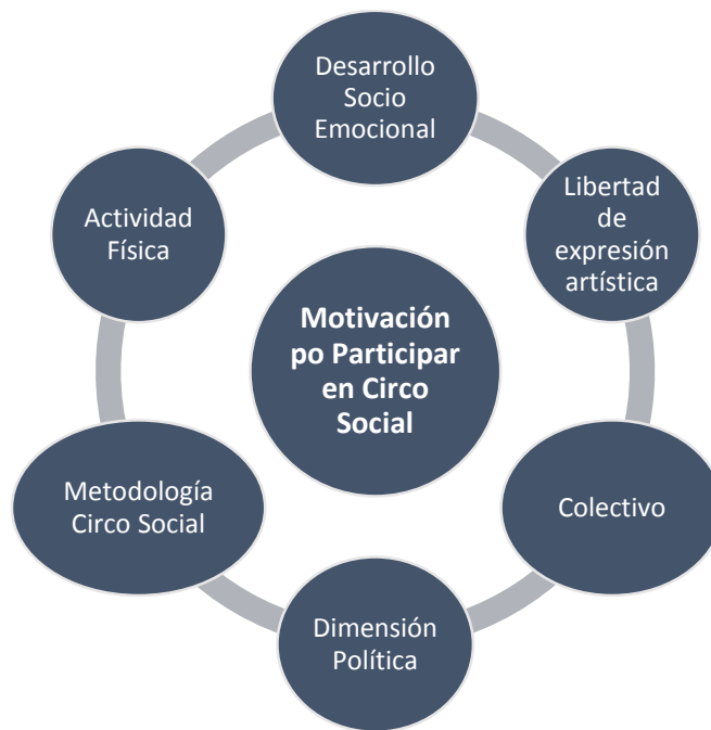
Ilustración 2: Modelo encontrado participación Circo Social

A modo de resumen, con la información recopilada en las encuestas aplicadas, se identificaron seis elementos motivacionales que promueven la participación en Circo Social: