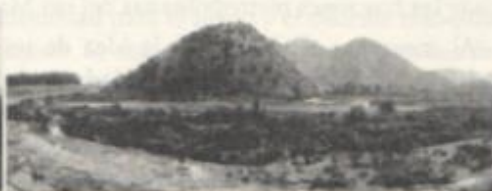
Paisaje del Mapocho, desde la costanera de Talagante. Fre.: M.L.P., 2010