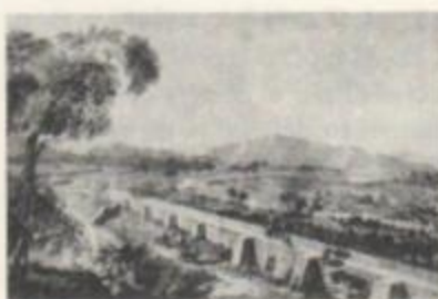
Paseo de los Tajamares, por Brambila, 1790.

Los cronistas alabaron el agrado del paseo vespertino, y la belleza del espectáculo al atardecer, cuando el sol tiñe de rojo las nieves eternas de las altas montañas de la cordillera de los Andes (Peña Otaegui 1944). Estos paisajes fueron pintados y dibujados por los artistas del siglo XVIII y XIX, dejando un testimonio de su belleza bucólica en aquellos tiempos.