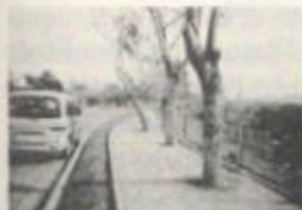
Tramo de la costanera de Talagante.

Pero Muñoz Maluschka fue mucho más allá, cuando, en el curso inferior del Mapocho (micro-región de Santiago), generó una costanera-mirador en Talagante, reinventando el río como parque inundable natural en su proyecto de planificación de esta pequeña ciudad, desde 1945 (Pavez, 2012).