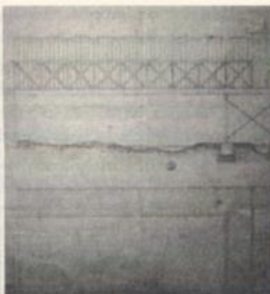
Fig.4. Proyecto de letrinas públicas en el río Mapocho, 1874.