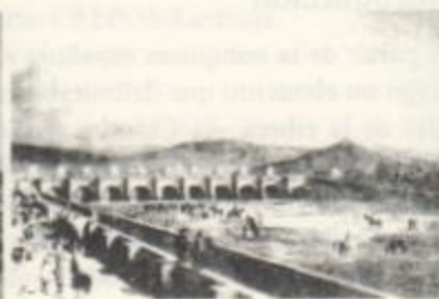
Paseo de los Tajamares, por Wood, 1825.

De las chacras de la zona al norte del río provendría la fruta y verdura para el abasto de la ciudad. Estas eran transportadas en carretas hasta el borde del río, donde se comercializaban. Pasarelas y puentes como el "Puente de Palo", y el "Puente de Cal y Canto" (1782), servirán al atravesado y también de paseo.